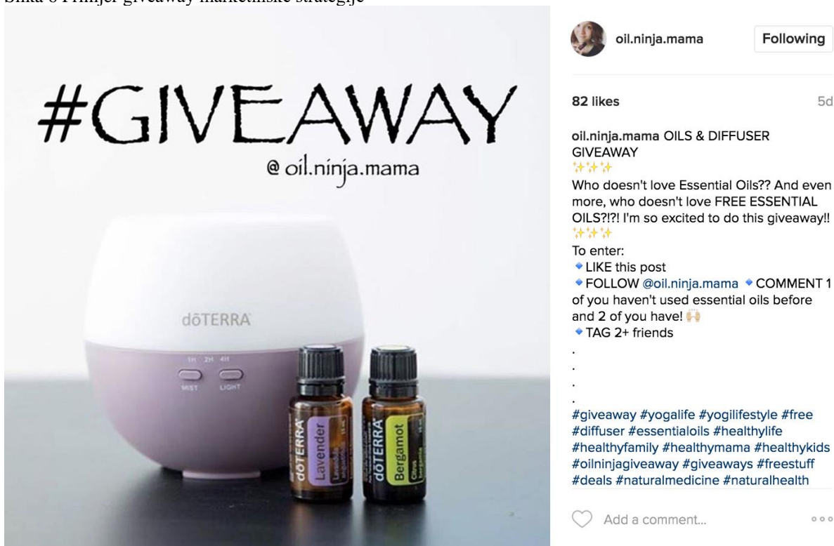
Slika 6 Primjer giveaway marketinške strategije

Giveaway je jedan od novih uspješnih oblika gerilskog marketinga koji je sve popularniji na društvenim mrežama. Da bi sudjelovali u giveawayu korisnici društvenih mreža često moraju informacije o proizvodu podijeliti sa svojim prijateljima i početi pratiti tvrtku koja omogućuje giveaway. Upravo stoga tvrtka stvara veliki pool novih pratitelja gdje može dalje dijeliti promidžbene materijale. Tako se i pokazuje kvaliteta proizvoda te stvara pozitivan odnos između potrošača i poduzeća.