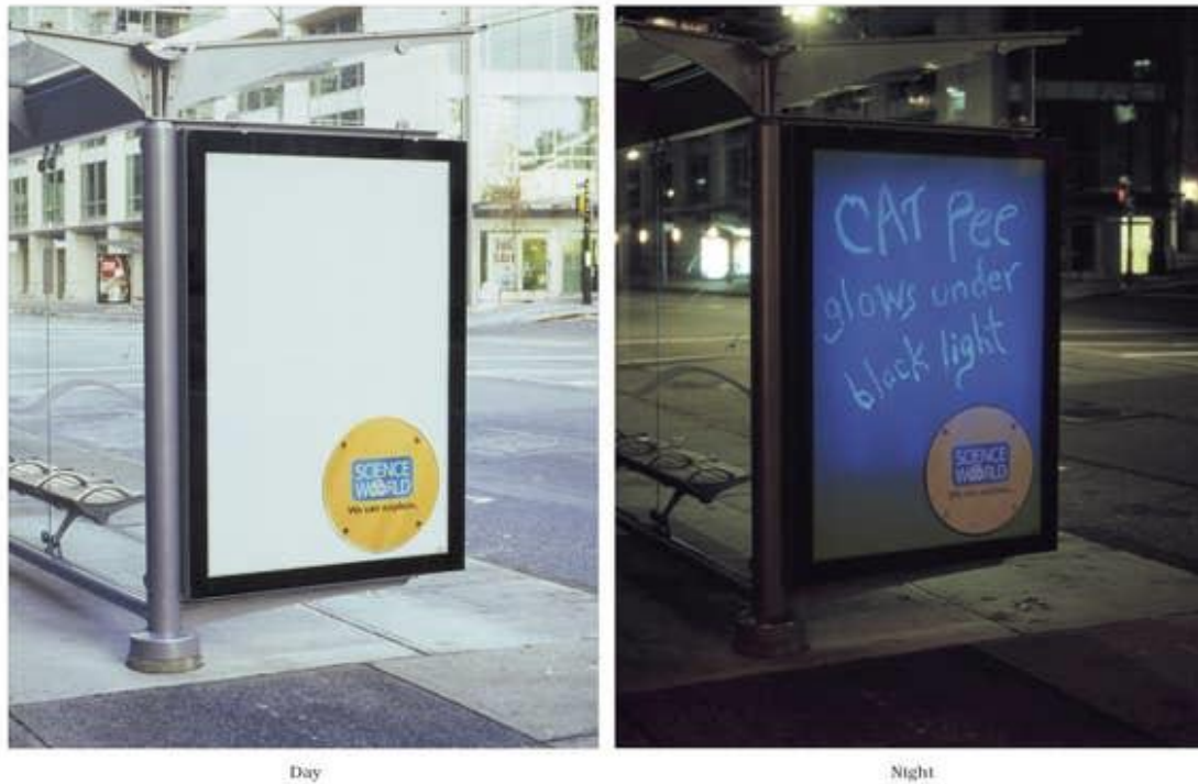
Slika 4 Primjer wait marketinga, Muzej znanosti Vancouver