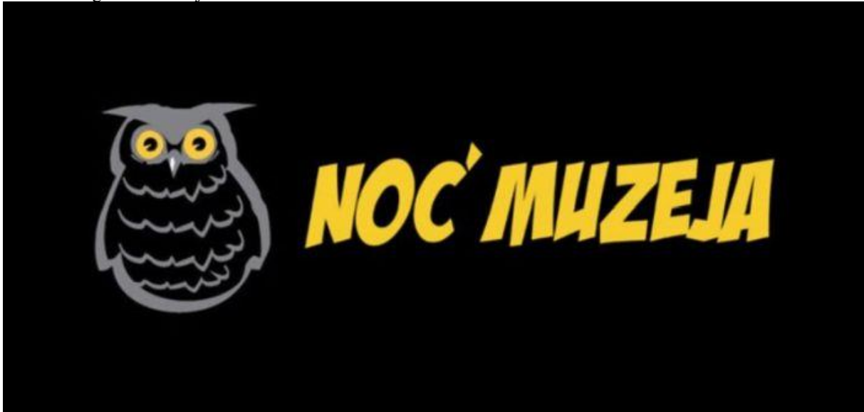
Slika 12 Logo noći Muzeja