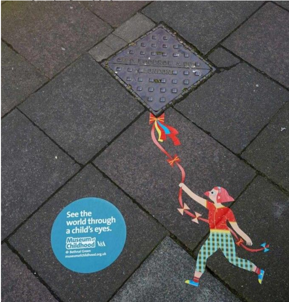
Slika 5 Primjer wild postinga, Muzej djetinjstva