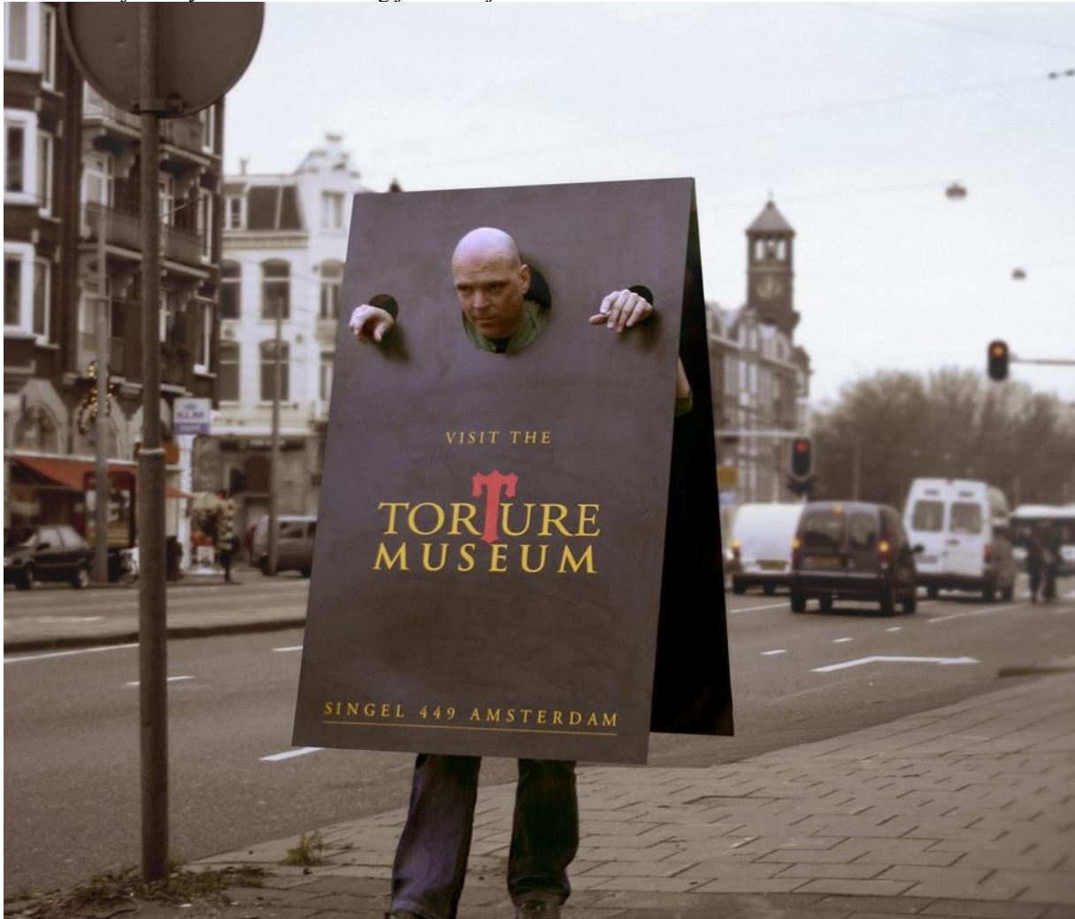
Slika 7 Primjer body marketinške strategije - Muzej torture Amsterdam