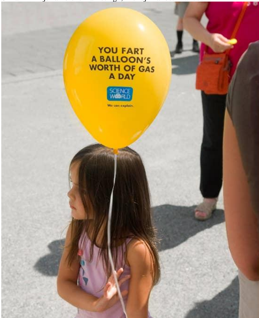
Slika 1 Primjer ambient marketinga, Muzej znanosti Vancouver

Ambient marketing teži staviti naglasak na sam brend, a ne direktno na uslugu ili proizvod koji nudi. Pristup ambient marketinga se temelji na ideji da suptilne stvari koje primjećujemo oko sebe imaju direktan učinak na našu percepciju. Naljepnice na autobusima, na autobusnim stanicama, u kafićima ili čak na svakodnevnim predmetima poput wc školjki mogu ostvariti efekt iznenađenja kod potrošača. Upravo zato ambient marketinška strategija umjesto korištenja bilborda, printanih letaka i televizijskih reklama se temelji na postavljanju reklama na neobične predmete ili neobična mjesta kako bi ih ljudi lakše primjetili. Glavni ključ za uspješnost ove marketinške metode je u postavljanju najboljeg medijskog formata na efektivno mjesto s odgovarajućom porukom.