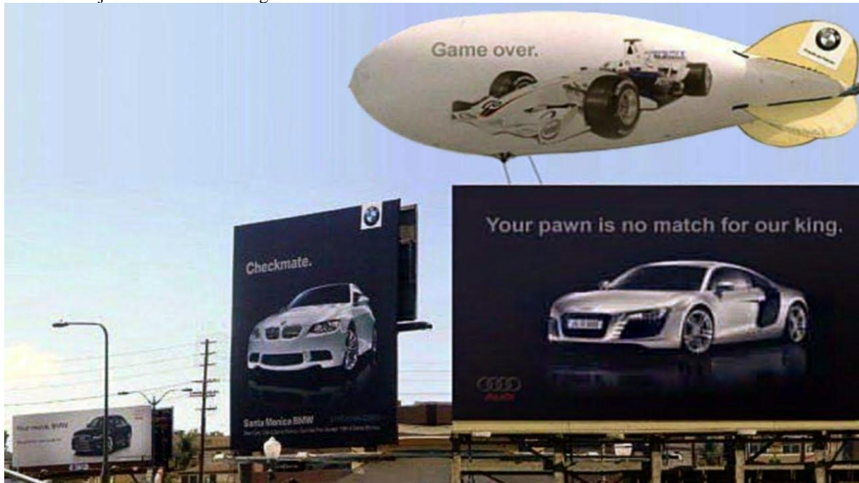
Slika 2 Primjer Ambush marketinga