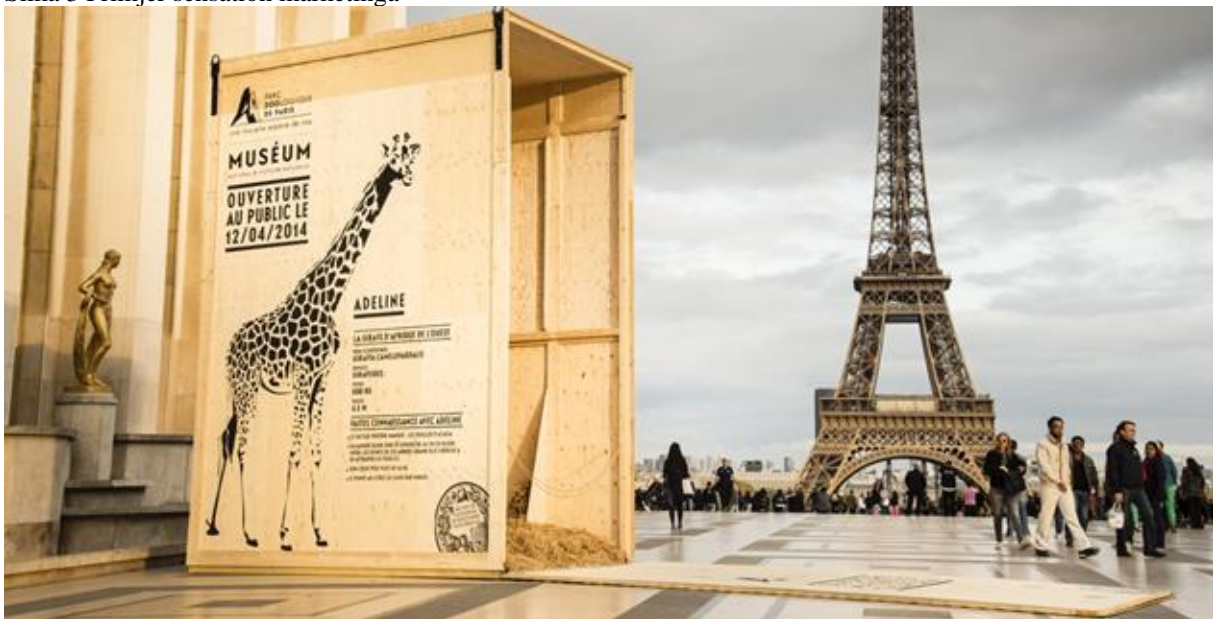
Slika 3 Primjer sensation marketinga