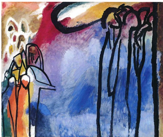
5. VASILIJ KANDINSKY: Improvizacija 19 , 1911. Munich, Städtische Galerie

3) Vasilij Kandinski, improvizacija 19, 1911.