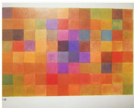
8) tablica- jesen