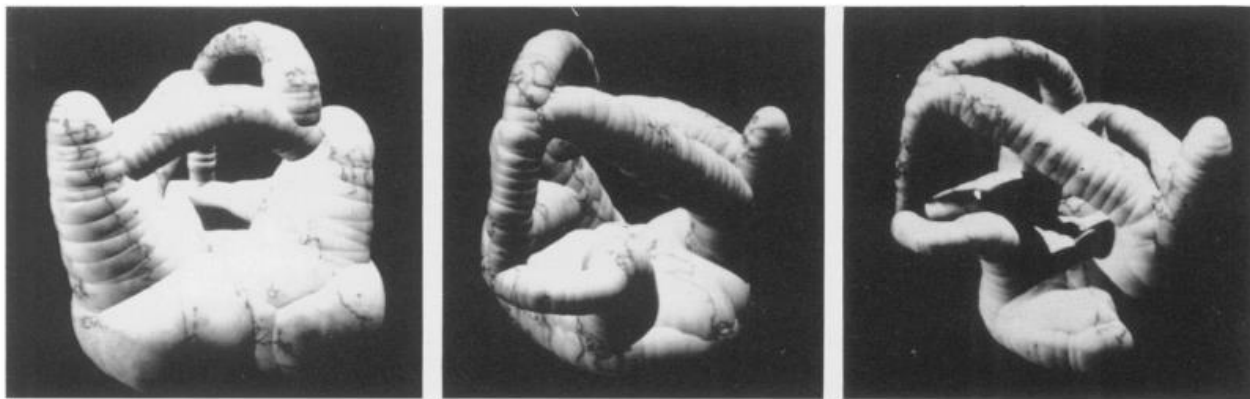
Slika 1. Mike King, Morph I, 1991. – računalna grafika u 3 projekcije uz dodavanje sjena u trećoj