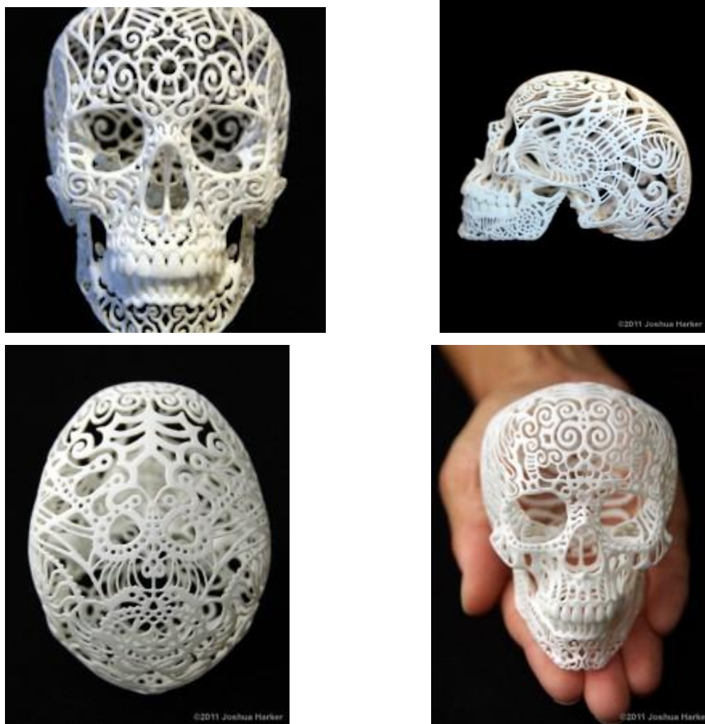
Slika 4. Joshua Harker, Crania Anatomica Filigre, 2011.

Joshua Harker je poznati američki umjetnik i smatra se pionikom i vizionarom u 3D tiskanoj umjetnosti i skulpturi. Njegova skulptura Crania Anatomica Filigre postigla je rekord za najfinanciraniji kiparski projekt skulpture. Rad se nalazi među gotovo 3000 zbirki koje uključuju djela istaknutih umjetnika kao što su Andy Warhol, Ron English i drugi.