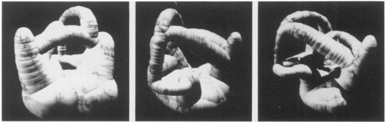
Slika 1. Mike King, Morph I, 1991. – računalna grafika u 3 projekcije uz dodavanje sjena u trećoj