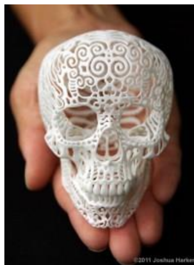
Slika 4. Joshua Harker, Crania Anatomica Filigre, 2011.