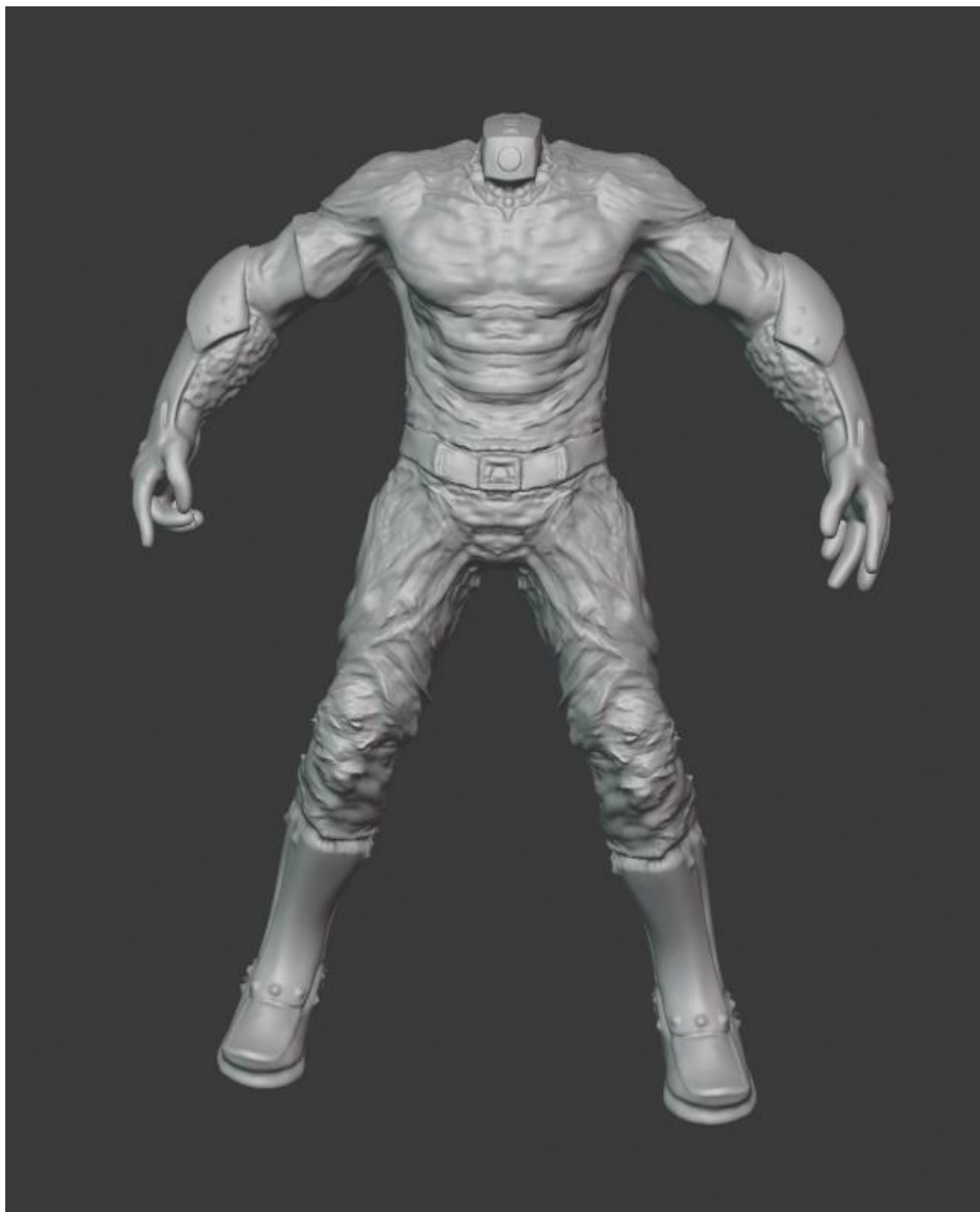
Slika 5. Suvremeni Golijat

„Suvremeni Golijat“ ima atletski savršenu maskulinu figuru koja simbolizira vlastiti privid jakosti. Po osnovnoj pozi i odjeći, dubokim zaštitnim čizmama, štitnicima za ruke on je naizgled nepobjediv. Nesrazmjer korpusa i glave koja je minimizirana i zamijenjena simboličnom kamerom sugerira njegovu sposobnost impresije ali ne i ekspresije jer govornih organa nema. K tome, minimalizam simbolične glave naglašava gubitak promišljanja vlastitom glavom i uklopljenost u teledirigirani kolektivizam.