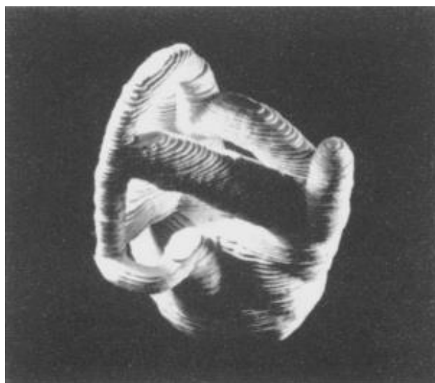
Slika 3. Mike King, Morph I, 1991 – fizički model, šperploča (drvo), 12x8x8 cm