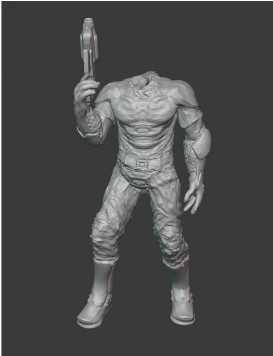
Slika 6. Suvremeni Golijat u pozi

„Suvremeni Golijat“ u pozi koja je prvenstveno obrambena u kontrastu je sa fizički snažnom figurom i pojačava dojam disproporcije glave i korpusa jer pokret nije napadački, čime autor naglašava skrivenu nesigurnost današnjeg čovjeka. On drži oružje u desnoj ruci ali ono je futurističko i ne služi napadu već obrani. Oružje je futurističko jer živi u neprestanom strahu od vanjske ugroze. A jedina prava opasnost je gubitak vlastite osobnosti i moralne i psihičke jakosti da zavlada svojim životom i aktivno se počne usmjeravati ka željenom cilju.