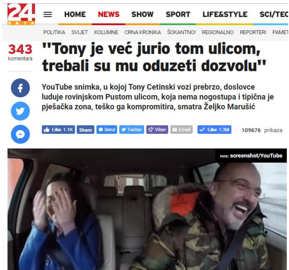
Slika br. 2 članak o prebrzoj vožnji za potrebe snimanja zabavne emisije Tonyja Cetinskog (24 sata.hr, 4.11.2017.)

Mnoge javne osobe smatraju da vrlo dobro barataju u odnosima s javnošću zbog svoje otvorenosti no upravo u kriznim situacijama zaboravljaju na tu otvorenost koja je ključni dio dobrog kriznog komuniciranja te se zatvaraju u sebe ili sa medijima komuniciraju malo ili uopće ne što izaziva izravne i veće posljedice na sliku i status javne osobe u medijima.