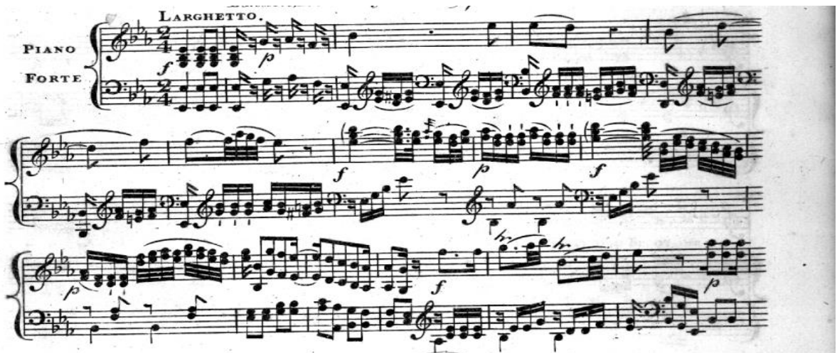
Primjer br. 15

Glazbu arije čini stroga, jednostavna okrestracija koja u sporom tempu pridonosi izraženoj patetici. Ne započinje recitativom, već kao početak drugog čina ima orkestralni uvod od sedamnaest taktova u tonalitetu Es – dura s glavnom melodijskom linijom u violinama koja će se poslije javiti u pjevačkoj dionici. Orkestracija se uglavnom svodi na glavne stupnjeve što je karakteristično za razdoblje klasicizma (primjer br. 15.).