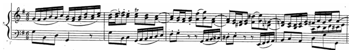
Primjer br. 2

Ich will dir mein herze schenken arija je iz prvog dijela pasije, a prethodi joj recitativ u četveročetvrtinskoj mjeri u tonalitetu e – mola koji kroz uklone modulira do C - dura. Neprekidan impuls dobiven triolama u dionici pratnje stvara svojevrsnu napetost u recitativu. Nadalje, ukloni naglašavaju kontrast osjećaja tuge i radosti zbog Isusove smrti i uskrsnuća. Iako je umro u mukama, njegova ostavština potvrđuje da živi zauvijek među ljudima. Ovo je dio pasije koji prikazuje posljednju večeru na kojoj je Isus ustanovio dva sakramenta po kojima je ostao trajno prisutan, a to su euharistija i sevećenički red. Upravo se u recitativu slavi Isusovo vječno prisutstvo. Arija započinje uvodom od 6 takova kadencom G – dura donoseći pritom motive koje će se pojaviti u glavnoj melodijskoj liniji tehnikom imitacije. Pravilnost, jednolikost i neprekidnost ritmičkog toka specifičan je za ovu ariju, također za gotovo sva Bachova djela te kao značajka stilskog razdoblja baroka. 2 U ariji je taj stalan ritmički pokret dobiven šesnaestinskim protokom (primjer br. 2). Pjevačka dionica i pratnja se međusobno nadovezuju što se očituje kroz stroge i slobodne imitacije glavne teme.