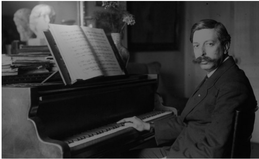
Slika br.1 Enrique Granados