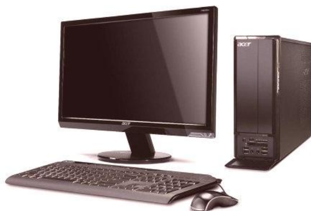
Slika 1. Prikaz stolnog računala i njegovih komponentata 1