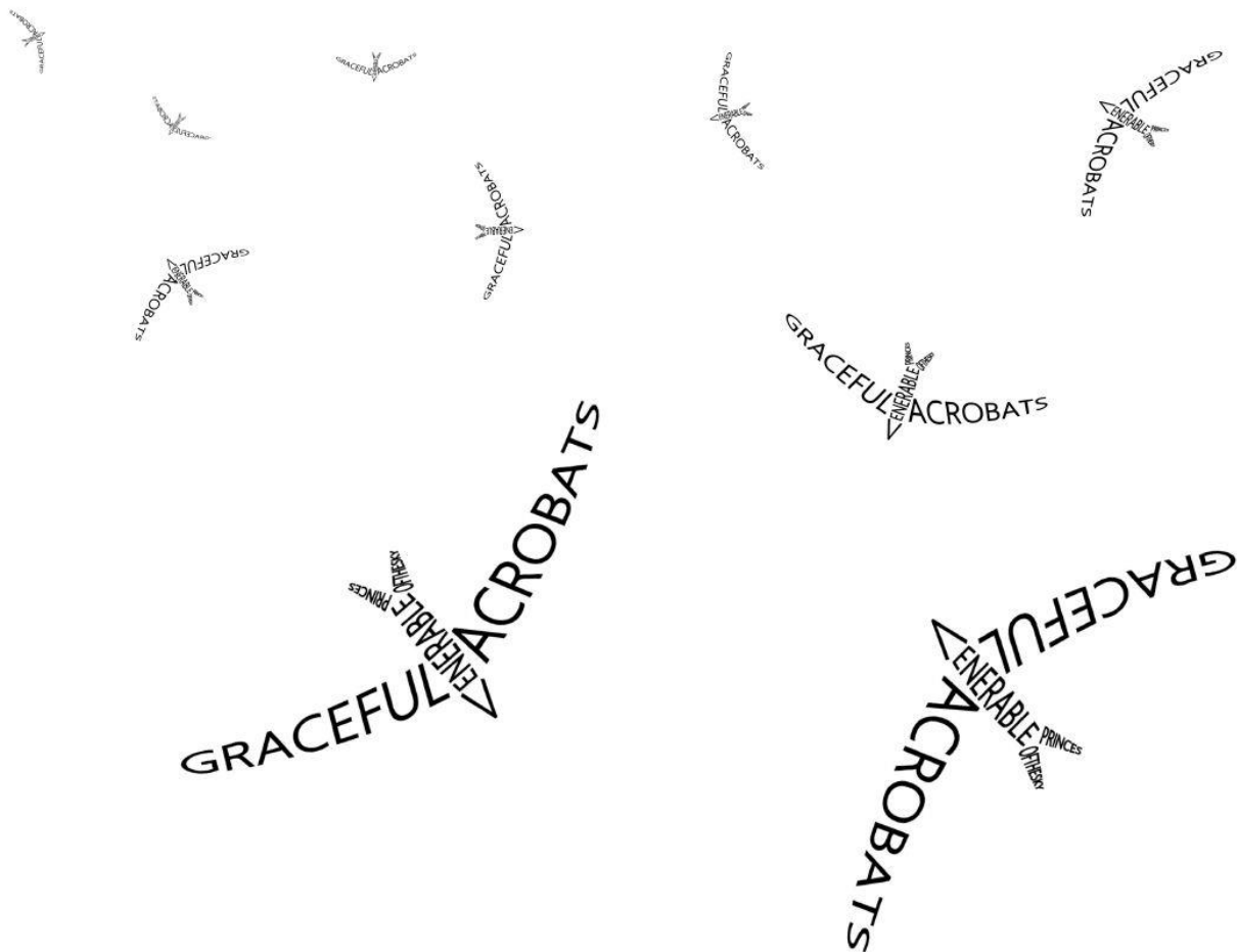
Slika 2: Frédéric Georges Martin: „Swift“ (izvor: https://wordsinthelight.com/visual-poetry/ )

„Slavonska šuma“ ne oskudijeva personifikacijama (Kozarac cijeloj šumi, i živim bićima koja u njoj žive, daje ljudske osobine: „grabovi i klenovi (...) misliš da vidiš zgrbljenog slugu kako povezuje i omotava gospodaru svome noge da ne ozebu; to su šumske prerije, robovi“ (Kozarac, 2017: 9-10), hrast je ohol, a brijest mrk, zlovoljan pesimist, također je prisutna i onomatopeja, ponajviše u opisivanju ptičjeg svijeta u šumi; pjev ptica pjevica, žubor i žamor, jastrebov „pij-u-u-uk“ (prema Kozarac, 2017: 11). Fasciniranost pticama dijeli i autor vizualne pjesme „Swift“, u kojoj pomiče granice značenja. Osim što konkretno oblikuje pticu grafičkim simbolima, pticu još proziva elegantnom letačicom, a lastavicu princezom neba. Iako Kozarac o pticama većinom piše u kontekstu lova, jasno je da ih smatra dobrodošlim, poželjnim stanarima šume.