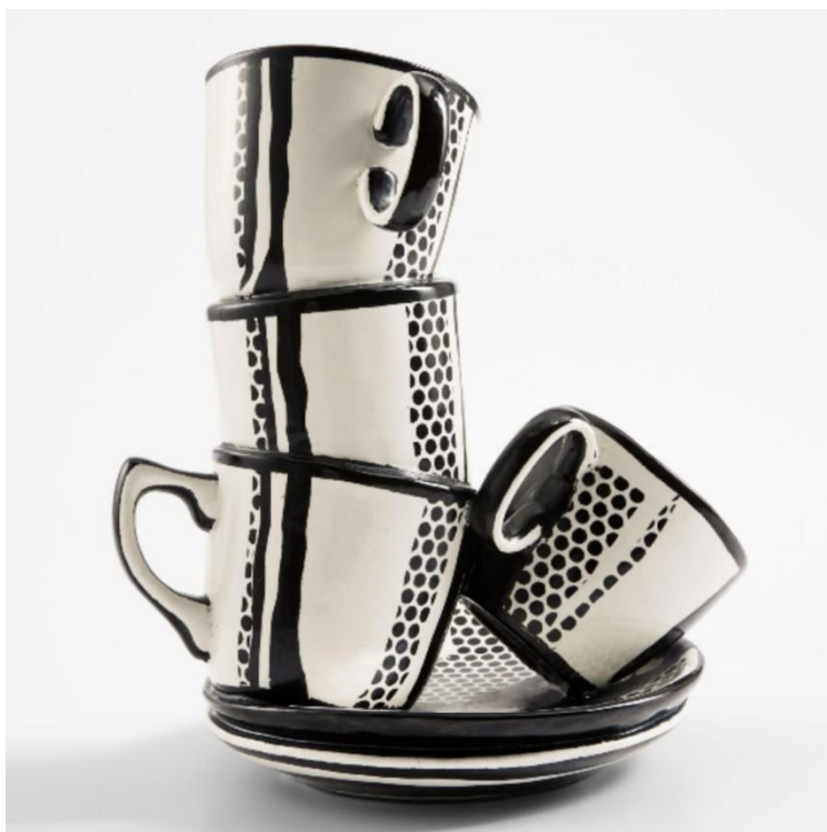
Roy Lichtenstein, keramičke šalice #7, bojana keramika, 1965.