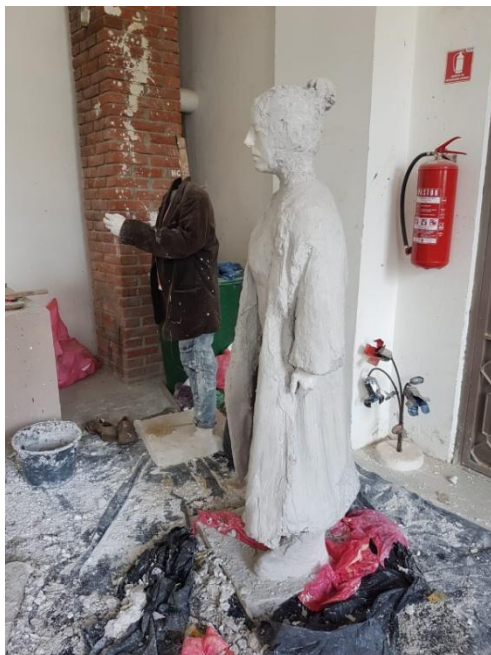
Slika 10. Druga faza izrade