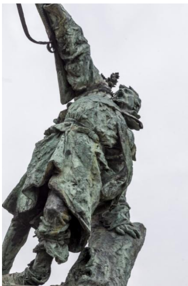
Slika 7. Robert Frangeš Mihanović, Umiruću vojnik , 1897., bronca

Još se jedan vrlo značajan domaći kipar koristi anatomskim izobličenjima radi dojma dramatičnosti i groteske, a to je suvremeni umjetnik Stjepan Gračan čije provokativne figure inspiriraju mlade hrvatske kipare.