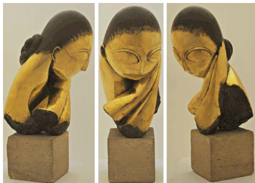
Slika 6. Constantin Brâncuși, Gospođa Pogany , 1919., bronca na kamenu

Kada se govori o domaćoj sceni, sakralne su teme zastupljene sve do druge polovice devetnaestog stoljeća, što znači da su prevladavale figure svetaca. Tek nakon pojave Antona Dominika Fernkorna i njegova rješenja za spomenik banu Jelačiću, figura blago prelazi iz sakralne u reprezentativnu modernu, uglavnom urbanističku skulpturu s duhom impresionizma, a kasnije simbolizma. Tako Robert Frangeš Mihanović 1912. godine izrađuje lik gole žene nad vrelom života kao simbol čežnje za mladosti i ljepotom koji i danas možemo vidjeti u Zagrebu na Rokovu perivoju. S potpuno drugačijim stilskim pristupom Frangeš modelira dinamičnu spomeničku figuru koja dohvaća dojam krajnje granice boli i napetosti. Monumentalni lik vojnika prikazan je u najdramatičnijem trenutku čime se odaje snažan dojam dinamičnosti, a tome također doprinosi dijagonalni položaj puške koja oštro prodire u prostor i dalje ostavlja dubok dojam osječkim prolaznicima.