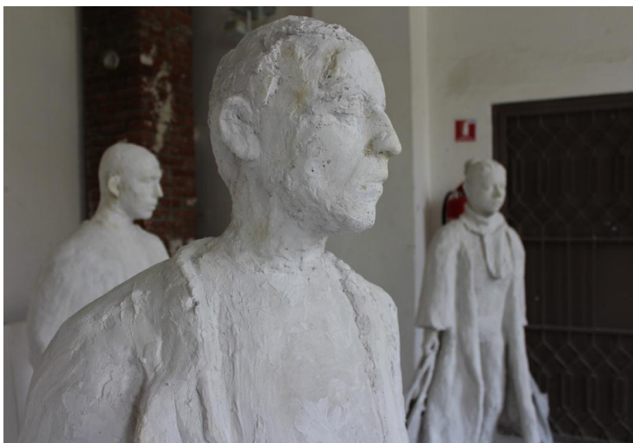
Slika 12. Detalj završenog rada

Kroz subjektivni doživljaj shvaćam kako mi se ovo vrijeme izrade završnog rada pretvara u iskustvo i zapitkujem se koliko će moji Čekači trajati?! To, naravno, ovisi o prostoru i utjecaju vremena na njih, ovisno o tome kada će se pojaviti njihov Godot.