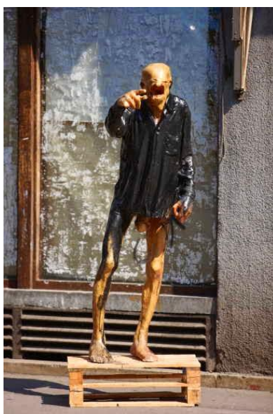
Slika 8. Stjepan Gračan, Bez naziva XL , 1981., poliester