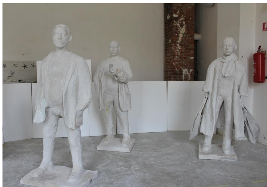
Slika11. Završna faza izrade