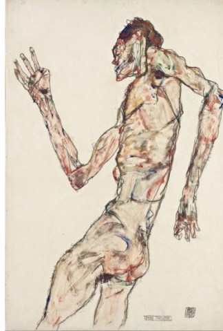
Slika 4. Egon Schiele, Plesač , 1913., masne boje, gvaš, vodene boje na papiru

Od druge polovice devetnaestog stoljeća, August Rodin svojim je figurama zatvorio tradiciju započetu još u doba helenizma. Svojim djelima daje obilježja moderne skulpture. Primjećuje se kako svoje figure oživljava titranjem svjetla i sjene, nemirnim plohamama i dojmom skicoznosti što nameće dojam uznemirenosti i dramatičnosti. Čini se kako inspirirani Rodinovom slobodom Aristide Malloil, Honoré Daumier, Théodore Géricault i André Derain čine nevjerojatan pomak od humanizma i impresionizma do krajnje stilizacije Constantina Brâncușija.