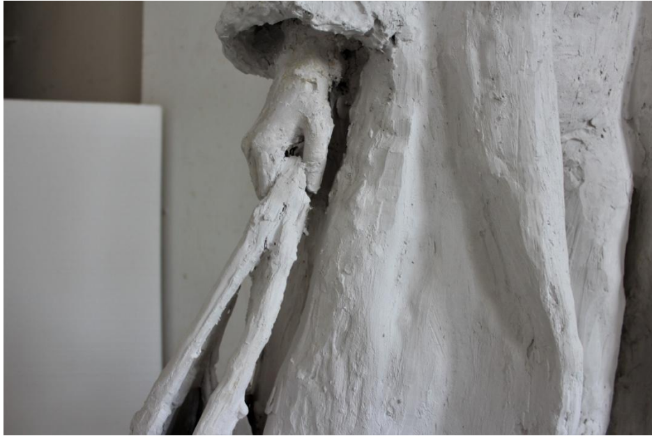
Slika 13. Detalj završenog rada