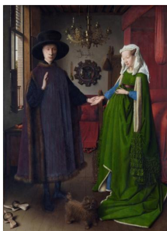
Slika 3. Jan van Eyck, Portret Arnolfinijevih , 1434., ulje na drvu

Uloga figure kao motiva u likovnoj se umjetnosti kroz povijest mijenjala. Tako je osim one prvobitne, postizanja što veće sličnosti sa stvarnom, figura imala različite uloge. U vrijeme Egipta sarkofazi koji su pratili formu tijela imali su ulogu utjelovljenja moći. U antici je čovjek bio mjerilo svega, a ljudska je figura morala prikazivati savršenstvo. Od renesanse su bili popularni prikazi onih reprezentativnih figura u doba vladara kao i prikazi svetaca (Velazquez, Van Eyck). Od osamnaestog stoljeća modernijim promišljanjem figura dobiva novi smisao kao što je uloga buđenja svijesti (Delacroix, Manet). Malo po malo, figura kao motiv je postala sredstvo umjetnikova izražavanja i potrage za nečim novim (Cezane, Schiele, Picasso). Uloga figure daleko je odmakla od Platonova mimesisa. Novo značenje figure uključuje da sama figura kao motiv ne mora imati značenje, da je samo sredstvo izražavanja za postizanje zamišljene umjetnikove ideje. Neke su od tih ideja bile one ekspresionističke; traženje onog izvornog, spontanog, prvotnog u čovjeku i svijetu. Ono što je prije bila uloga figure u djelu, sada jest figura umjetnika odnosno sam umjetnik. To znači oslobođenje onog sloja čovjekova postojanja koji je bio potisnut, neostvaren i neoblikovan sloj, ono što predstavlja iracionalno, tajanstveno, u biti zastrašujuće, zlo i ružno.