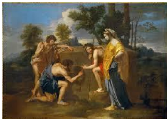
Slika 2. Nicolas Poussin, I ja bijah u Arkadiji , 1638., ulje na platnu