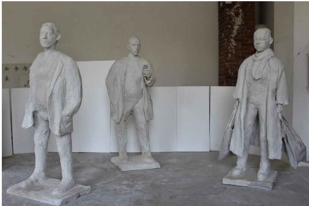
Slika 14. Završen rad