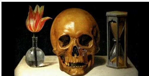
Slika 1. Philippe de Champaigne, Vanitas s lubanjom , 1671., ulje na drvu