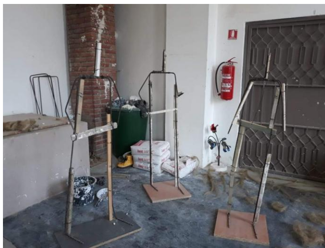
Slika 9. Prva faza izrade

Finalni oblik figura odgovara konceptu rada. Tako je izrađen ženski lik s vrećicama u rukama, muški lik blago zakrenute glave s rukama u džepovima te posljednji, drugi muški lik kojem je pogled nagnut prema mobitelu koji drži.