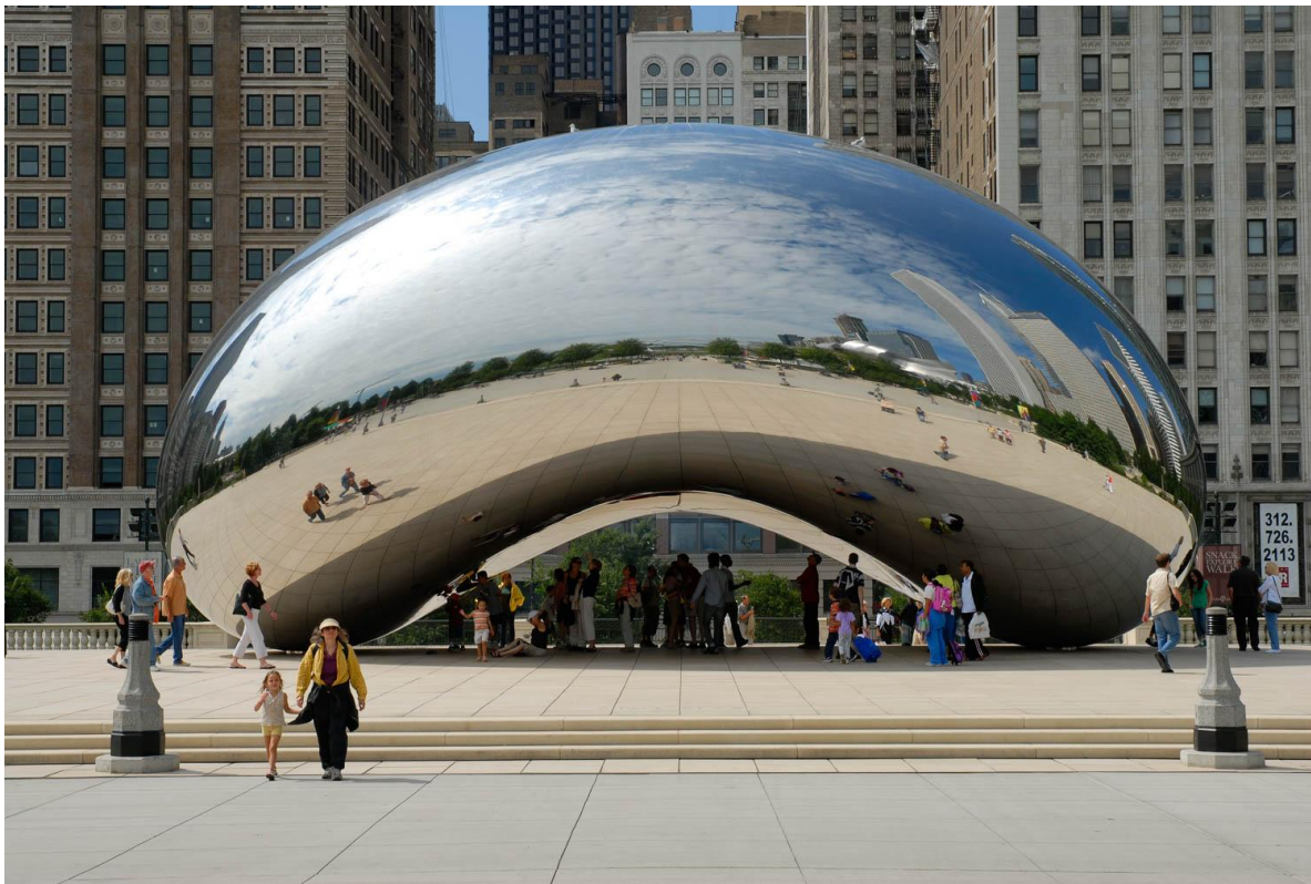
Slika 5. Anish Kapoor, Cloud Gate , 2004., instalacija, AT&T Plaza, Chicago

Tako britanski kipar Anish Kapoor upotrebljava apstraktne biomorfne oblike s velikim obraćanjem pažnje na lokaciju i arhitekturu što ga je dovelo do monumentalnih razmjera u skulpturama. Monumentalni rad Cloud Gate iz 2004. godine eliptični je luk visoko poliranog nehrđajućeg čelika pod nadimkom The Bean (Grah) .