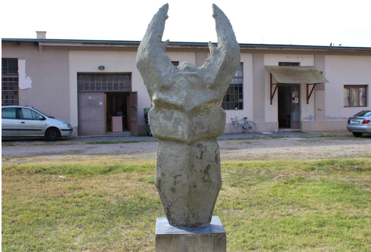
Slika 12. Završena skulptura postavljena na postament