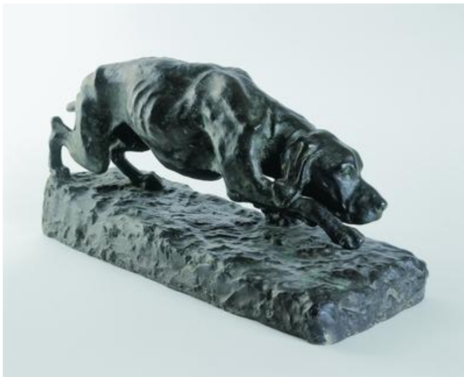
Slika 2. Branislav Dešković, Pas na tragu , 1910.

Branislav Dešković najpoznatiji je animalist u hrvatskoj umjetnosti. U svojim realističnim, impresionističkim skulpturama ponajviše prikazuje lovačke pse i konje kojima prikazuje trenutačni stav životinje poput navedenog primjera.