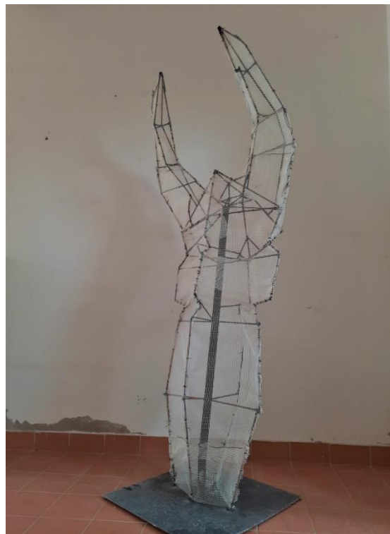
Slika 10. Druga faza izrade

Konačni oblik skulpture napravljen je u umjetnom kamenu (flexstone). Prethodno napravljena konstrukcija u željenom vertikalnom položaju olakšava nanošenje finalnog materijala, umjetnog kamena, budući da je napravljena prateći formu skulpture. Završena je skulpturu postavljena na kameni postament ispred zgrade kiparstva u dvorištu Sveučilišnog kampusa. Sam odabir materijala unaprijed je promišljen jer umjetni kamen bolje podnosi vanjske utjecaje vremena i dugovječniji je od drveta, gipsa i sličnih materijala i kao takav odgovara konceptu samoga djela.