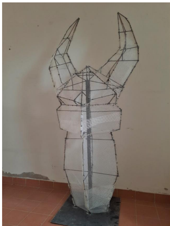
Slika 9. Druga faza izrade

U drugoj fazi izrade učvršćena je armirna mrežica za pročelja na konstrukciju pomoću paljene žice. Preko postavljene armirne mrežice za pročelja pričvršćena je pocinčana mreža koja će s armirnom mrežicom za pročelja tako pričvršćena na konstrukciju prateći formu iste biti konačni nosivi dio skulpture.