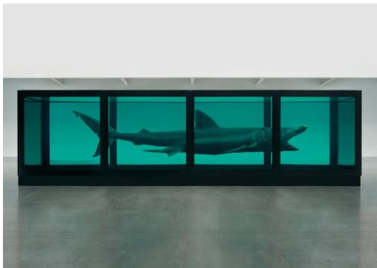
Slika 3. Damien Hirst, Fizička nemogućnost smrti u umu nekoga živog , 1992.

Na primjer, suvremeni umjetnik Damien Hirst u svojim radovima upotrebljava uginule životinje. Ima cijelu seriju radova u kojima su mrtve životinje smještene u formalinsku otopinu unutar velikih metalno-staklenih konstrukcija. U njegovu najpoznatijem radu Fizička nemogućnost smrti u umu nekog živog stavlja uginulog morskog psa u akvarij. Ovaj se rad, koji u sebi ima uginulu životinju, danas smatra jednim od najutjecajnijih radova suvremene umjetnosti. Za Hirstove ready-made mrtve prirode postavlja se pitanje gdje se nalazi granica morala. Umjetnik se inače bavi temom smrti te ljudskim shvaćanjem ili neshvaćanjem te pojave, kao i vlastitim poimanjem i prihvaćanjem smrti.