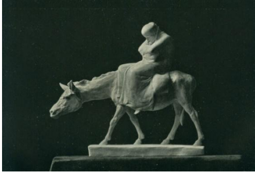
Slika 1. Robert Frangeš-Mihanović Bijeg u Egipat 1905.-1907. lijevanje, bronca 440 x 490 x 150 mm. MMSU-1670.

Branislav Dešković najpoznatiji je animalist u hrvatskoj umjetnosti. U svojim realističnim, impresionističkim skulpturama ponajviše prikazuje lovačke pse i konje kojima prikazuje trenutačni stav životinje poput navedenog primjera.