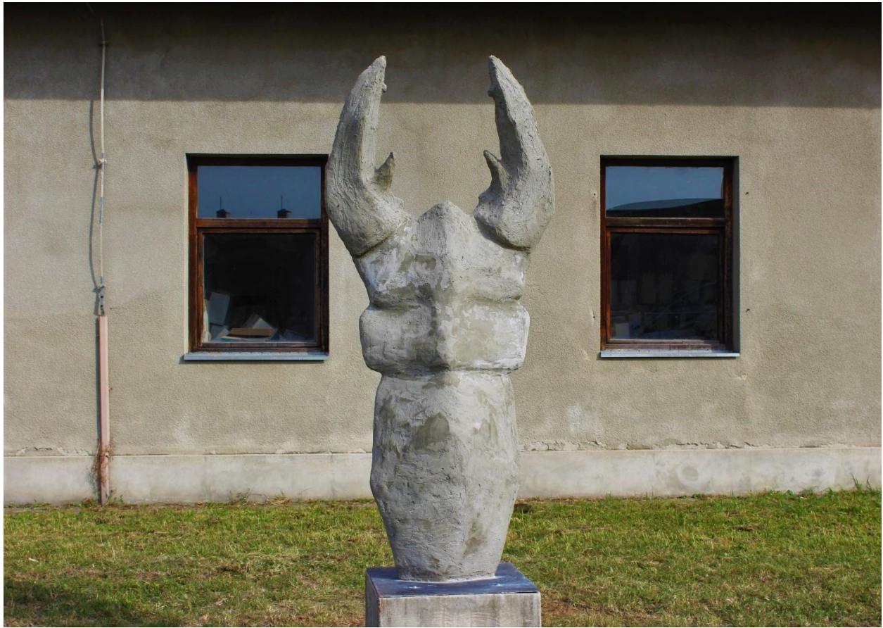
Slika 11. Završena skulptura postavljena na postament