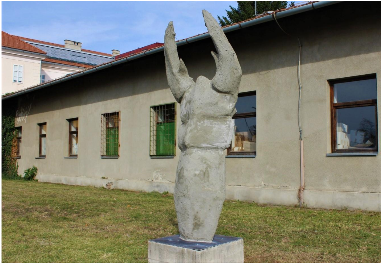
Slika 13. Završena skulptura postavljena na postament