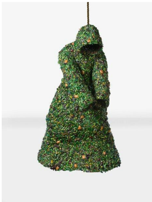
Slika 4. Jan Fabre (né en 1958), Beekeeper II , 1998.-1999.

Rad Beekeeper u obliku školjke sastavljen je od sjećanja koja su starija od ljudskog tijela, kukaca iz roda Buprestidae koji simboliziraju naš put do smrti. Svakodnevni predmeti (križ, haljina, pisoar...) sastavljeni od kukaca upućuju na umjetnost i načine života ovog stoljeća. U knjizi Jana Fabrea Book of Insects pojavljuje se pauk sastavljen od malenih paukova. Ta nas kompozicija podsjeća na Arcimboldova djela u kojima se dijelovi sastavljenog predmeta odražavaju u cjelini.