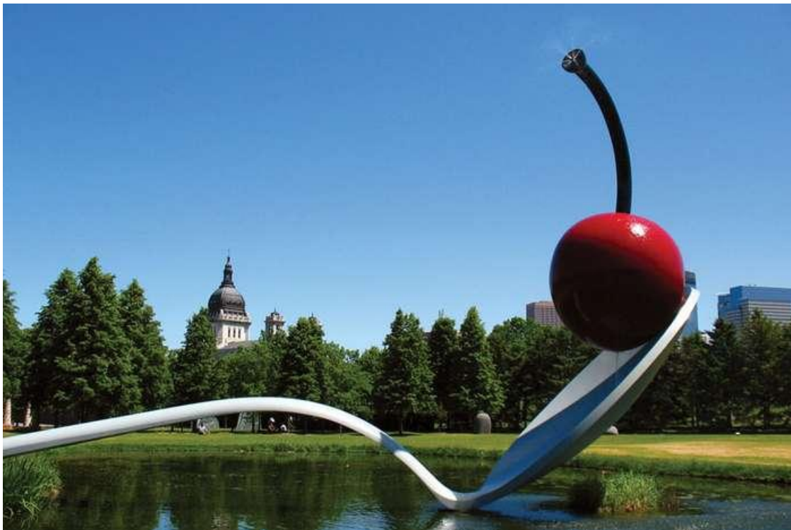
Slika 6. Claes Oldenburg i Coosje van Bruggen, Spoonbridge and Cherry , 1985. - 1988; Vrt skulptura Walker Art Centra u Minneapolis, Minneapolis, Minnesota

Kada govorimo o monumentalnosti neizostavan je američki pop-art kipar Claes Oldenburg najpoznatiji po svojim divovskim skulpturama svakodnevnih predmeta. Godine 1962. izložio je inačicu svoje trgovine u kojoj se nalaze goleme skulpture (kornet za sladoled, hamburger i kriška torte). Rad Spoonbridge and Cherry (1985. – 1988.) predstavio je kao predimenzioniranu skulpturu predmeta iz svakodnevne upotrebe specijalno za retrospektivu njegova rada 1995. godine u Guggenheim muzeju u New Yorku.