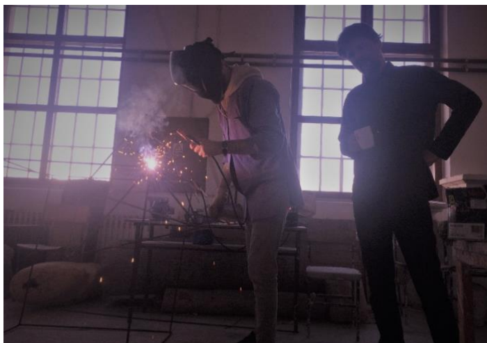
Slika 16. Mentor i ja prilikom izrade završnog rada