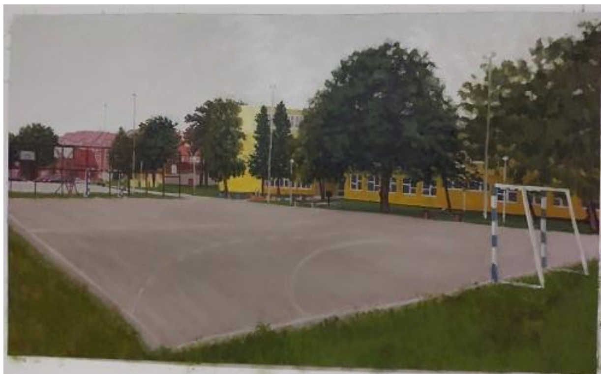
Slika 12. "Školsko igralište", 135x225