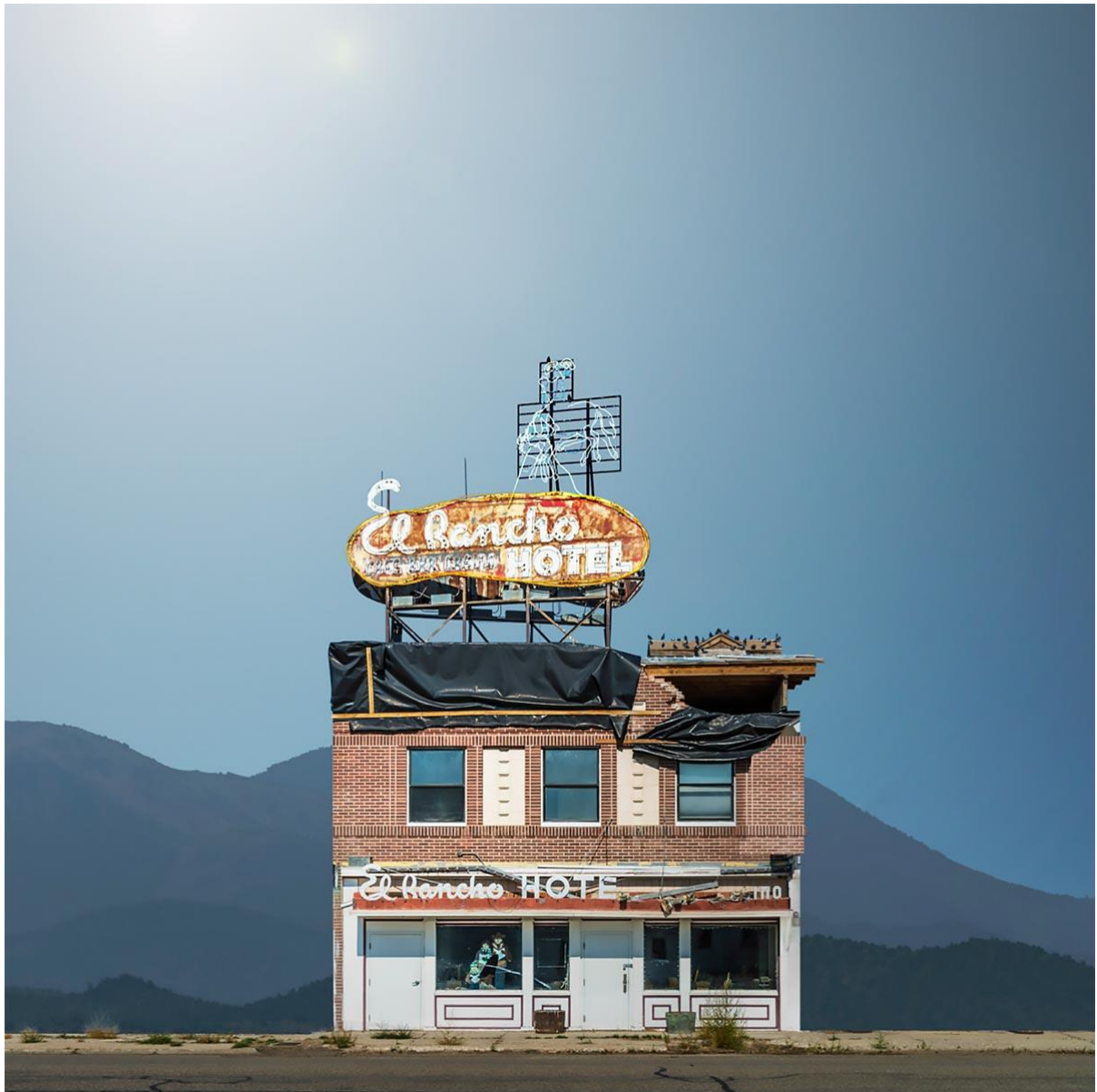
Slika 2. Ed Freeman, fotografija iz serije „Western Realty“ 2/3