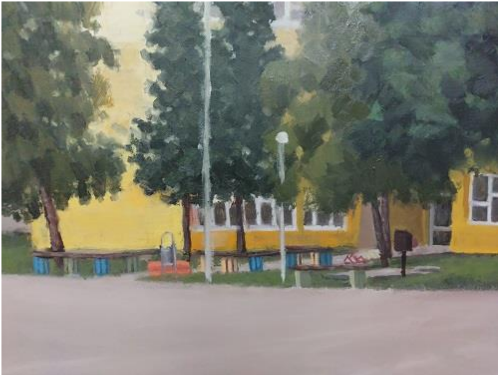
Slika 14. Detalj rada “Školsko igralište” 2/3