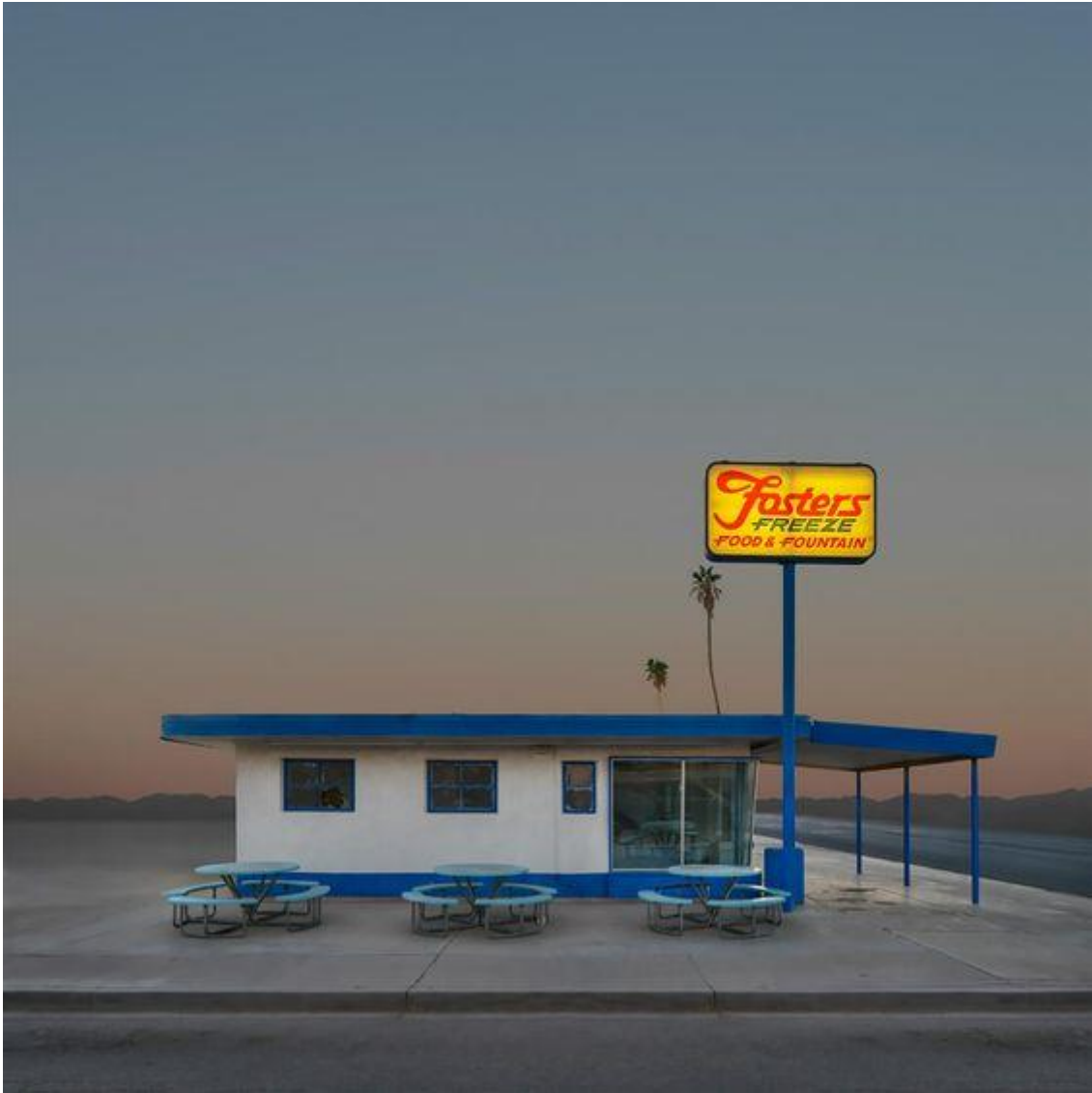
Slika 1. Ed Freeman, fotografija iz serije „Western Realty“ 1/3