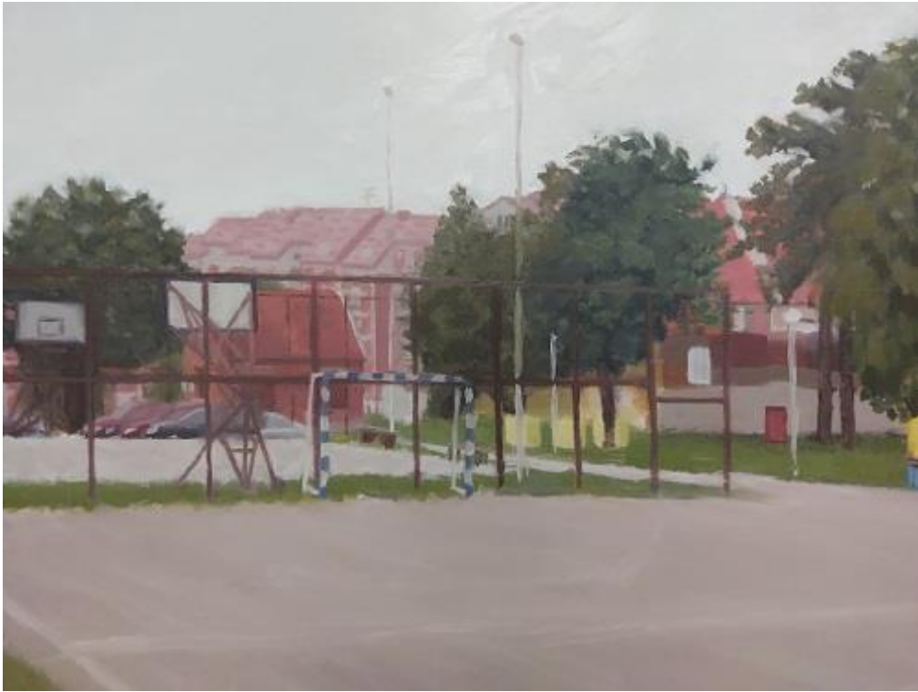
Slika 13. Detalj rada “Školsko igralište” 1/3