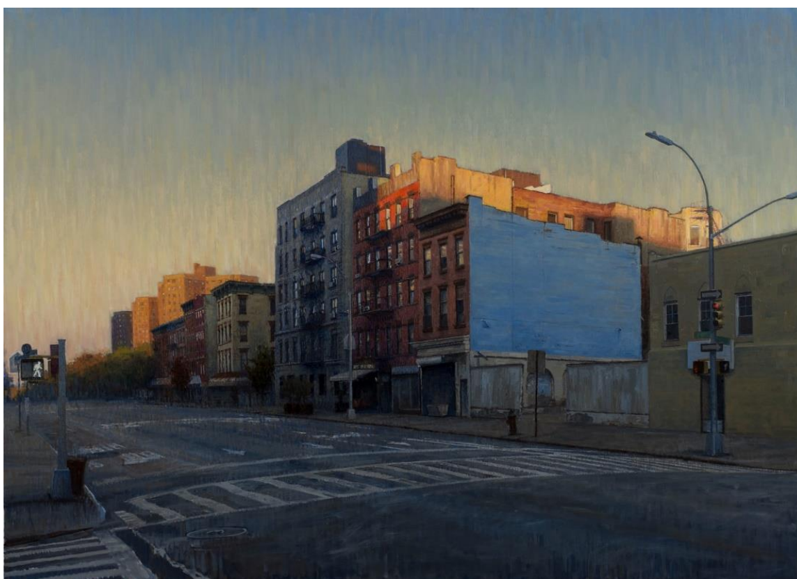
Slika 6. Bennett Vadnais, Second Ave., akril, 32"X 40"

Bennett je slikar rođen u Washingtonu, učen je klasičnim metodama slikarstva. Proviđi vrijeme u okolini u kojoj radi studije crteža i slika. Radi primarno akrilom i vodenim bojama. Dok se bavi brojnim temama glavne su mu preokupacije krajolici i vedute po kojima se dokazao kao majstor. U većini slučajeva Njegovi potezi kista su iznimno kontrolirani, čisti i jasni, a bojama teži ka vjernosti prema predlošku. Lokacije koje dočarava su jasne i vjerne stvarnosti, ali su prazne, kontekst njegovih radova je neizrečen. Kod njega me se jako dojmilo ozračje koje ostavlja iza svojih djela, baš onakvo kakvo sam pokušavao kreirati.