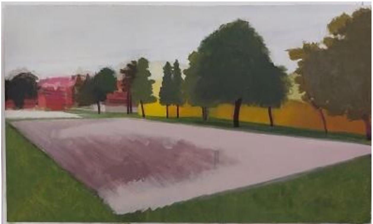
Slika 9. Proces izrade rada 2/3