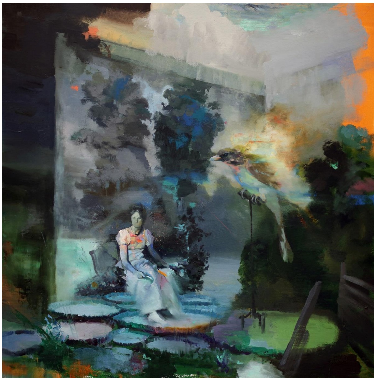
Slika 4. Joshua Flint, „The messenger“, ulje na drvenoj ploči, 24x24 inča