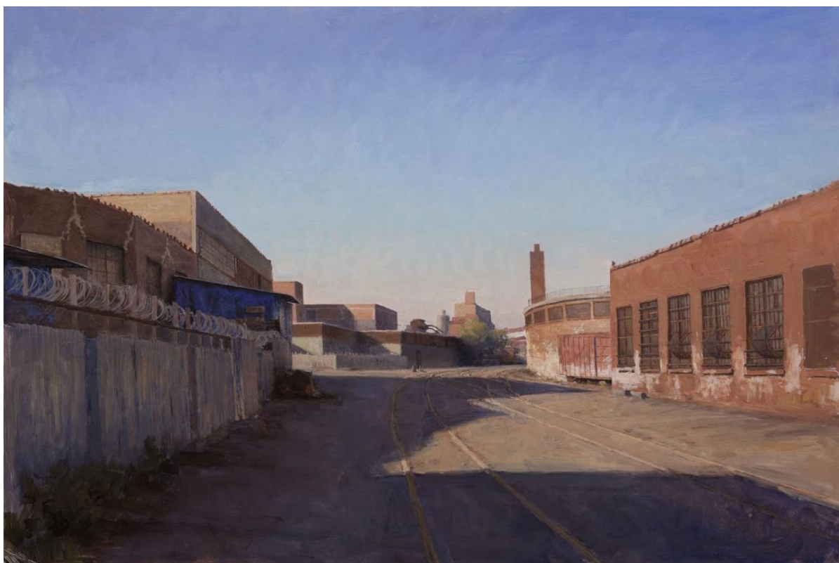
Slika 7. Bennett Vadnais, Morgan Ave., akril, 15“x30“