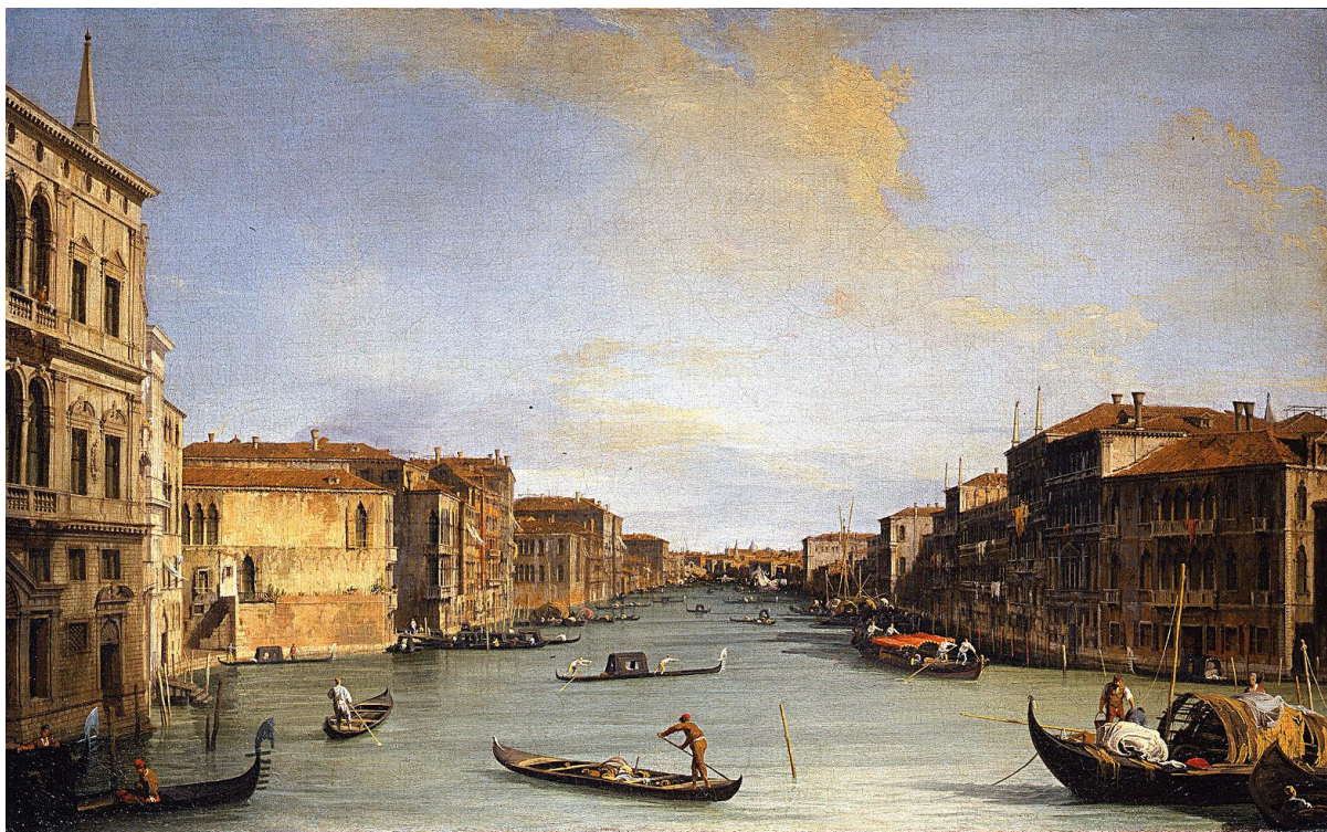
Slika 5. Canaletto, Veduta del Canal Grande, ulje na platnu, galerija Uffizi, Firenca

Vedute su grafike, crteži ili slike koje vjerno prikazuju grad, selo ili naselje. Potječe od talijanske riječi „vedute“ što znači pogled. Prve vedute su najvjerojatnije djela nekog sjevernoeuropskog umjetnika koji je djelovao u Italiji, primjerice Paul Brill (1554.-1626.), flamanski slikar krajolika koji je proizveo puno marinskih djela i prikaza Rima. Među najpoznatijim slikarima veduta su četiri majstora iz Venecije: Canaletto (1697.-1768.), Giacomo (1678.-1716.), Giannantonio (1699.-1760.) i Francesco (1712.-1793.). Proizveli su puno radova koji prikazuju Veneciju. Canalettu je glavni cilj bio predstaviti točan i detaljan opis određenog prizora. Genijalno je prikazao vedrinu, živost i arhitekturu Venecije tog vremena, čime je zaslužio reputaciju jednog od najvećih topografskih slikara svih vremena. Primarna topografska funkcija veduta je postala beskorisna nakon izuma fotoaparata tako da je njihova današnja primarna svrha likovno izražavanje.