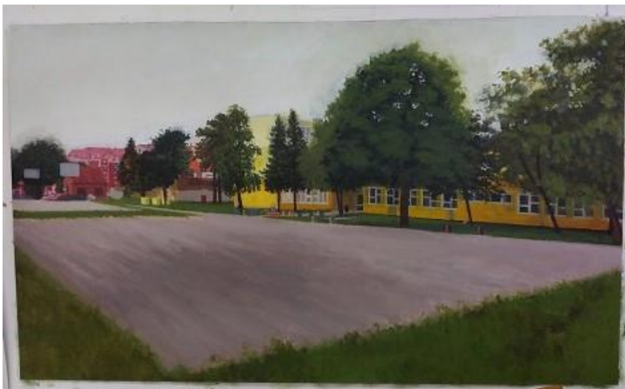
Slika 10. Proces izrade rada 3/3