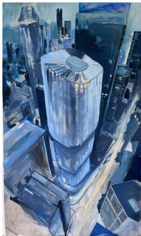
Slika 6. „proces izrade završnog rada 2/8“