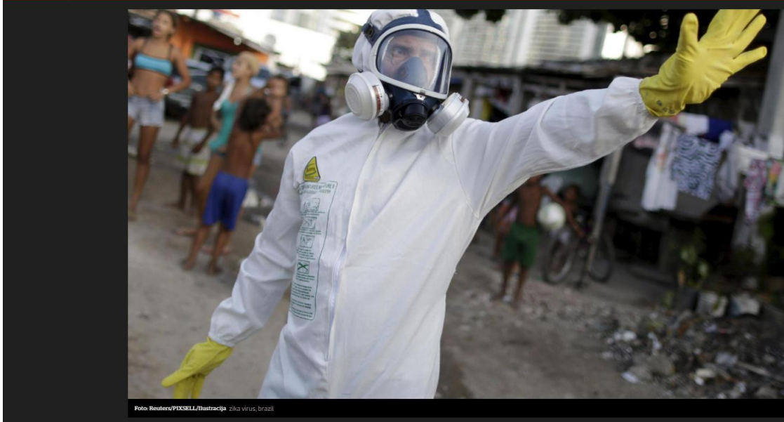
Ilustracija Zika virus, Brazil