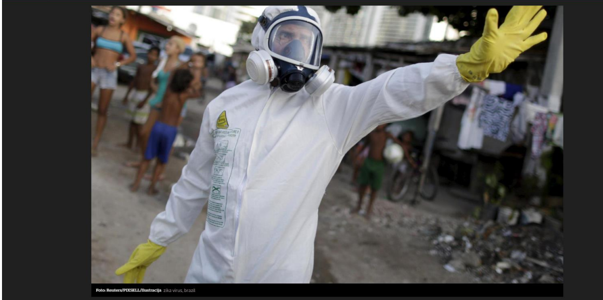
Zika virus, Brazil