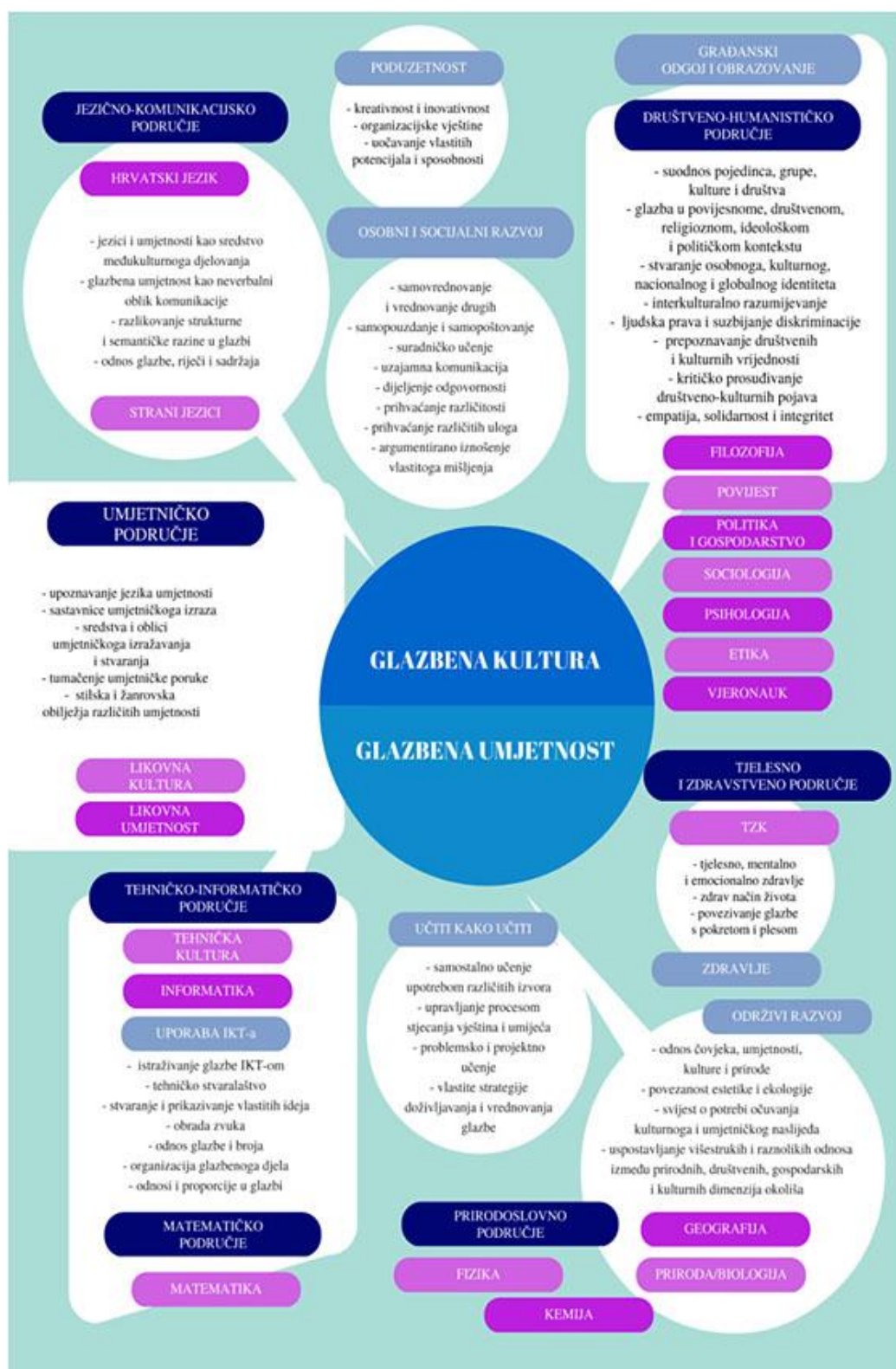
Slika 2. Povezanost GK/GU s drugim predmetima i međupredmetnim temama (MZO, 2019)