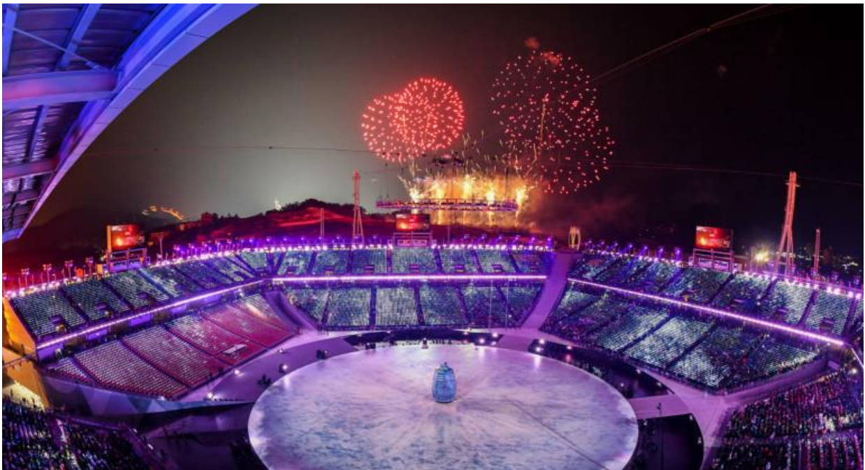
Slika 1. Olimpijske igre- prikaz spektakla i njegovih karakteristika

Medijski sadržaj je predstavljen kao šou te fantazija i svim gledateljima se nudi sadržaj individualno. Natjecateljski dio spektakla ne postoji jer je medijski prostor zauzeo megaspektakl- to jest ključni događaj svoga doba.