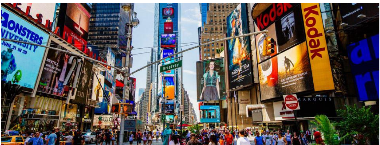
Slika 3. New York (Time Square ) – prikaz nezaobilaznosti reklama pop kulture

“Pod utjecajem kulture multimedijske slike, zavodljivi spektakli fasciniraju pripadnike medijskog i potrošačkog društva, uvlače ih u semiotiku novog svijeta zabave, informacije i potrošnje, koja uvelike utječe na mišljenje i djelovanje” (Kellner, 2008:172). U popularnoj se kulturi medijski stvaraju ikone i idoli koji imaju utjecaj na trendove i potrošače, a kasnije i na njihove odluke i akcije. Spektakl stvara lažne idole i iluzije, a zabava se provlači kroz sva područja ljudske djelatnosti. Njegovo blještavilo daje mu mogućnost da se iskaže i da sve više postane ekstravagantnijim što mu popularna kultura i mainstream mediji omogućavaju.