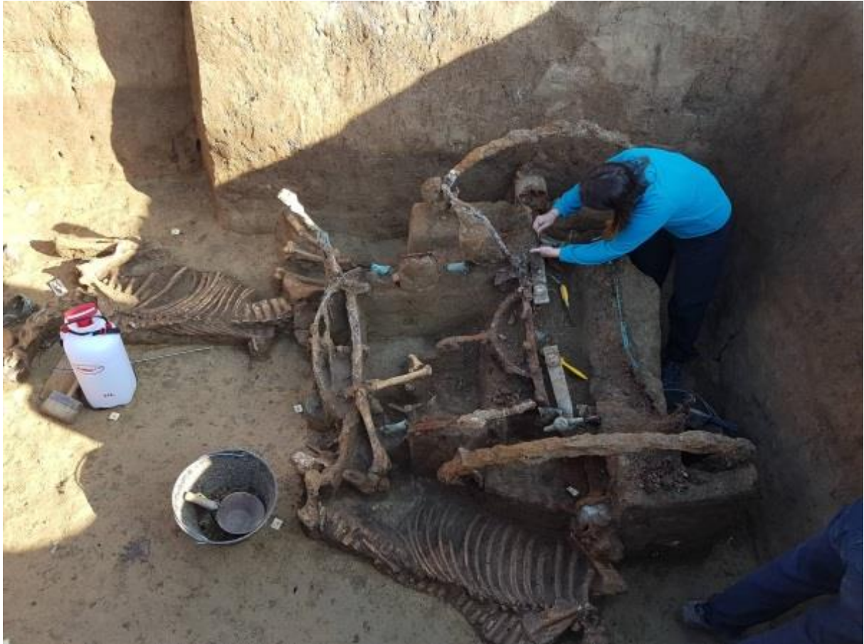
Slika 6. Pronađeni ostaci rimske dvokolice i konja