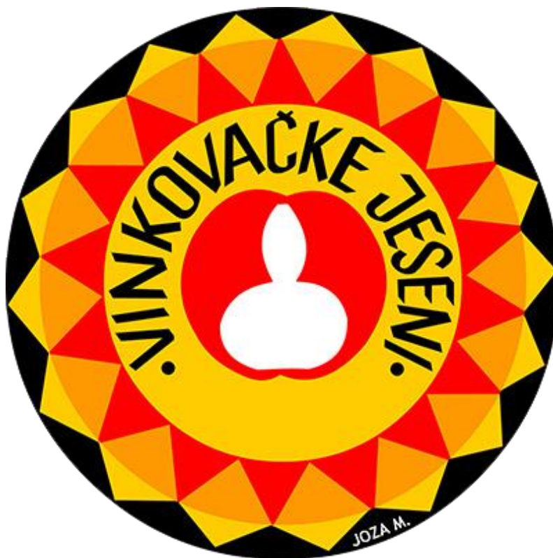
Slika 7. Grb Vinkovačkih jeseni