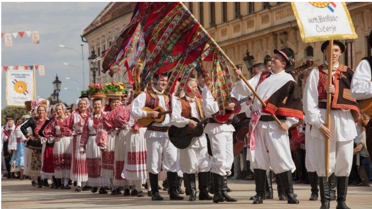
Slika 8. Svečana povorka Vinkovačkih jeseni

Svečani mimohod folklornih skupina, domaćih sudionika i gostiju Smotre izvornoga hrvatskoga folklor privlači pažnju posjetitelja, ali i svih stanovnika Vinkovaca. Tradicionalno se mimohod formira na gradskoj tržnici i ide Zvonimirovom ulicom, Pješaćkom zonom, Trgom bana Šokčevića, Dugom ulicom, Trgom Franje Tuđmana, Genscherovom do stadiona nogometnog kluba Cibalia, te u njemu sudjeluje oko devedeset folklornih skupina iz Hrvatske i okolice, svečane konjske zaprege, konjanici, kandžijaši, kuburaši, mažoretkinje, limena glazba i još mnogi. Dolaskom na stadion se pravi veliko šokačko kolo na atletskoj stazi stadiona i mnogo manjih kola unutar njega. Nakon završetka mimohoda sudionici i posjetitelji mogu zajedno zaplesati Šokačko kolo i Kukurješće.