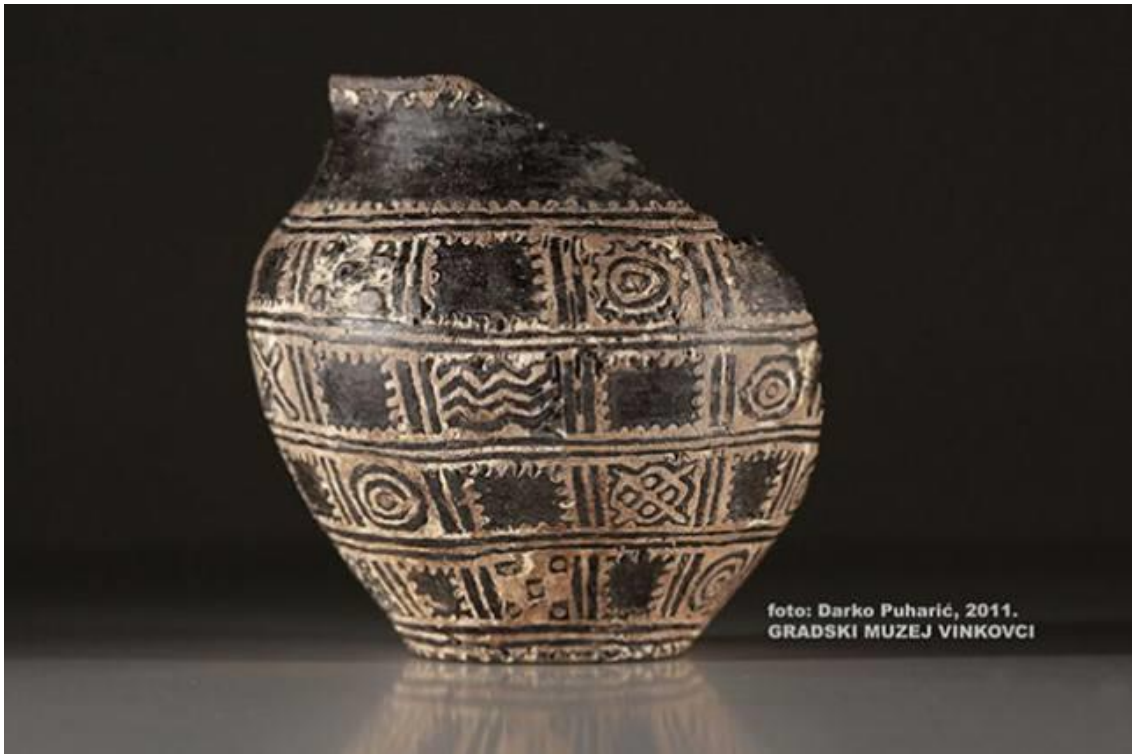
Slika 4. Posuda Orion – najstariji indoeuropski kalendar