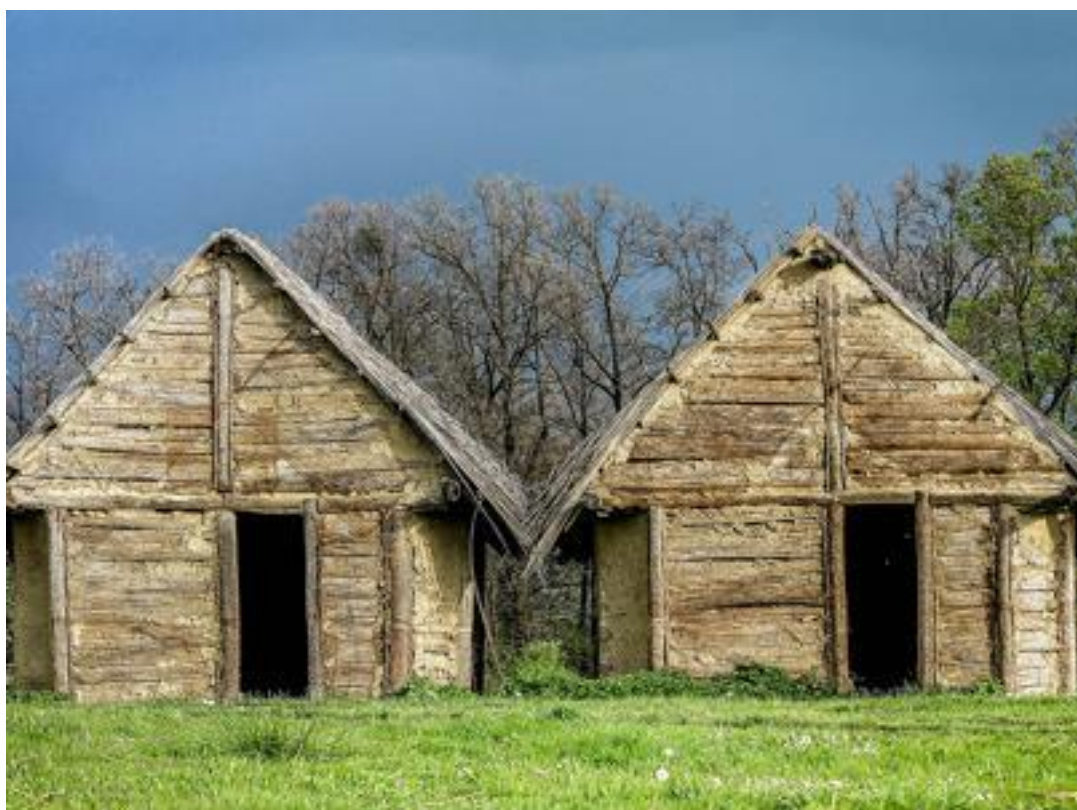
Slika 1. Kuće na Sopotu

Kelte te osvojili ovo područje. U široj zoni grada otkriveno je nekoliko arheoloških nalazišta koja svjedoče o kontinuitetu naseljenosti ovoga područja kroz više od osam tisućljeća. „Gradski muzej Vinkovci od 1996. godine sustavno istražuje lokalitet te je utvrđeno najmanje pet stambenih horizonata u četiri razvojne faze.“ (Potrebica i Dizdar, 2002:79.)