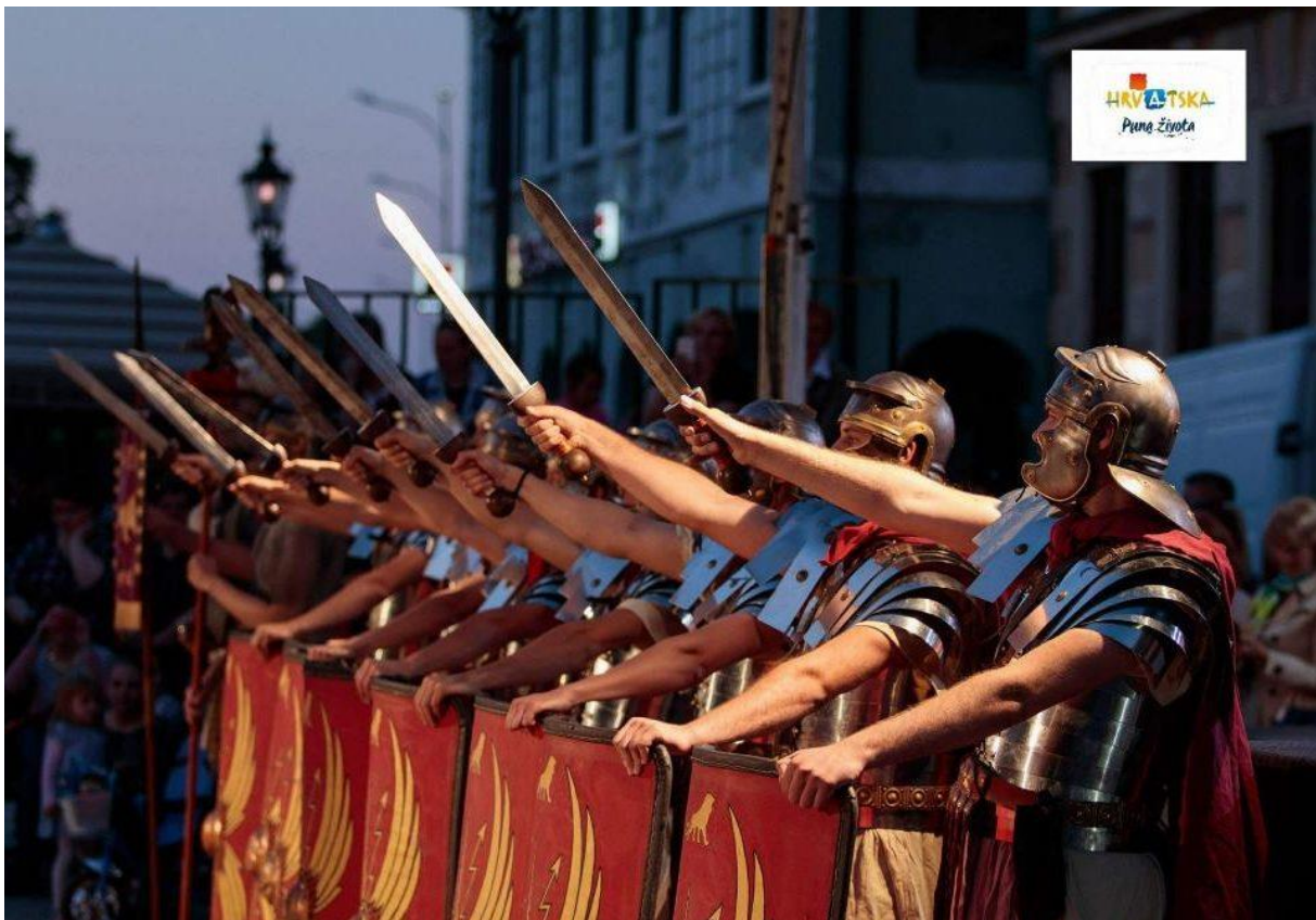
Slika 9. Rimski dani u Vinkovcima; izvor: nacional.hr ; prema: Ivan Ivanuš