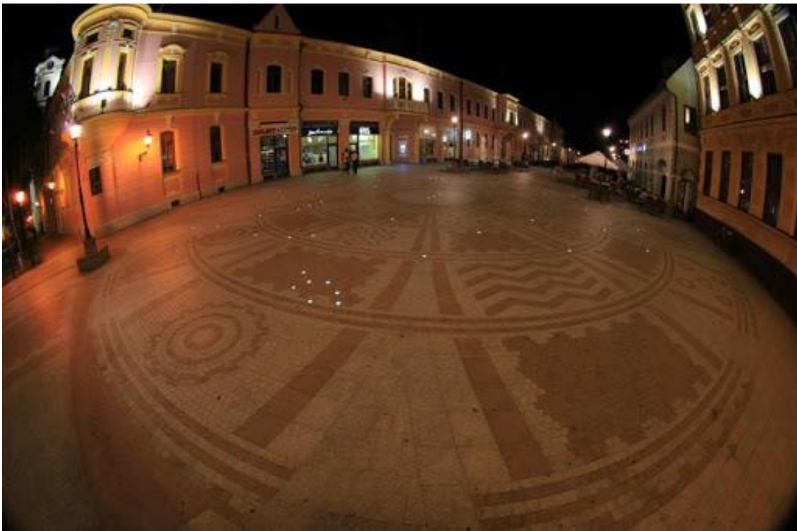
Slika 5. Vinkovački korzo ukrašen detaljima Orionu