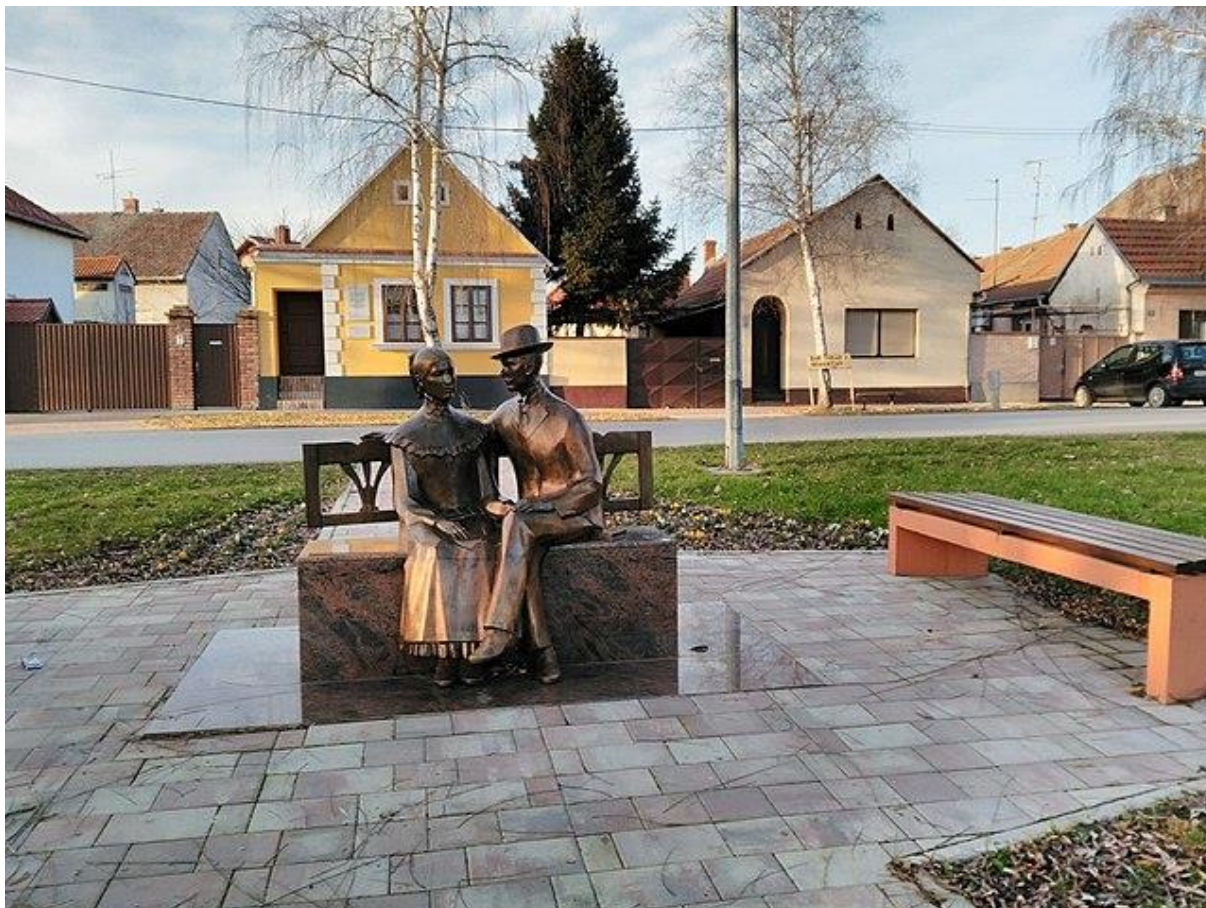
Slika 3. Rodna kuća Josipa i Ivana Kozarca