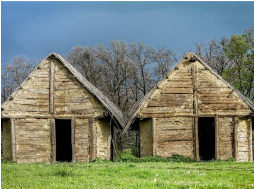
Slika 1. Kuće na Sopotu ; izvor: turistička zajednica vukovarsko-srijemske županije

Kelte te osvojili ovo područje. U široj zoni grada otkriveno je nekoliko arheoloških nalazišta koja svjedoče o kontinuitetu naseljenosti ovoga područja kroz više od osam tisućljeća. „Gradski muzej Vinkovci od 1996. godine sustavno istražuje lokalitet te je utvrđeno najmanje pet stambenih horizonata u četiri razvojne faze.“ (Potrebica i Dizdar, 2002:79.)