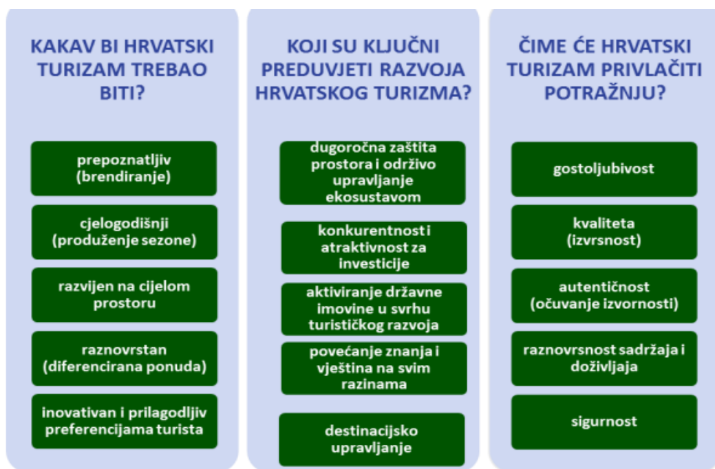
Slika 1. Sustav vrijednosti nove vizije hrvatskog turizma