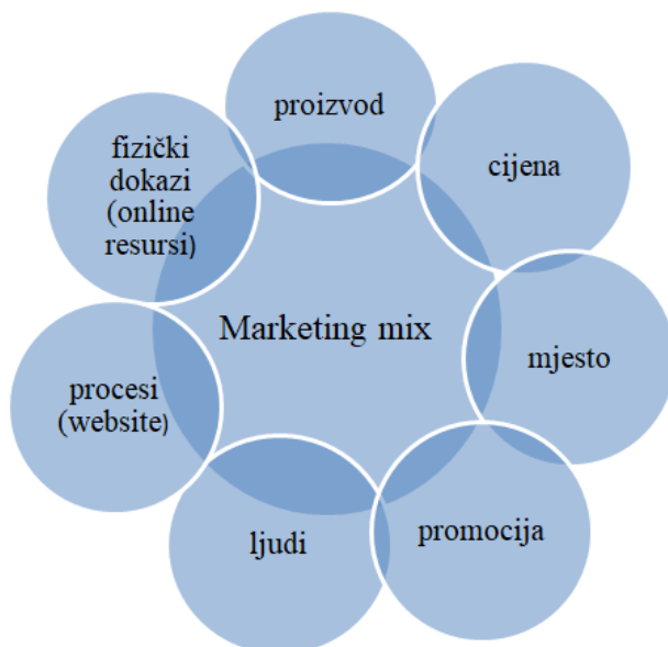
Slika 2. 7P e-marketing mixa