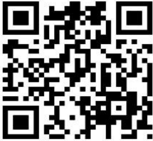
Slika 3. QR kod