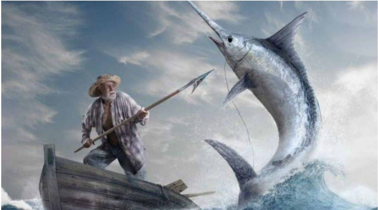
Slika br. 2: Ilustracija radnje – Ribar i marlin (prema naslovnici audio izdanja knjige)

Dok su turisti gledali golemi kostur, pogrešno pretpostavljajući da je to morski pas, starac se uputio kući sanjati lavove.