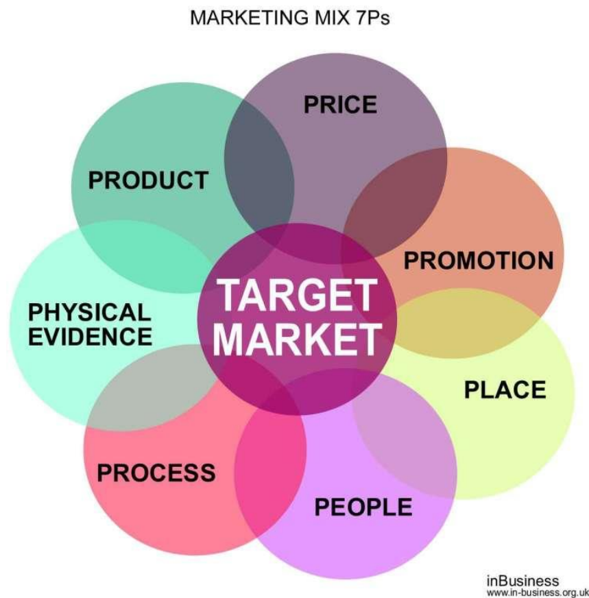
Slika 5. Marketing miks koncept 7P

Procesi se odnose na procese pružanja usluga ili proizvoda, a fizički dokazi na okruženje organizacije.