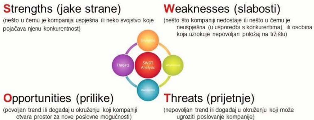
Slika 4. SWOT analiza