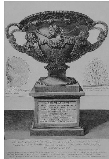
Slika 4 Warwick vaza, 1775., bakropis, 72 x 47.5 cm