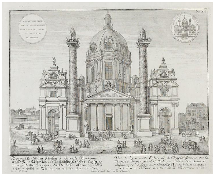
Slika 2 Johann Bernhard Fischer von Erlach, Vizualizacija Karlskirche -a, Beč, (1716.–23.)

slikarstva i djelima Petera Paula Rubensa, koji je na španjolskom dvoru boravio kao diplomat, ali i slikar kraljevskih portreta. Potaknut i impresioniran, taj susret bio je i okidač za Velázquezovo studijsko putovanje Italijom, iz kojega se izrodilo