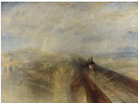
Slika 6 Kiša, para i brzina – Velika zapadna željeznica , 1844., ulje na platnu, 91 x 122 cm