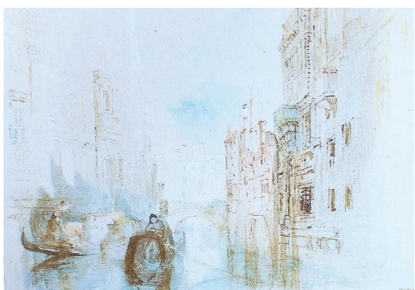
Slika 8 Pogled na jedan prijelaz preko kanala u blizini Arsenala , 1840., akvarel