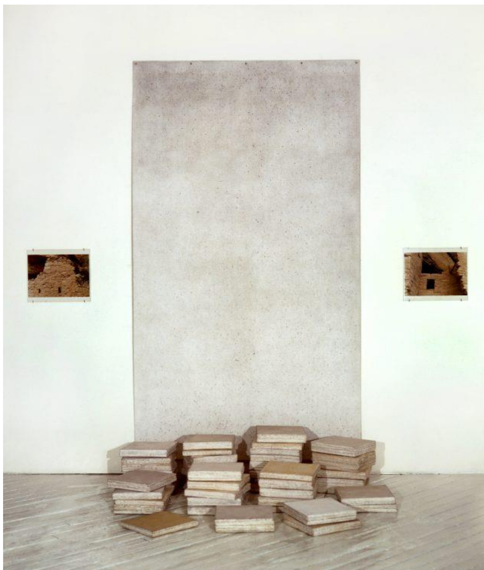
Slika 15 Michelle Stuart, Passages, Mesa Verde, (1977-79, Fig 3) , fotografije, rola muslin papira, ručno izrađeni papir, zemlja; promjenjive dimenzije

izražen teksturom, bojom i prirodnim materijalom, a ne tekstem i riječju kako bi se inače za format dnevnika očekivalo. Naslove svojih radova počela je davati i dokumentirati prema mjestu s kojega potiču, npr. Passage: Mesa Verde (1977-79, Fig 3) , a radovi su okupljali crteže, knjige i fotografije (Slika 15). Uključivanje fotografije, bio je logičan konceptualni slijed, a autorica je bila zaintrigirana fotografijama 19. stoljeća, posebno onima pejzaža Timothyja O'Sullivanova. U svojim radovima, Stuart je uključila vlastitu prošlost, emocije i psihu, kao i geološku prošlost posjećenog podneblja.