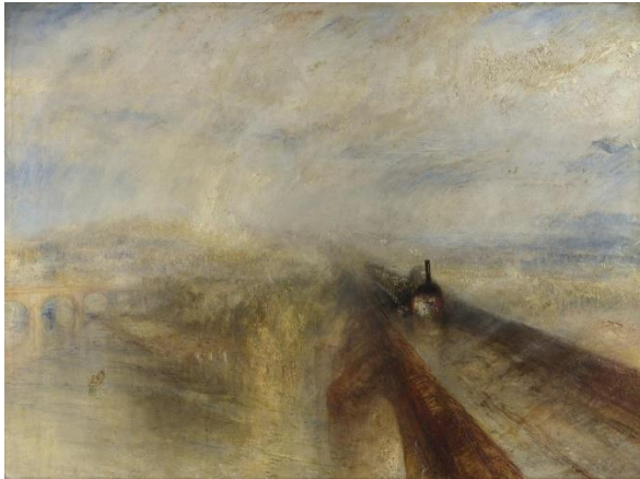
Slika 6 Kiša, para i brzina – Velika zapadna željeznica , 1844., ulje na platnu, 91 x 122 cm