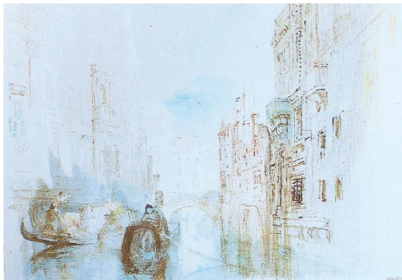
Slika 8 Pogled na jedan prijelaz preko kanala u blizini Arsenala , 1840., akvarel