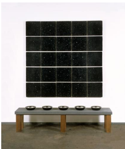
Slika 17 Michelle Stuart, Sheep's Milk and the Cosmos (1999: Fig 6), granit, drvo (klupa), pčelinji vosak, pigment, montirana platna, 157.5 x 157.5 x 3.8 cm

Nakon završene fizičke intervencije na pojedinoj sekciji papira, zamotala bi rolu te ju prenijela na drugo mjesto. Fizičke ostatke, odnosno komadiće i prah, zemlje i kamena bi dodatno utrljala rukama stvarajući jedinstvene grafizme i plohe preslikanog podneblja. Materijali tako modificiraju sam papir s kojim su bili u svojevrsnoj interakciji, a u izvedbi u kojoj je rolu papira odmotanu postavila na mjesto nastanka rada (Slika 16), Stuart je modificirala i sam krajolik te tako ujedno stvorila i jedinstvenu land art intervenciju.