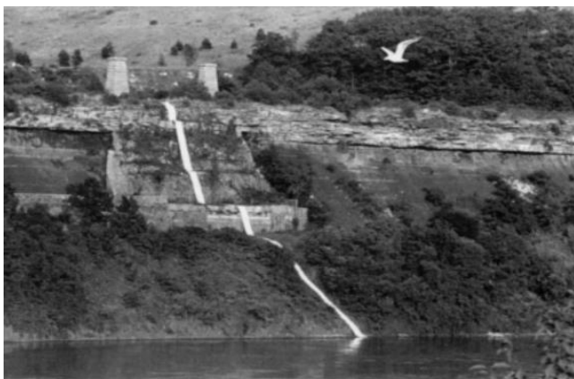
Slika 16 High Falls (1975-76, Fig 4), 333x155 cm

U radu High Falls (1975-76, Fig 4) Stuart je skupljala zemlju i kamenje sa određenih geoloških mjesta te ih je postavljala ili bacala na površinu velikih rola papira dužine oko 333x155 cm. Takvim činom ostavljala je gotovo utisnute forme na papiru, svojevrsno utisnuto sjećanje i identitet samoga mjesta i materijala na papirnatij površini.