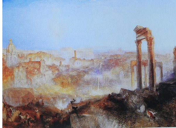
Slika 7 Moderni Rim – Campo Vaccino , 1839., ulje na platnu, 91.8 x 122.6 cm