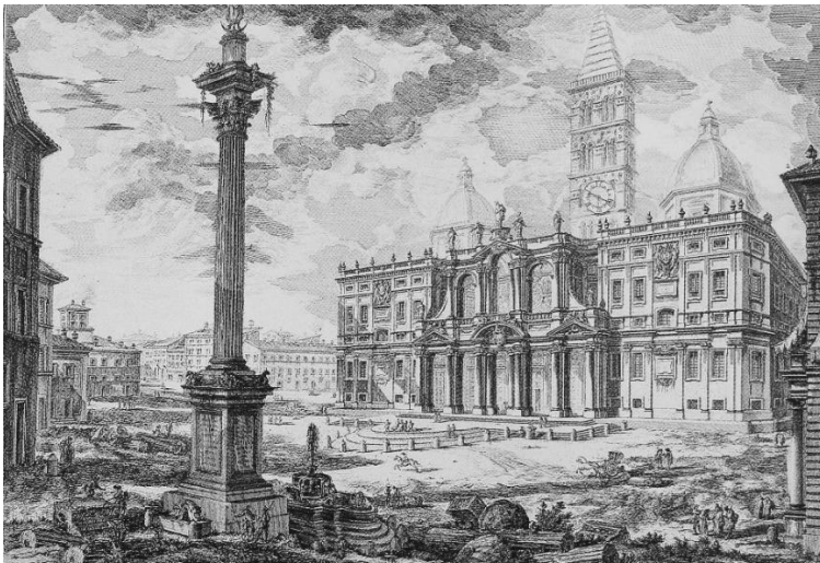
Slika 3 Veduta bazilike St. Maria Maggiore u Rimu, 1749., bakropis, 37.5 x 53.5 cm

stvarao je crteže i grafičke otiske koji su značajno pridonijeli slavi Rima i rastu klasične arheologije i neoklasicističkog pokreta u umjetnosti. Zahvaljujući svome stvaralaštvu, Piranesi je razvio koncepciju žanra vedute u umjetnosti, a vedute su koncept neizostavan ako govorimo u pogledu bilježenja posjećenih mjesta i krajolika, kako u području likovne umjetnosti, tako i u području kasnije fotografije.