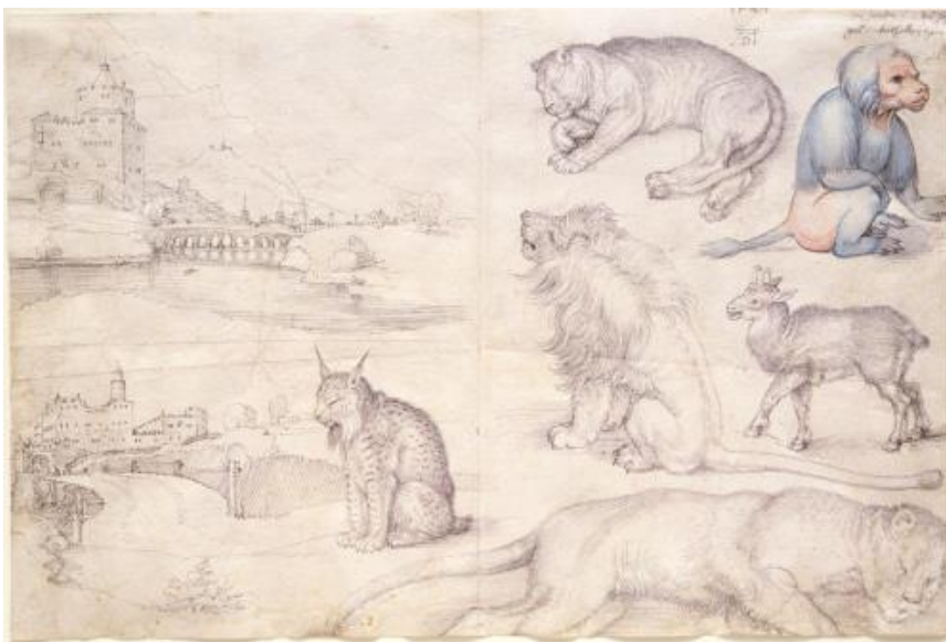
Slika 1 Detalj iz Dürerovog dnevnika Mein Buchlein , nastalog tijekom posljednjeg putovanja u Nizozemsku 1521. Smatra se da je crtež nastao tijekom posjeta zoološkom vrtu u Coudenberg Palace Brussel .

Nedugo nakon Kolumba, Magellan se istaknuo svojim velikim pothvatom prema Molučkim otocima. Nakon 96 dana mukotrpnog putovanja preko Pacifika i po prvi puta oko svijeta, tek su se osamnaestorica članova vratila sa začinicima, no bez Magellana i većine posade. Prvi veliki istraživački pothvati, osim neuspjeha ekspedicija i visoke stope smrtnosti i rizičnosti putovanja, imali su i još jednu negativnu stranu, a to je bio katastrofalan i poguban utjecaj na domaće stanovništvo. Primjerice, dolaskom Kolumba na otok Hispaniola, 1492. godine, pa sve do 1535., broj domorodačkog stanovništva je pao s gotovo osam milijuna na nulu. (Diamond, 2007:227) Ponašanje prvih istraživača odskakalo je od moralnih normi kakvih se držimo danas, pa su oni na domorodačko stanovništvo gledali kao na ljude drugog i trećeg reda i iako su osvajali u ime Boga, ubojstva se najčešće nisu smatrala grešnim činom. U ponašanju nekih turista godinama poslije, kao i danas, ostaju posljedice tih prvih utjecaja osvajačke europske kulture prema kulturama ostatka svijeta. Louis Turner i John Nash o tome pišu: „Prvi dojmovi koje je stekla Europa gledajući strani svijet postali su trajni i stalni dio etosa zapadne kulture. U tim je danima bilo vrlo malo putnika koji su se trudili udubiti u lokalne zajednice koje su otkrivali. Čovjek se pita je li s uopće išta promijenilo?“ (Horvat, 1999:149)