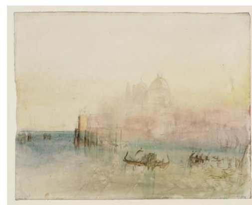
Slika 9 Venecija: Bacino, Canale della Giudecca i Canale di San Marco , 1840., akvarel i grafit, 40.9 × 56.2 cm

Svrha tih putovanja bila je dokumentirati i prikupiti vizualni materijal koji će se koristiti kao inspiracija i referenca za njegove kasnije radove, pretežito ulja na platnu. Svako novo mjesto koje je Turner posjetio ponudio mu je nove izazove: promjenu zemljopisa i okruženja, nova poznanstva i iskustva, uzbudljivu arhitekturu i, što je najvažnije, različite kvalitete svjetla (Slike 6-9). Putujući, ponajprije se otisnuo na putovanja van Britanije, pa je tako istraživao Francusku, Belgiju, Nizozemsku, Njemačku, Luksemburg, Dansku, Bohemiju (današnju Češku), Švicarsku i, naravno, Italiju. Iako su njegova putovanja bila česta, ipak ona su bila ograničena na područje Europe, dok su neki od njegovih suvremenika u isto to vrijeme započinjali svoje rute u Egipat, Španjolsku ili britanske kolonije u Aziji i Australiji.