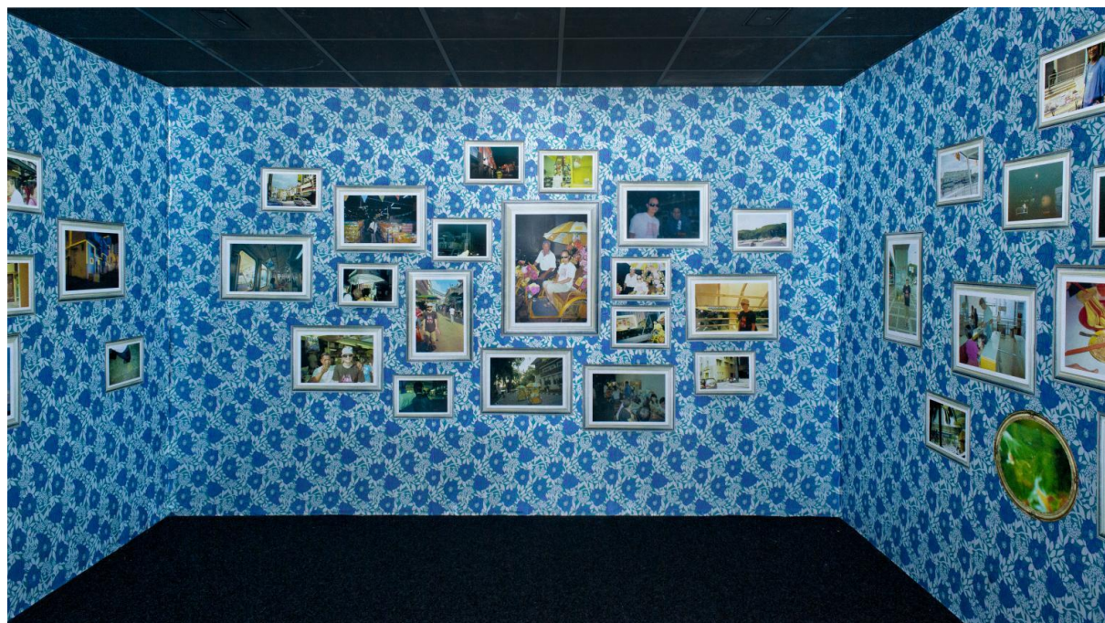
Slika 13 A Travel without Visual Experience , 2008., tapeta, 201 fotografija, boja, naljepnice; dimenzija prilagodljiva prostoru; Izložen na Liverpool Biennial 2012 u Liverpool Tate Museum-u

Na podlozi na kojoj su izložene uokvirene fotografije, nalazi se tapeta plavog cvjetnog uzorka kojom se referira na azijsko podneblje i pejzaž. Izložene fotografije nalikuju fotografijama s odmora, prikazujući osobe s kojima je putovao, zajedničke objede i sl. Generalno, takav model fotografija ujedno služi kako bi osoba drugima pokazala doživljeno vrijeme na putovanju, no isto tako fotografije su i element uma koji se prema potrebi pretražuje i pruža sjećanja na posjećena mjesta ili vremena. (Newman, 2012.)