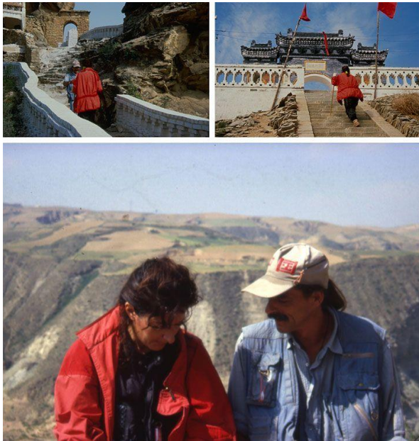
Slika 14 Ljubavnici (1988.). Susret i završetak performansa Marine Abramović i Ulaya nakon 3 mjeseca hoda Velikim kineskim zidom.

Neovisno o životnoj situaciji i produciranom radu, nedvojbeno je da su putovanja ostavila utjecaj u djelovanju i razmišljanju Marine Abramović. Ponekad su ona bila bijeg od trenutnih teškoća, ponekad težnja za samoostvarenjem, duhovnom preobrazbom ili želje za slobodom. Snažni Marinin karakter i iskušavanje granica vlastitih mogućnosti, kako psihičkih tako i granica boli u fizičkom smislu,