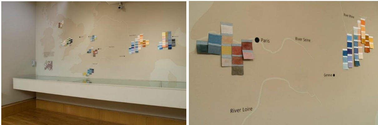
Slika 10, 11 Prikaz promijene tonaliteta boja u Turnerovom slikarstvu uzrokovanih bivanjem na različitim mjestima u Europi

Putovanje je Turneru bila centralna koncepcija. Često je putovao pješice ili kočijom i to najčešće sam, a skice i crteži bili su njegova glavna prtljaga. U svom putujućem stvaralaštvu načinio je više od tristo bilježnica sa skicama. Moderniji oblik putovanja iniciran pojavom parne lokomotive, pojavio se tijekom druge polovice njegovog radnog vijeka, i tako je znatno smanjio vrijeme putovanja, a Turneru omogućio dijelom intenzivnije i dinamičnije stvaralaštvo. Njegova europska putovanja omogućila su mu izvor materijala za novu seriju raskošno ilustriranih putopisa, odnosno skica, akvarela, studija i ulja na platnu. Ipak, ono što je dragocjeno i umjetnički relevantno, jesu njegove studije svjetla koje je pojedinačno koloristički diferencirao, odnosno one su bile njegov odgovor na mjesta koja je posjetio (Slike 10, 11). Ta postignuća do kojih je došao kontinuiranom izradom studija kao i eksperimentalnim postupcima i „nedovršenosti“, kasnije su poslužila impresionistima u njihovoj ideji, istraživanju o dinamici prikaza svjetlosti.