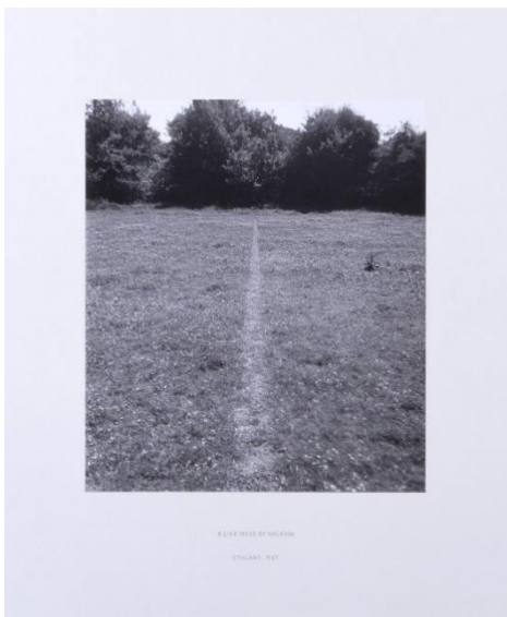
Slika 12 Richard Long, A Line Made by Walking , 1967., želatinsko-srebrova fotografija, 825 × 1125 mm

"Značaj hodanja u mom radu je u tome što on unosi vrijeme i prostor u moju umjetnost; prostor znači udaljenost. Umjetničko djelo može biti putovanje." (Long u: Higgins, 2012.) Tim riječima, Richard Long (1945.-) obilježio je i velikim dijelom sazeo poetiku svoga stvaranja. Još kao student 1967. godine napravio je djelo pod nazivom A Line Made By Walking - fotografiju ugažene trake u travi, kroz livadu u blizini njegove kuće u Bristolu (Slika 12). Bio je to revolucionarni gest, zbog