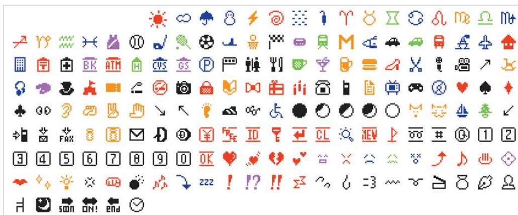
Slika 1. SHIGETAKA KURITA, EMOJI , 1998-1999, DIGITALNA SLIKA, RAZLIČITE VELIČINE.

Ako se uz sve navedeno uzme u obzir da djeca imaju pristup pametnim uređajima postoji velika mogućnost da imaju bolje razvijenu vizualnu percepciju, a ponajviše vizualno pamćenje jer su stalno okružena slikama i raznim drugim vizualnim medijima. Kroz razne igre potiče se pamćenje oblika i njihovih namjena, a kroz komunikaciju putem interneta koja uključuje uporabu takozvanih emoji-a potiče se sve kompleksnije interpretiranje slika i oblika. Naime, emoji su sličice koje komuniciraju određene poruke o raspoloženju i sličnome. Sa začecima u 90-ima, prvo su nastali kao font wingdings razvijen za Microsoft kako bi se zaobišao tada učestao problem ograničenog prostora i kompjuterske memorije te spore brzine Interneta. (Why the Wingdings font exists, 2015) Windgdings je omogućio uporabu slike u tekstu radi uljepšavanja i sličnoga. (Why the Wingdings font exists, 2015) Naravno ovaj font je i dalje daleko od suvremenih emoji-a, čiji pravi početci su u 1999. kada Shigetaka Kurita dizajnira set od 176 emojija za mobitele i pagere. (Shigetaka Kurita, 2019)