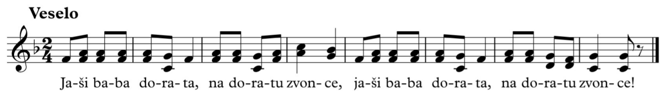
Slika 6. Zapis Jaši baba dorata , Prkovci (Njikoš, 1988: 75)