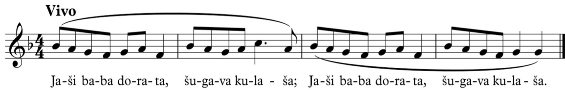
Slika 8. Zapis Jaši baba dorata , Lužani (Žganec Sremac, 1951)