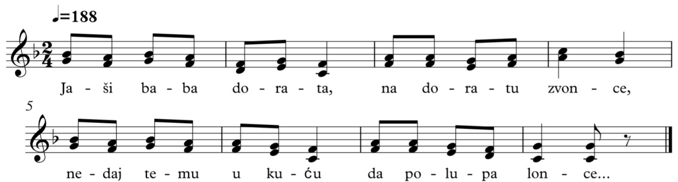
Slika 5. Zapis Jaši baba dorata , Slobodna Vlast