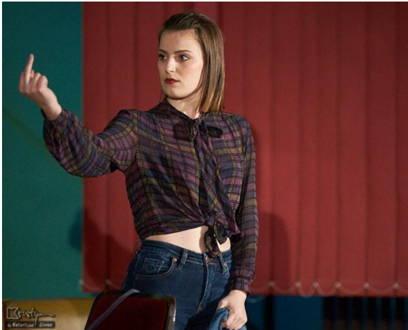
Slika 4 – Ljalja