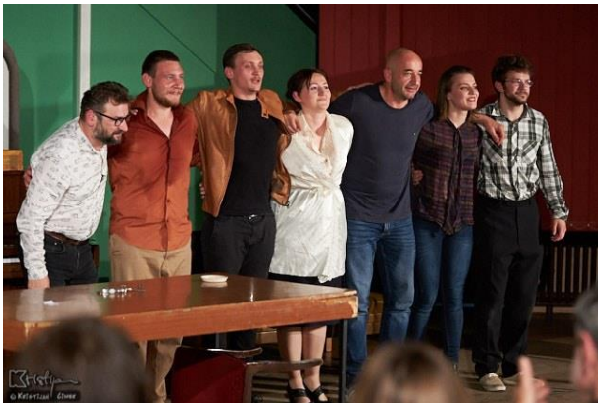
Slika 2 - glumci s mentorom i redateljem