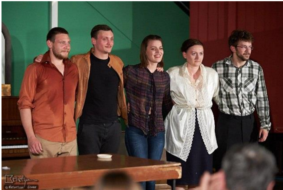
Slika 1 - glumci

Rad na svakoj predstavi je dugotrajan proces i potrebno je više čimbenika koji su značajni za ostvarivanje kvalitete produkta (predstave) koji se prikazuje publici. Kao što je rekao Hamlet: „(...) daleko je od svrhe glumljenja, kojemu je cilj, kako nekoć tako i sada, bio i jest, držati tako reći zrcalo prirodi (...)“ 1 , pa je prema tome jedan od važnijih čimbenika u radu na predstavi - vrijeme - bez kojega ne bi postojala ni evolucija čovjeka, a prema tome ni predstava. Osim vremena koje je potrebno kako bi materijal dobio svoju formu i sadržaj, jednako je važan i izbor teksta ili predložka po kojemu se radi( poznato je da je dobar tekst pola posla). Svako umjetničko djelo ima svoju misao vodilju, poruku i smisao, a ono bez čega ni jedno umjetničko djelo ne bi postojalo je umjetnički poriv. Poriv umjetnika da stvori nešto dolazi iz unutarnje potrebe da promjeni nešto. Kao što su ljudi po prirodi drugačiji, tako se i umjetnici razlikuju u mnogočemu, pa je tako i izbor suradnika u stvaranju predstave nepobitan čimbenik u ostvarivanju kvalitetne predstave. Upravo razmišljajući na taj način i uzimajući u obzir čimbenike o kojima govorim, započeo sam rad na svojem diplomskom ispitu i rad na predstavi Draga Jelena Sergejevna . Proces je trajao devet mjeseci, obuhvatio je rad devet umjetnika, a bio je diplomski ispit troje mladih glumaca.