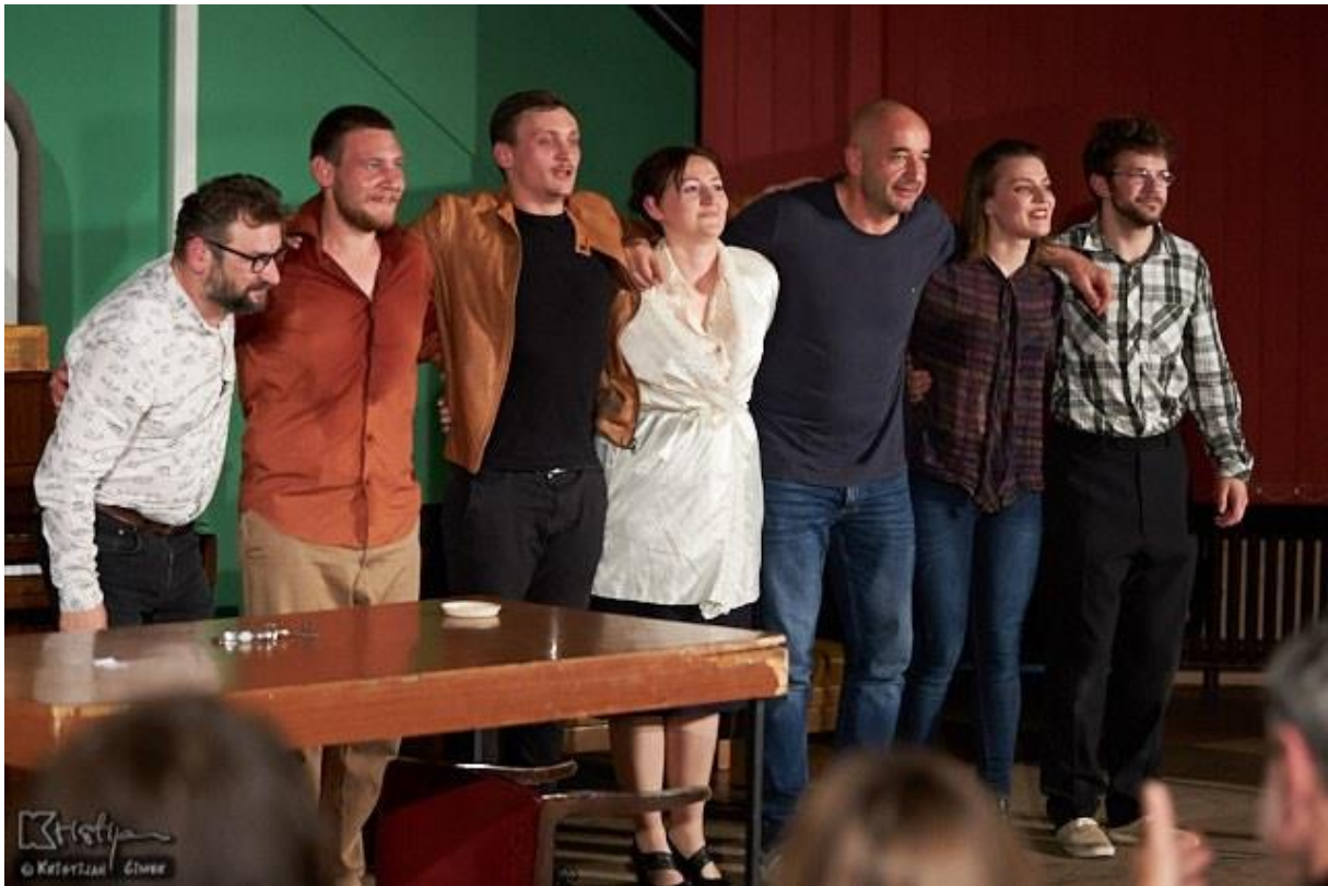
Slika 2 - glumci s mentorom i redateljem