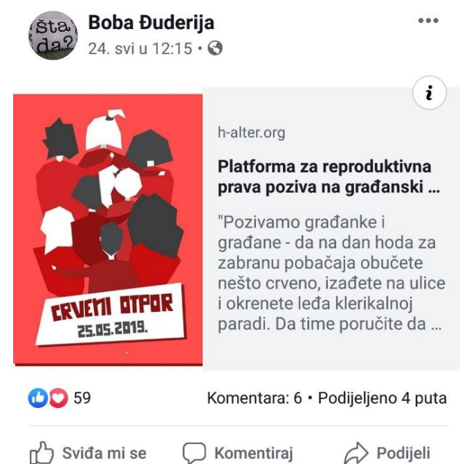
Slika 5: Boba Đuderija poziva ljude na akciju