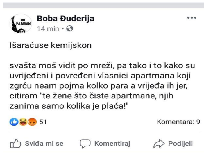
Slika 1: Humor Bobe Đuderije