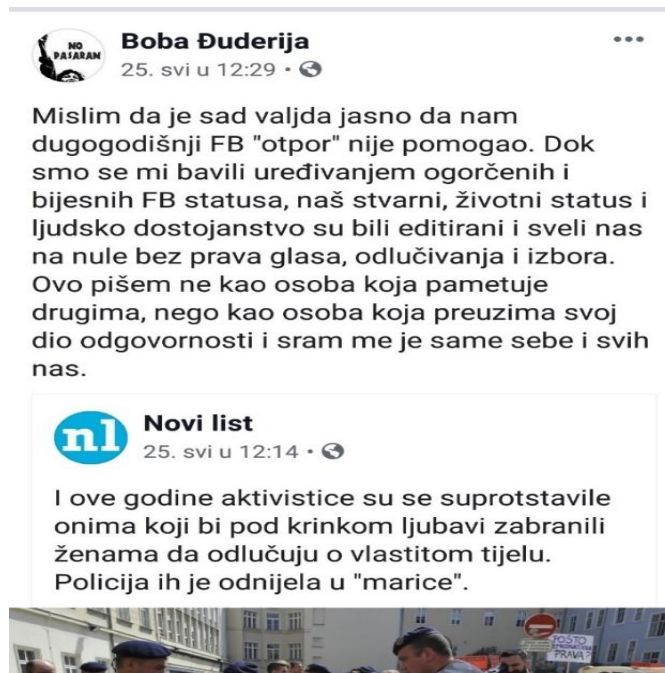
Slika 4: Komentar Bobe Đuderije na aktualna zbivanja