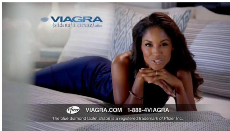
Fotografija 1.