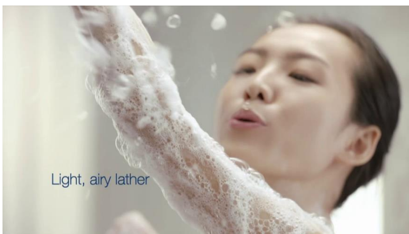
Fotografija 6.

Mnoge zemlje koje imaju razvijeni životni standard su provele zakone protiv seksualne objektivizacije u oglašavanju koji ih reguliraju. (Kaluder, 2014 prema Holmes, 2008) Golotinja je pritom dozvoljena isključivo ukoliko se reklamira proizvod koji je na taj način usko povezan s tijelom, kao što su na primjer proizvodi za pranje i njegu tijela. Isto tako, sadržaj reklame u kojoj se prezentira taj proizvod mora biti u skladu sa zakonom i u nijednom smislu ne smije biti vidljiva seksualna objektivizacija. Također, postoje zemlje koje su u potpunosti zabranile golotinju s obzirom na njihovu tradiciju i vjerovanja. Izrael je jedna od njih gdje je „...zabranjeno postavljanje plakata koji oslikavaju seksualno ponižavanje ili prikazuje osobu kao objekt slobodan za seksualno korištenje“. (Israel Penal Law 5737-1977:71, 1977)