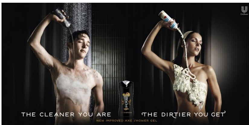
Fotografija 7. Racked, 2014. (Preuzeto: 21. srpnja 2019.)