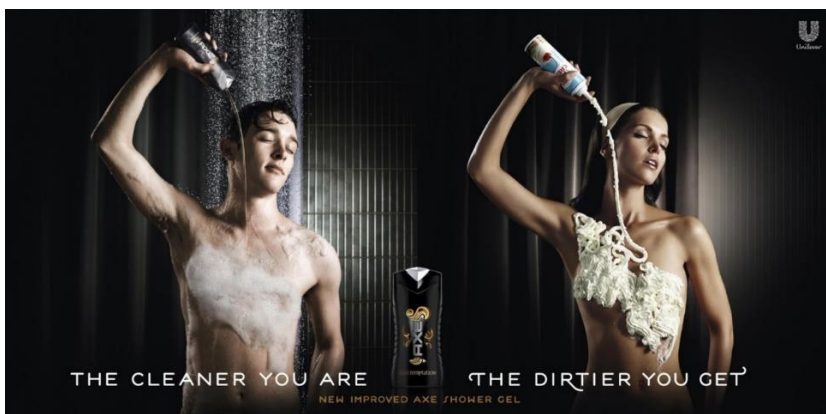
Fotografija 7. Racked, 2014. (Preuzeto: 21. srpnja 2019.)