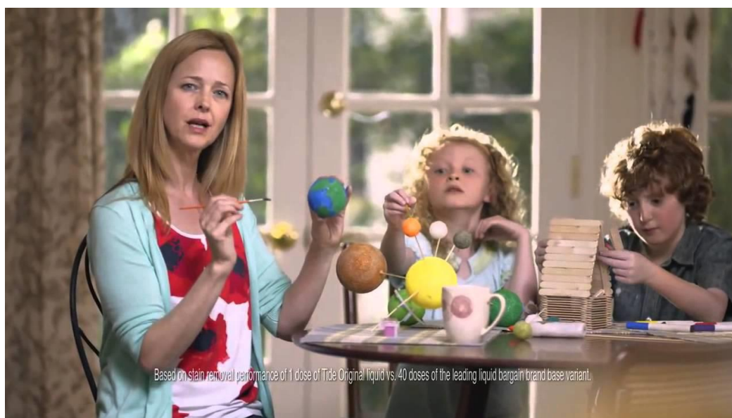
Fotografija 3. Youtube, 2013. (Preuzeto: 17. srpnja 2019.)

Primjerice, reklama za Ariel kapsule prikazuje žene kako plešu i pjevaju dok peru odjeću na ruke, reklama za Tide deterdžent u kojoj žena s djecom sjedi za stolom i radi školski projekt te ističe kako je napustila svoj posao kako bi bila više s djecom, reklama za Snickers u kojoj je muškarac prikazan u tijelu isfrustrirane žene, a društvo mu govori da pojede čokoladicu jer se ponaša kao diva itd.