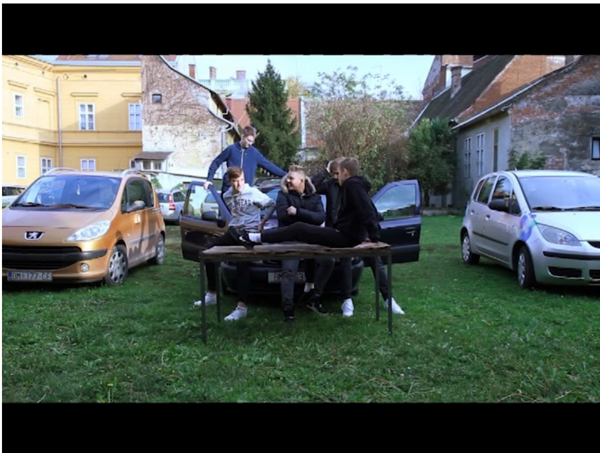
Slika 19. Skupina 5, reinterpetacija umjetničkog djela Lovre Artukovića - Potpisivanje deklaracije o pripajanju Zapadne Hercegovine i Popova polja Republici Hrvatskoj

Video zapis reinterpetacije Skupine 5 dostupan je za pregled preko poveznice https://vimeo.com/378235554 nakon unosa zaporke „RadionicaMLU321“ bez navodnih znakova.