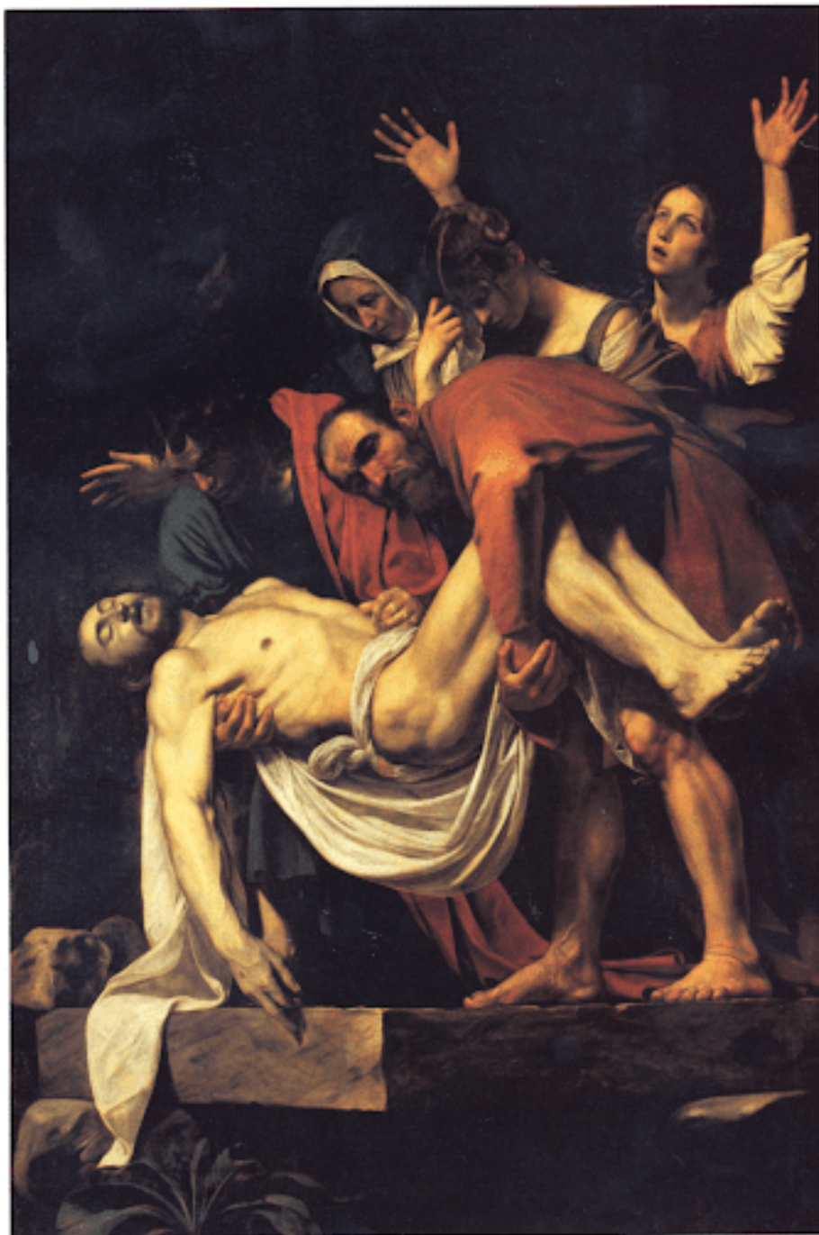
Slika 14: Michelangelo Merisi de Caravaggio, Polaganje Krista u grob , 1602.-1604.