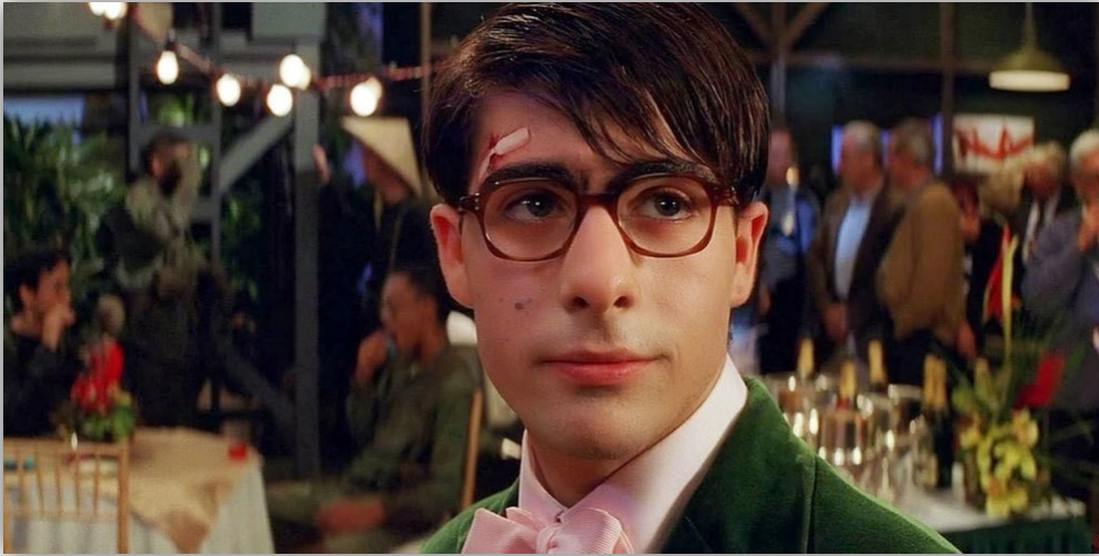
Slika 1. Rushmore , 1998.