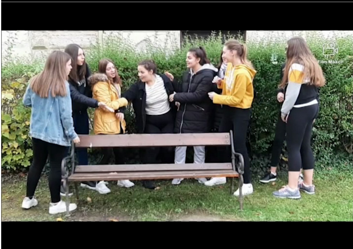
Slika 20. Skupina 6 snimljena od strane voditelja (gore) i vlastiti snimak (dolje) pri izvođenju reinterpetacija umjetničkog djela Lovre Artukovića - Potpisivanje deklaracije o pripajanju Zapadne Hercegovine i Popova polja Republici Hrvatskoj