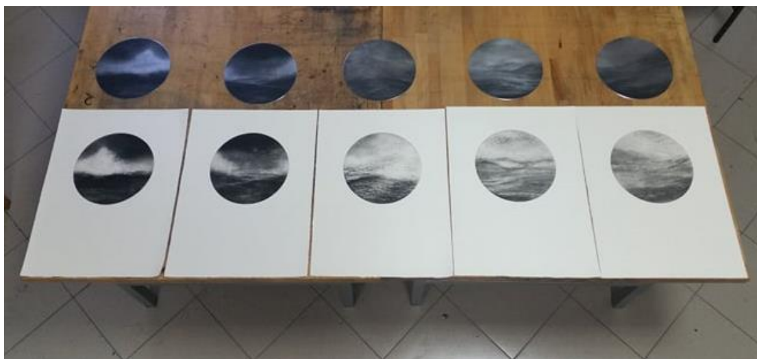
Slika 5: probni otisci konačne izvedbe rada

Matrice kao nositelji vizualnog zapisa konačno su pripremljene za zadnji čin na putu do konačnog ostvarenja. Postupci pripreme, čišćenja, nabojavanja i otiskivanja isti su kao u prethodnim fazama. Konačni rad otisnut je na 300 gramskom grafičkom papiru proizvođača Hahnemuhle. Vizualni identitet rada konačno dobiva svoju realnu sliku (na slici 6 nalazi se prikaz konačnog rada ) u apsolutnoj sintezi subjekta i objekta, naravi i duha.