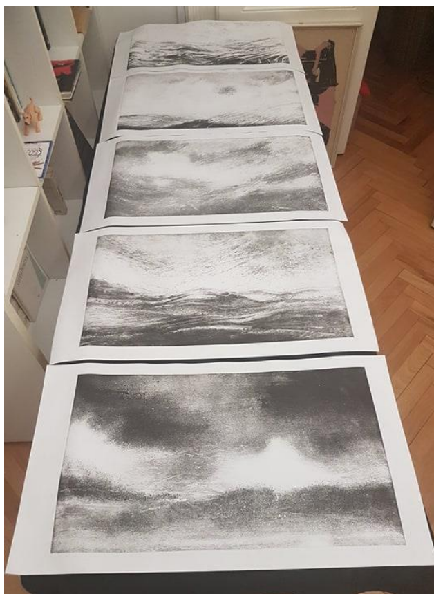
Slika 4: prikaz probnih otisaka faze procesa

Radovi su namjenski izvedeni na matricama dimenzija 30 x 60 cm (na slici 4 nalazi se prikaz probnih otisaka dimenzije 30x60 cm), koje su tek u konačnici rezane na oblik kruga promjera 24 centimetra. Kroz praktični rad uočio sam da kod unaprijed pripremljene matrice okruglog oblika, prilikom intervencije uljnim pastelom, može doći do neželjenih pogrešaka, jer uljni pastel prilikom crtanja zapinje za rub, fasetu, matrice, čime se na otisku povećava dojam izoliranosti kruga, a smanjuje sugestija protočnosti i kontinuiteta prikaza kroz „prozore“, radove složene u nizu. Rezanje matrica u okrugli oblik izvedeno je škarama za ručno rezanje lima što zahtjeva odgovarajuće praktično iskustvo. Na kraju je posebna pažnja posvećena preciznoj izradi faseta, koju je zbog zaobljenog oblika teže postići.