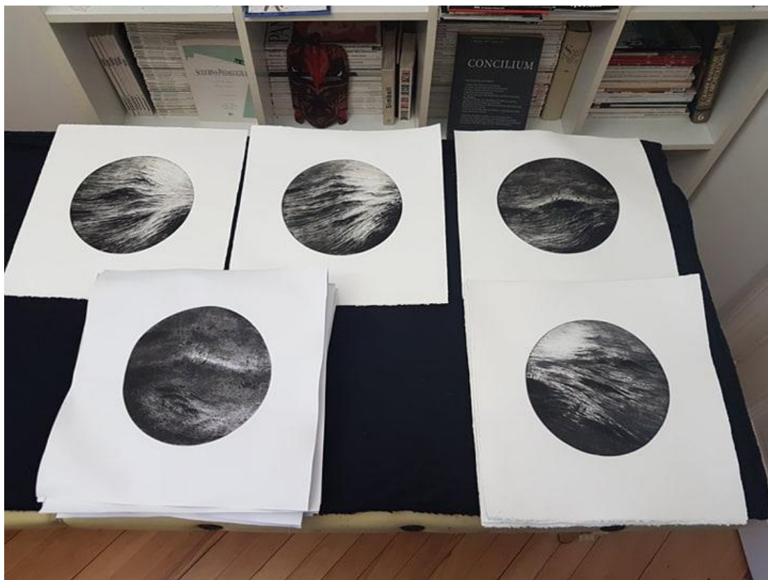
Slika 2: primjeri monotipija

određen i statičan lik, čvrsto fiksira motiv i suprotstavlja se njegovom karakteru temeljenom na ideji da ništa nije statično, da se sve kreće. Kružnica, kao pravilna, obuhvatna linija kruga, počinje i završava kretanjem točke u svom početku, ujedno kraju, što si konceptualno predstavljam kao circulus vitiosus 6 ili začarani krug. Zbog lakše vizualne percepcije konačnog izgleda rada pred samom intervencijom rezanja matrica na konačni okrugli oblik izradio sam nekoliko monotipija na identičnoj veličini (na slici 2 nalazi se prikaz otisaka monotipija).