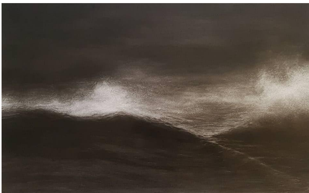
Slika 1: reprodukcija crteža ugljenom

Za sklop radova Monumenta Pannonica crteži su realizirani po imaginaciji, bez predložaka (na slici 1 nalazi se prikaz primjera crteža). Rađeni su ugljenom i grafitom kao sredstvima koja i inače koristim u crtežu. Ugljen i grafit su u svojoj strukturi meki čime su idealno sredstvo za izražavanje atmosfere, koja svojom mekoćom simbolično prezentira nastajanje i nestajanje, konstantno nas podsjećajući da ništa nije statično, da se sve kreće. Atmosferska ili zračna perspektiva u prirodi je pojava koju naše oko registrira kao promjenu tonova uslijed udaljavanja oblika od gledatelja. Što su predmeti udaljeniji oni su bljeđi, mekših obrisa i s daljinom gube intenzitet. U mojim radovima takva atmosfera, korištena i prikazana, daje dojam određene smirenosti.