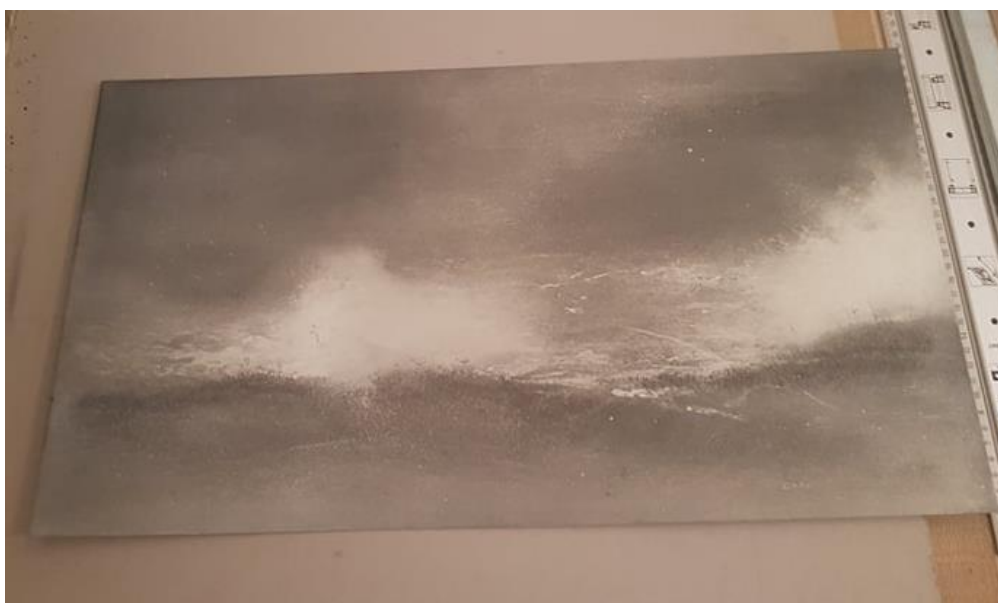
Slika 3: prikaz matrice pravokutnog oblika dimenzije 30x60 cm

Evidentiranje trenutka putem grafičkog zapisa u sekvencama, kontradiktorno je tradicionalnoj reproduktivnoj funkciji grafike. Meni je namjera evidentirati trenutke, u teorijskoj mogućnosti prema beskrajnom nizu, a ne umnožavati konačni grafički zapis. “Cilj originalne grafike i nije umnožavanje crteža odnosno grafičke slike, nego je jedno od mnogobrojnih umjetničkih samostalnih sredstava izražavanja” 8 . U rasponu izražajnih mogućnosti grafike potrebno je bilo odabrati odgovarajuću tehniku koja nudi specifičnu izražajnost. Želju da u grafičkom radu zadržim što više likovnih elemenata crteža postupkom oblikovanja višetonske slike realizirao sam u tehnici akvatinte 9 .