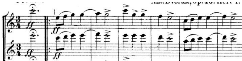
Slika 3. Notni zapis teme (melodija)

Prvi ples, pod nazivom Furiant , napisan je u C – duru u tempu Presto. Radi se o brzom plesu u \frac{3}{4} mjeri sa karakterističnim naglascima. U prvom taktu teme pojavljuju se dvije osminke i dvije četvrtinke pri čemu su naglasci na svaku od doba, dok drugi takt možemo podijeliti kao 1+2, pri čemu je četvrtinka nenaglašena i vezana ligaturom sa notom iz prethodnog takta, a polovinka naglašena.