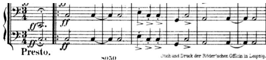
Slika 4. Notni zapis teme (pratnja)

Dionice udaraljki i instrumenata koji ne sviraju melodiju tvore zanimljiv ritam hemiole 3 .