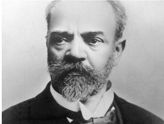
Slika 1. Portret Antonína Dvořáka