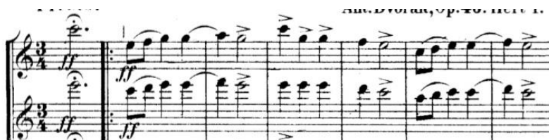
Slika 3. Notni zapis teme (melodija)

Prvi ples, pod nazivom Furiant , napisan je u C – duru u tempu Presto. Radi se o brzom plesu u \frac{3}{4} mjeri sa karakterističnim naglascima. U prvom taktu teme pojavljuju se dvije osminke i dvije četvrtinke pri čemu su naglasci na svaku od doba, dok drugi takt možemo podijeliti kao 1+2, pri čemu je četvrtinka nenaglašena i vezana ligaturom sa notom iz prethodnog takta, a polovinka naglašena.