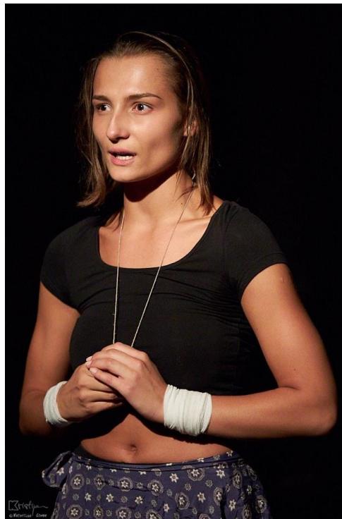
Slika 5. Samo-stimulacija u odrasloj dobi.