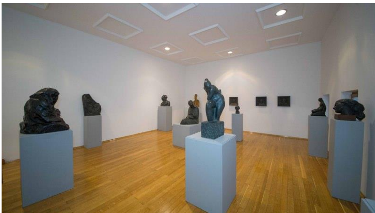
Slika 6. Stalni postav Spomen galerije Ivana Meštrovića u Vrpolju (3)