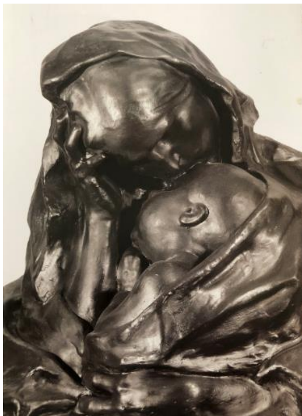
Slika 10. Majčina briga skulptura