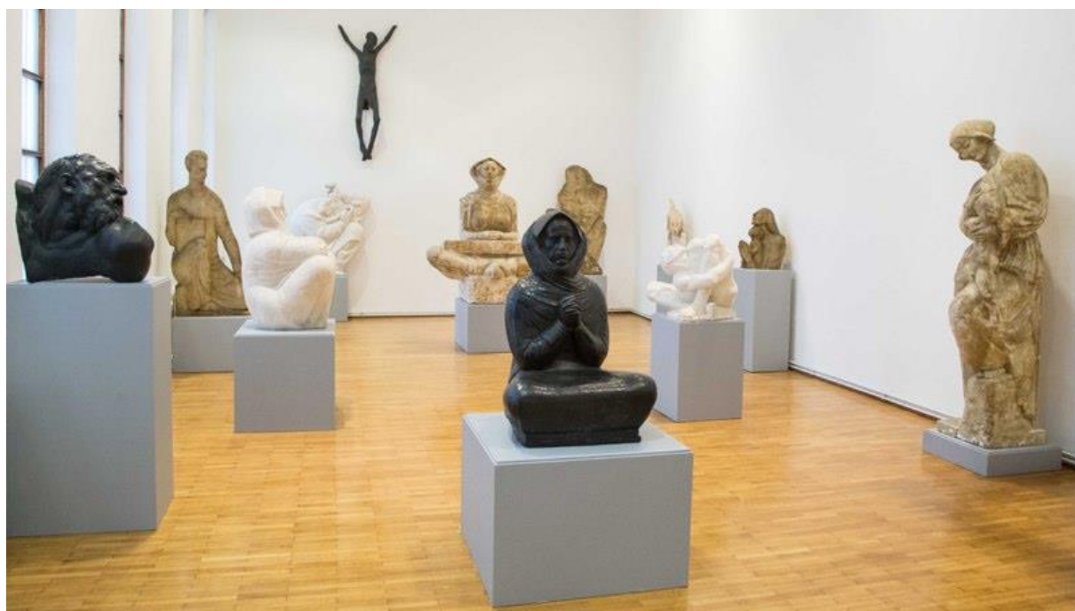
Slika 4. Stalni postav Spomen galerije Ivana Meštrovića u Vrpolju (1)