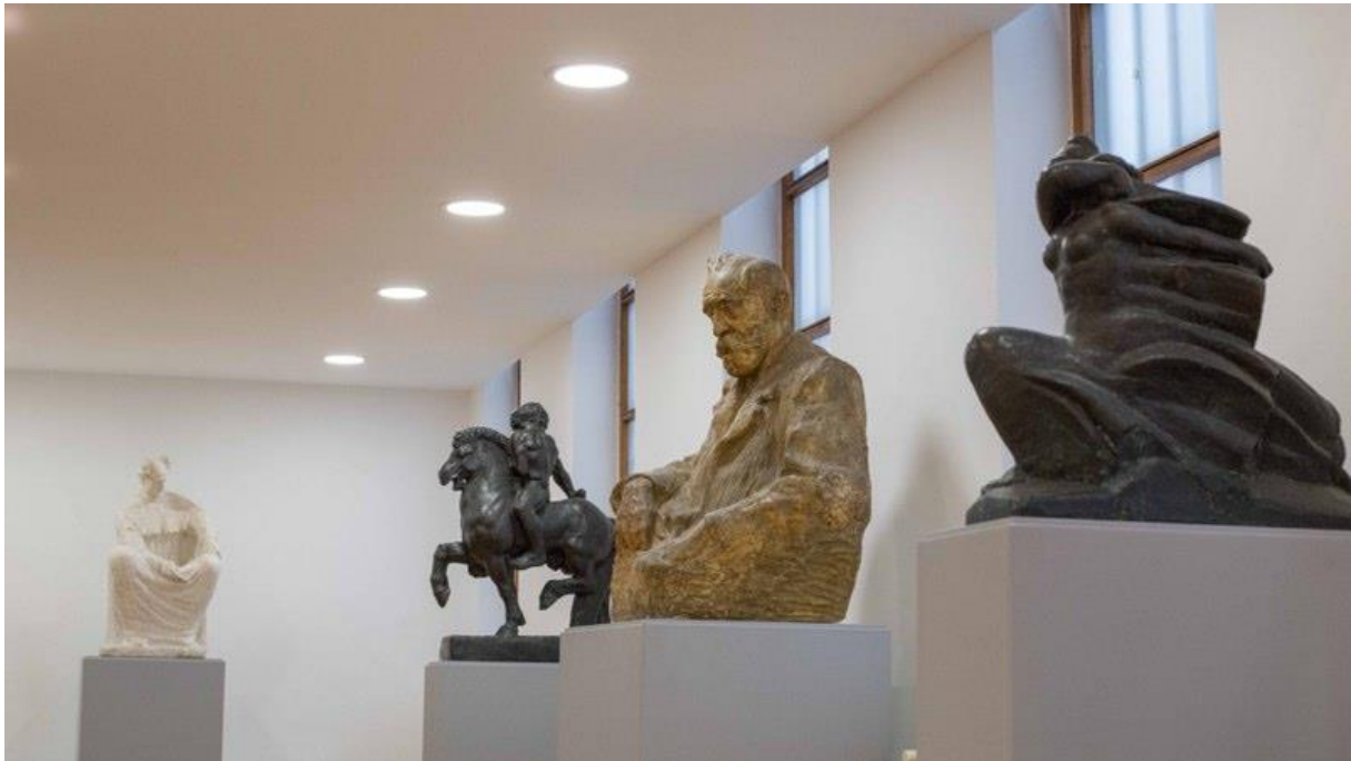
Slika 7. Stalni postav Spomen galerije Ivana Meštrovića u Vrpolju (4)