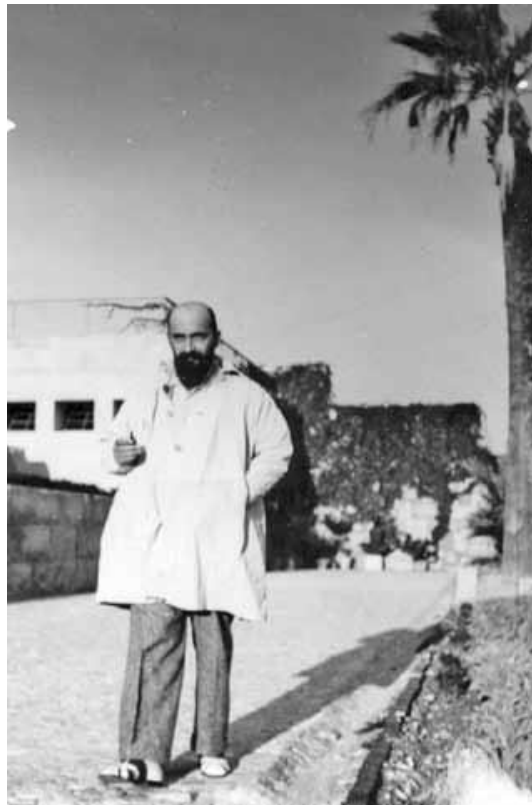
Slika 1. Ivan Meštrović