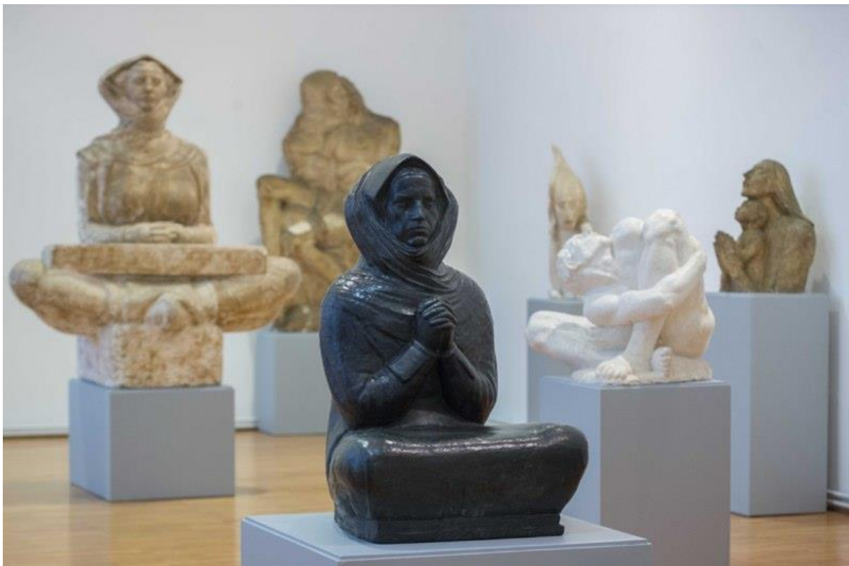
Slika 9. Djevojka u zanosu molitve, skulptura