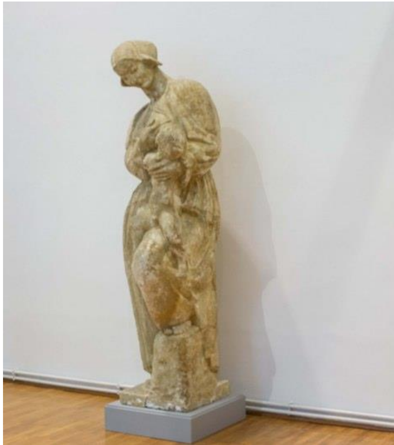
Slika 14. Majka doji dijete