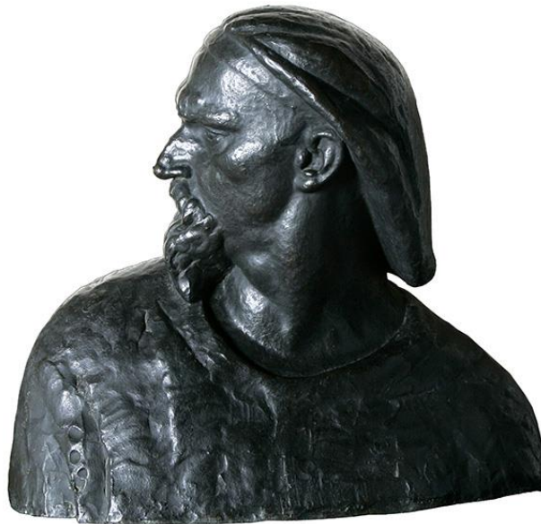
Slika 8. Autoportret Ivana Meštrovića, skulptura