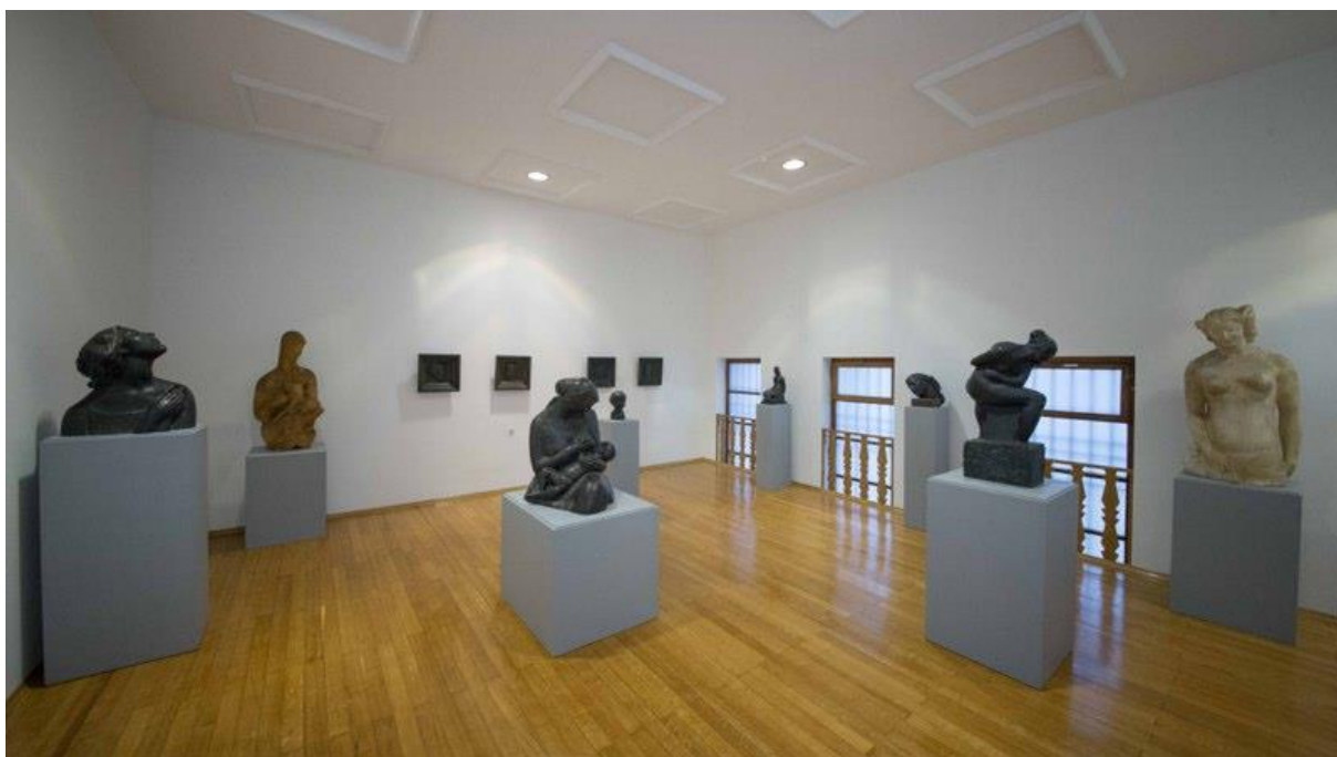
Slika 5. Stalni postav Spomen galerije Ivana Meštrovića u Vrpolju (2)