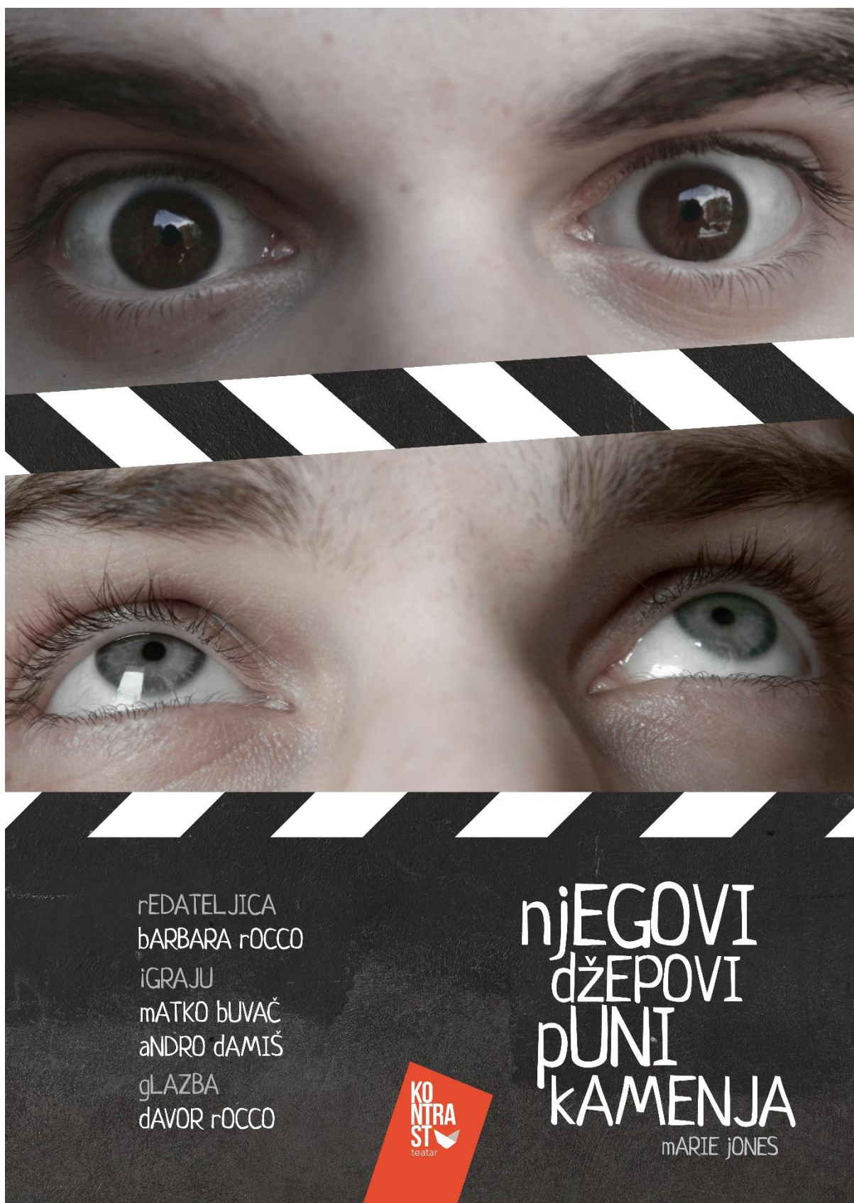
Slika 1: Plakat predstave Njegovi džepovi puni kamenja