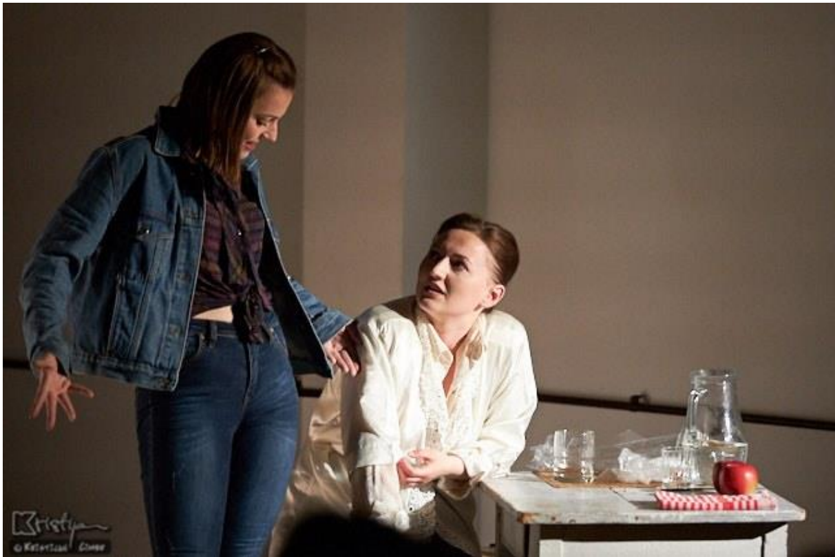
Slika 2. Ljaljin kostim

Kosa je bila prirodno puštena, s par podignutih pramenova sa strane koje su držale crne šnalice. Na licu sam imala osnovni make-up, malo pudera, maskare i rumenila, s tamnocrvenim ružem za usne.