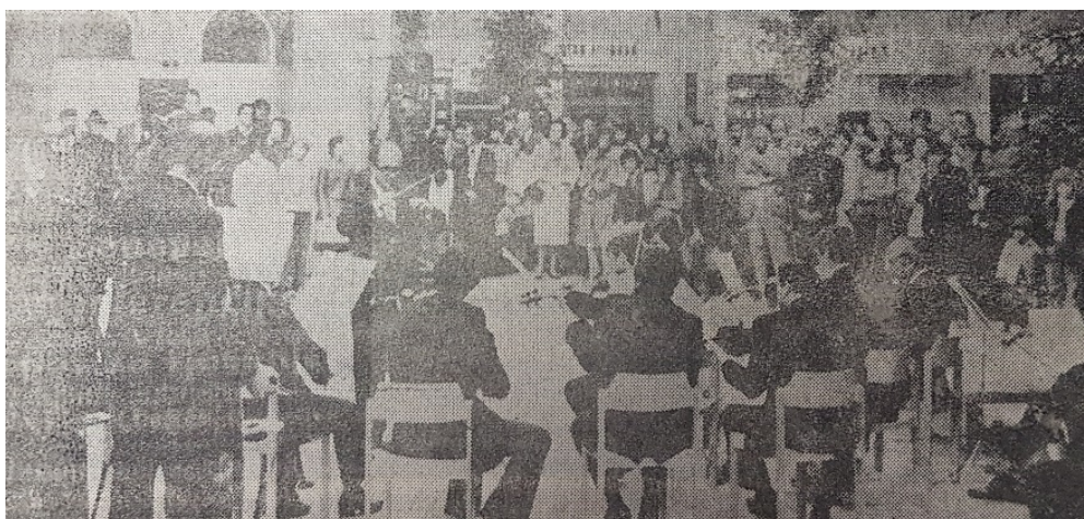
Slika br. 3 – Otvorenje Memorijala, nastup Gudačkog orkestra HNK Osijeku

I peti je memorijal simbolično najavljen i otvoren pred spomenikom Franje Krežme izvedbom Koncerta u A duru Ivana Maneta Jarnovića, orkestra Hrvatskog narodnog kazališta u Osijeku 9. svibnja (ponedjeljak) u 18 sati. Istog dana, u 20 sati održan je i prvi koncert na kojem je nastupilo devetero učenika iz srednjih glazbenih škola (Zagreba, Varaždina, Subotice, Čuprije, Osijeka, Beograda i Tuzle) (A.R., 1977a).