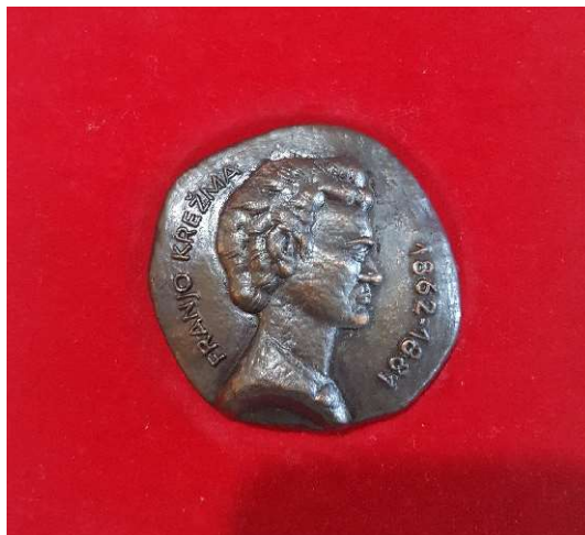
Slika br. 2 – plaketa Memorijala Franje Krežme, djelo kipara Vanje Radauša koji je dobio svaki sudionik Memorijala (stražnja strana)