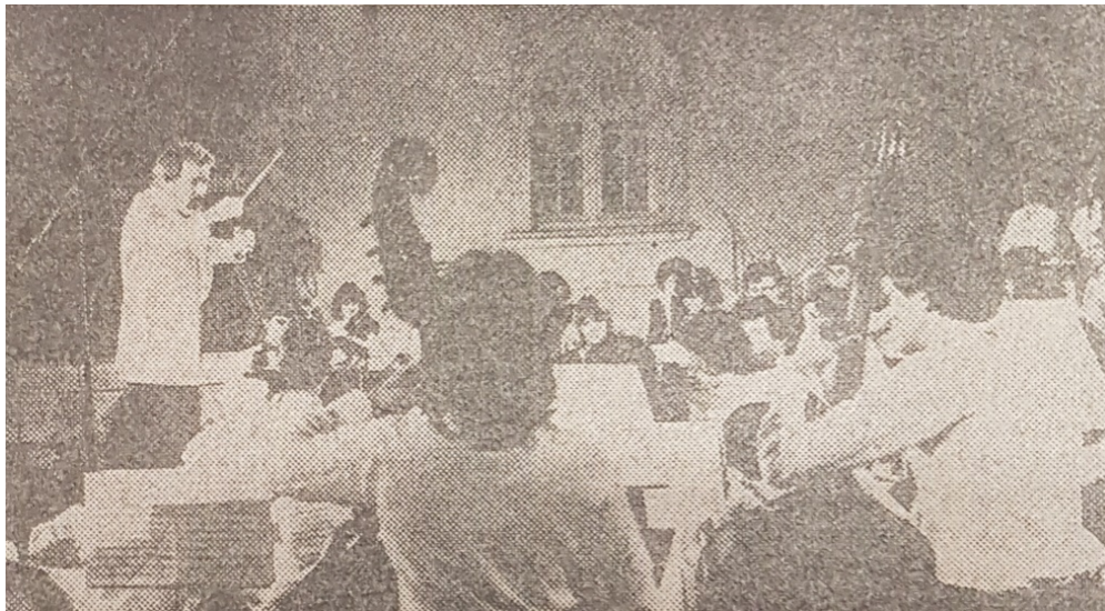
Slika br. 6 – Simfonijski orkestar OOUR-a Muzičke škole iz Zagreba

Sva tri koncerta održala su se u Svečanoj dvorani Pedagoškog fakulteta, gdje su se i narednih godina održavali koncerti u okviru Memorijala (B. I., 1983).