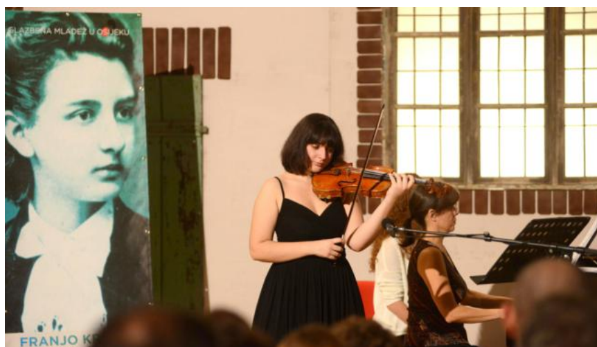
Tablica br. 40 – Popis izvođača na 23. Memorijalu Franje Krežme