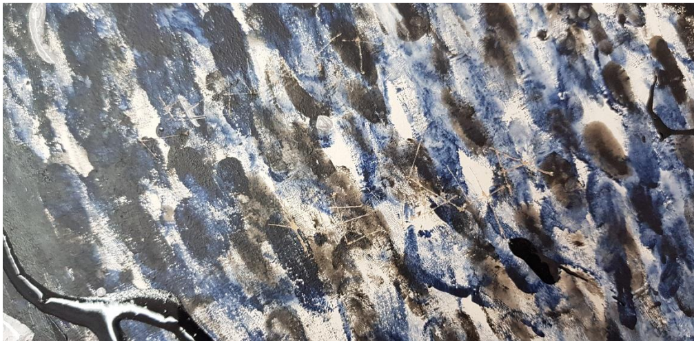
Slika 5. Detalj „ Nevalja“