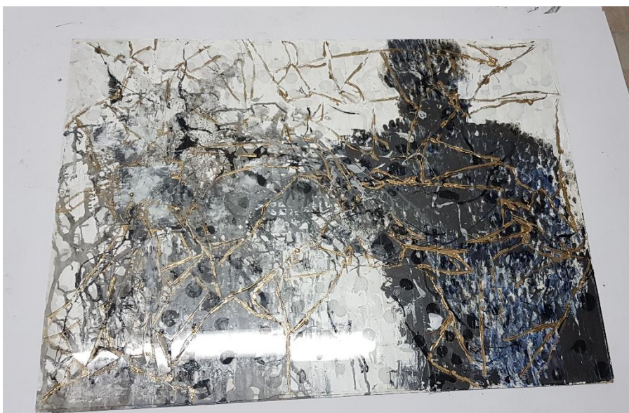
Slika 8. Završni rad „Puna praznina“