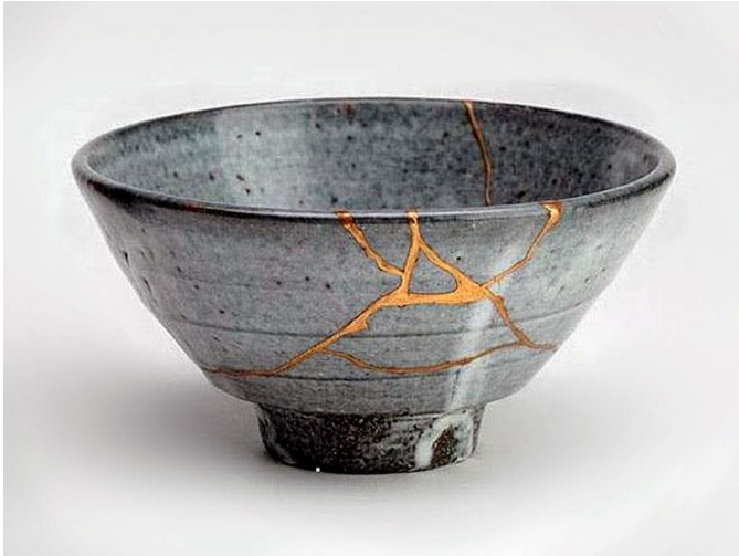
Slika 1. Japanske vaze –Kintusgi