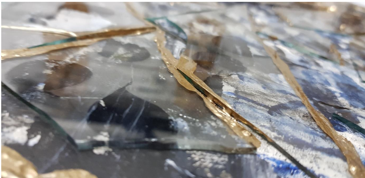
Slika 6. Detalj stakla