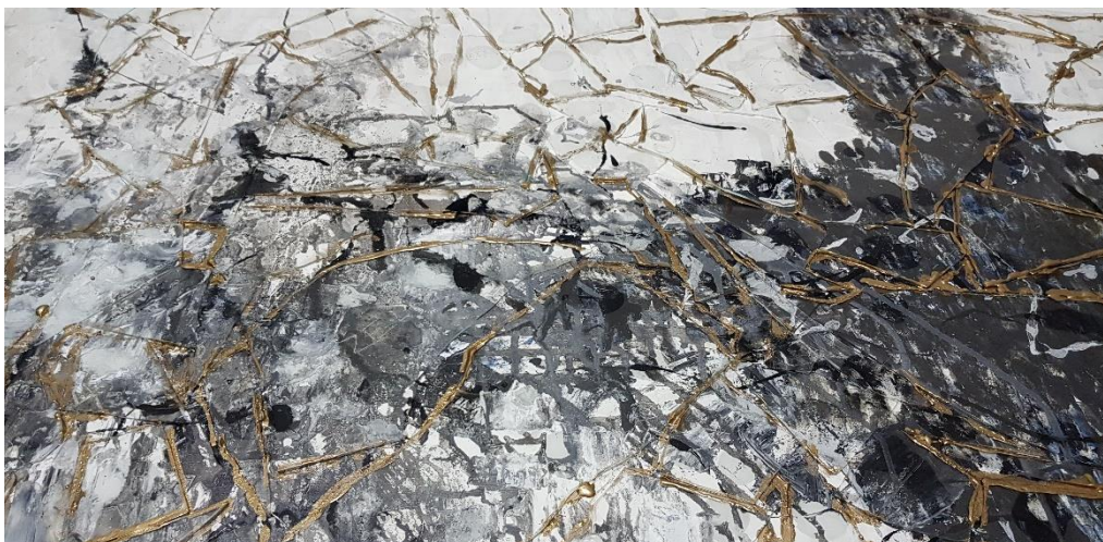
Slika 7. Detalj