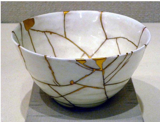
Slika 2. Kintusgi-umjetnost popravljanja posuđa sa zlatom