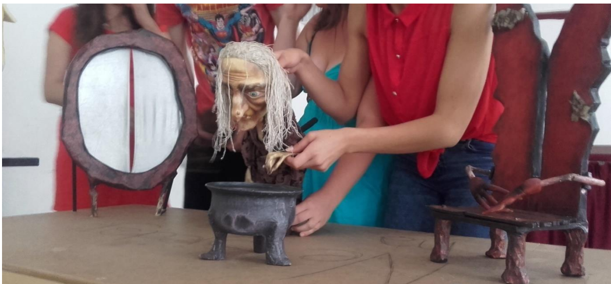
Slika VI. Unutrašnjost dvorca

Djevojčičina kuća: nježna seoksa kućica s jednim drvcem na sceni.