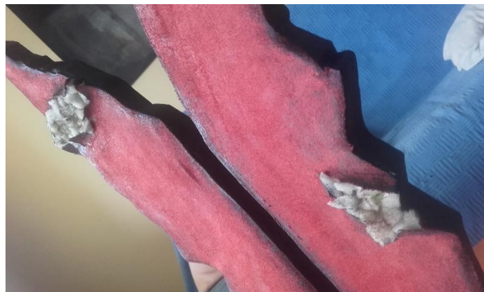
Slika IX. Brušena koža u kombinaciji sa spužvom

Da bi se ruke mogle na praktičan način animirati stavila sam vodilice izrađene od tipla. Dodavanjem šarke i vodilice dobila sam na fleksibilnosti i pokretljivosti. Kad se rukohvat stolca animira imamo dojam živog lika koje može izraziti emociju, dohvaćati stvari, zarobiti Lovorku...Naslonjač je modeliran u stiroduru te je preko njega zalijepljena crvena brušena koža (Slika IX.).