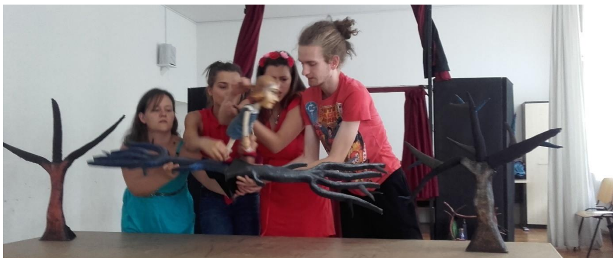
Slika XVII. Prikaz kretnje elemenata po zraku

Ovi elementi na sceni bili su potrebni kako bi se pokazala oživljenost i začaranost unutrašnjosti dvorca. Radi se o vještici koja se bavi magijom. U dramskom tekstu stoji da su elementi začarani i trebaju se kretati po zraku, plesati...(Slika XVII.).