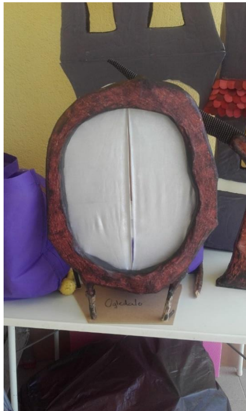
Slika XV. Zrcalo

Okvir zrcala koje se pojavljuje u unutrašnjosti dvorca modelirano je u stirodoru a zrcalnu površinu dočarala sam srebrnim platnom. Platno služi kao čaroban ulaz u dvorac kroz koja dolazi Lovorka, te za tehniku sjena kojom se prikazuje gubitak Zlogrbinog slomljenog srca (Slika XV.).