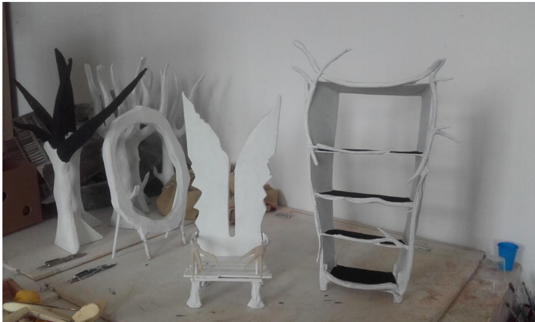
Slika XIII. Prikaz siluete oštih oblika s oštrim karakterom linija

Silueta elemenata koji su povezani sa Zlogrbom su oštih i zupčastih linija (Slika XIII.), time sam željela naglasiti strogoću , oštrinu, i potencijalnu opasnost.