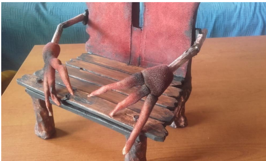
Slika VIII. Stolec s pokretnim rukama

Da bi se ruke mogle na praktičan način animirati stavila sam vodilice izrađene od tipla. Dodavanjem šarke i vodilice dobila sam na fleksibilnosti i pokretljivosti. Kad se rukohvat stolca animira imamo dojam živog lika koje može izraziti emociju, dohvaćati stvari, zarobiti Lovorku...Naslonjač je modeliran u stiroduru te je preko njega zalijepljena crvena brušena koža (Slika IX.).