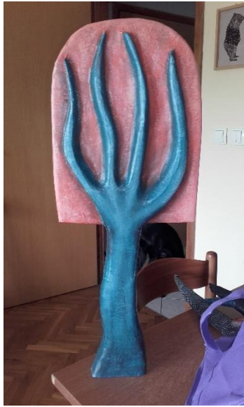
Slika XIV. Prikaz oblika sa blagim karakterom linija