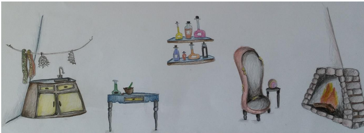
Slika I. Prikaz skice koja ne zadovoljava karakter dvorca vještice

Prve skice koje sam načinila nisu odgovarale zastrašujućoj i jezivoj atmosferi te dramskom zapletu. Na njima se primjećivala ta blaga, ugodna i kućna atmosfera koja se nije uklapala u cijelu priču (Slika I.).