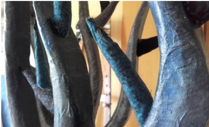
Slika X. Prikaz boje i grančica presvučenih u platno

Boje koje prevladavaju na elementima većinom su tamne i hladne. Odabirom takvog spektra boja željela sam postići mračni izgled šume koja vodi do strašnog dvorca. Prikaz mračne šume prije nego li se dvorac pojavi, uvod je u zaplet „strašne“ priče. Male grančice od spužve presvučene u platno koje je usklađeno s bojom drveta, imaju ulogu razbijanja statičnosti drveta (Slika X.).