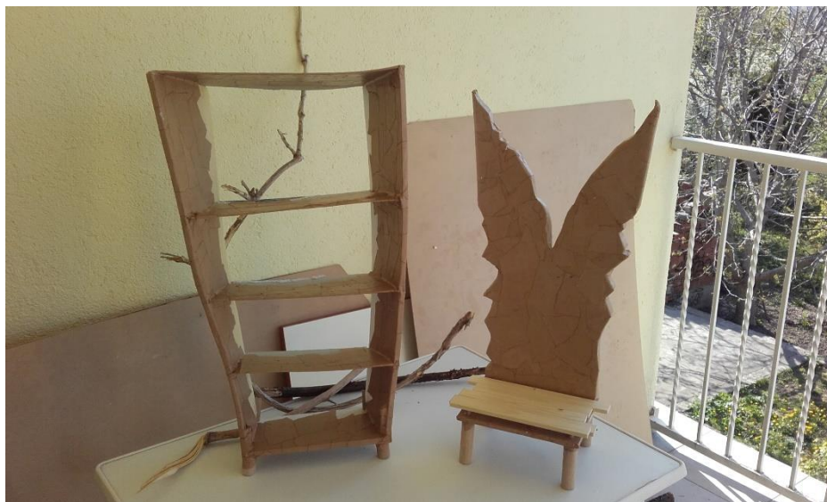
Slika III. Realizacija elemenata

Nakon što su skice odobrene krenulo je modeliranje i realizacija elemenata (Slika III.).