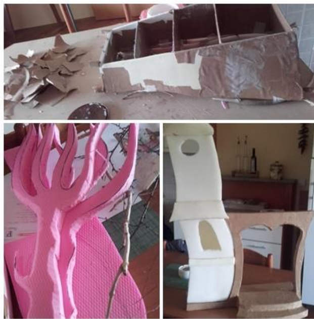
Slika VII. Modeliranje

Prije nego što sam počela izrađivati scenografiju, dobro sam razmotrila potrebe koje trebaju zadovoljiti određeni scenografski elementi. Nakon istraživanja različitih materijala, promišljanja o spojevima krenula sam s izradom (Slika VII.).