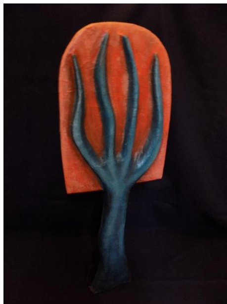
Slika XII. Lovorkina kuća i drvo