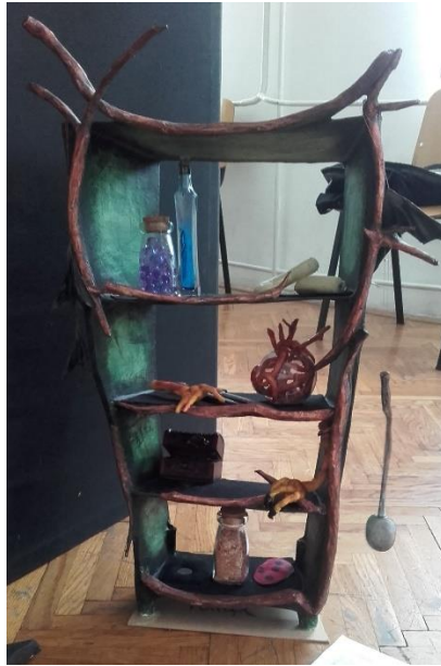
Slika V. Polica s napitcima

Unutrašnjost dvorca sastoji se od glomazne i velike police sa sastojcima za kuhanje napitaka (Slika V.). Važnost police i napitaka je u dočaravanju opasnosti vještichjeg dvorca. Stolackoji je ujedno i oživljava kao lik sa rukama, zarobi Lovorku. Kotao koji služi za kuhanje kreme i čarobnog zrcala u kojem gledamo igru sjena te kroz koje prolaze lutke u unutrašnjost dvorca. (Slika VI.).