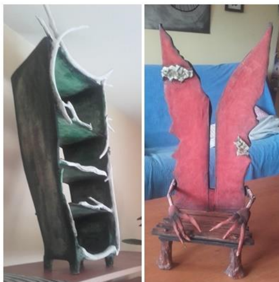
Slika XI. Komplimentarni kontrast

htjela sam prikazati skrivenu živost Zlogrbe ispod te sve silne prljavštine i crnila. S druge je strane stolac koji je u crvenoj boji i prikazuje njezinu agresiju, te skupa s tom živosti daje dojam podvojenosti. Blagi i nježni tonovi pojavljuju se u sceni prikaza Lovorkine kuće, oni nam opisuju njezin karakter koji je nježan i nevin (Slika XII).