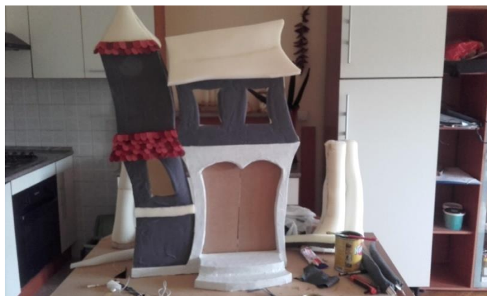
Slika XVI. Prikaz loše forme dvorca

Kroz razgovor s glumcima doznala sam da dvorac treba „progutati“ djevojčicu Lovorku. Zamislila sam da se dvorac nadvije nad nju i „proguta ju“ kroz vrata. Moja zamisao je imala još jedan nedostatak, bio je taj što je dvorac prenježan te nije odgovarao slici opake vještice. (Slika XVI.).