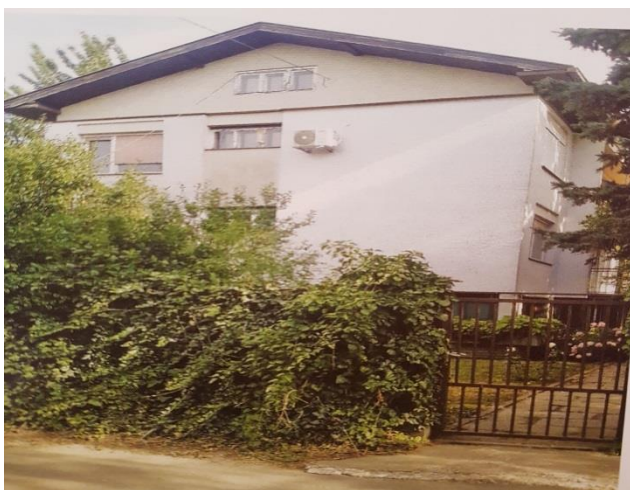
Slika 5. Kuća u kojoj je djelovao Glazbeni odjel u ulici Kate Pejanovića 5. 1998. godine

Nastava glazbenog odjela, održavala se u privatnoj kući, moguće je bilo održavati nastavu u četiri učionice. Takav način rada i u takvim uvjetima, trajao je tri školske godine. Nakon teškog početka, škola nastavlja sa održavanjem nastave u Borovu naselju u prostorijama Učeničkog doma u svega tri učionice.