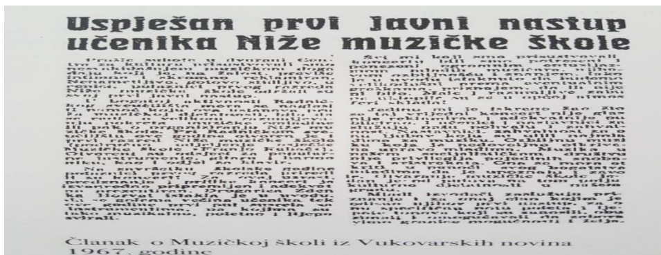
Slika 3. Članak o Muzičkoj školi iz Vukovarskih novina 1967. godine 10