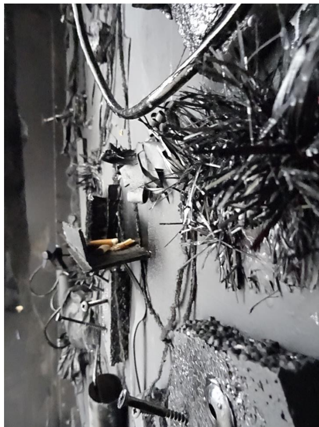
Slika 8: „Dvojnost percepcije“, Tina Mihaljević, detalj