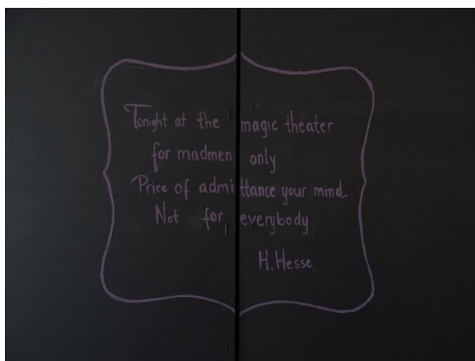
Slika 5: „Dvojnost percepcije“, Tina Mihaljević, detalj