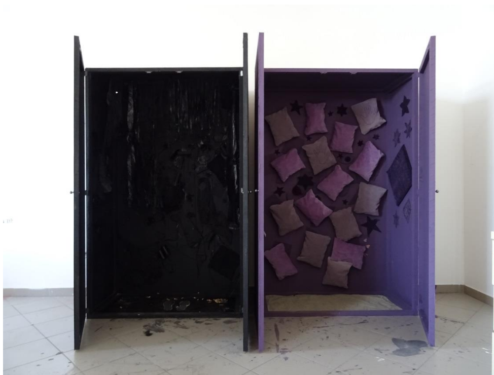
Slika 3: „Dvojnost percepcije“, Tina Mihaljević