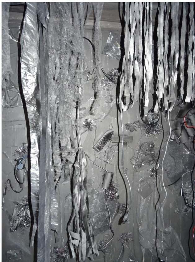
Slika 7: „Dvojnost percepcije“, Tina Mihaljević, detalj