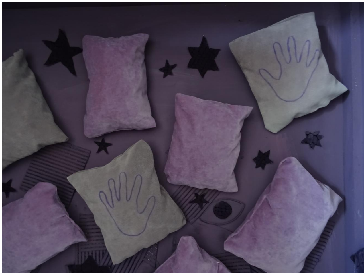
Slika 10: „Dvojnost percepcije“, Tina Mihaljević, detalj