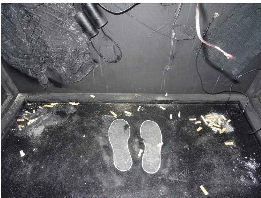
Slika 9: „Dvojnost percepcije“, Tina Mihaljević, detalj