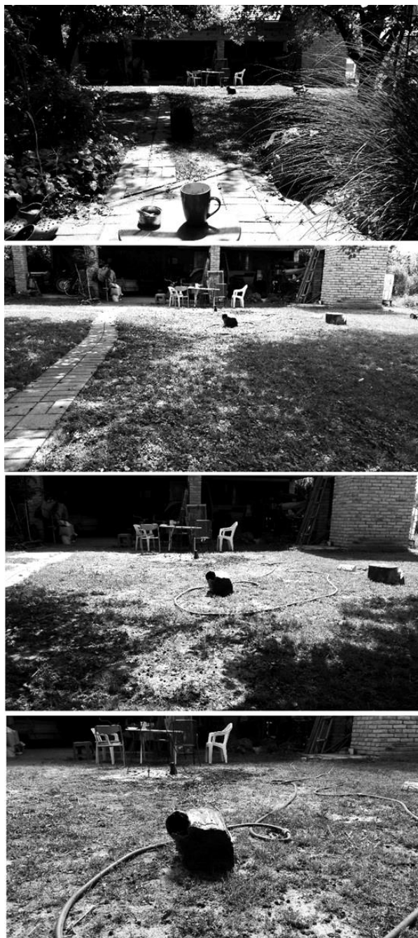
Slika 1: „Greška percepcije“, Tina Mihaljević

može „vidjeti“ neki vizualni rad. Ideja proizlazi iz pokušaja i težnje da se slijepoj osobi približiti vizualni, likovni rad, odnosno slika, tako da u samom radu primarno dominira taktilni i osjetilni motiv koji sam postavila u superiorniji položaj nad vizualnim. Baš kao i slijepo osobe u odnosu na osobe neoštećenog vida, koje će vizualni rad ovaj puta doživjeti intenzivnije zbog drugih osjetila koja su zbog nedostatka vida, bolje razvijena.