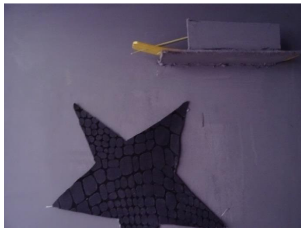
Slika 12: „Dvojnost percepcije“, Tina Mihaljević, detalj