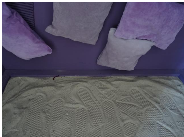
Slika 11: „Dvojnost percepcije“, Tina Mihaljević, detalj