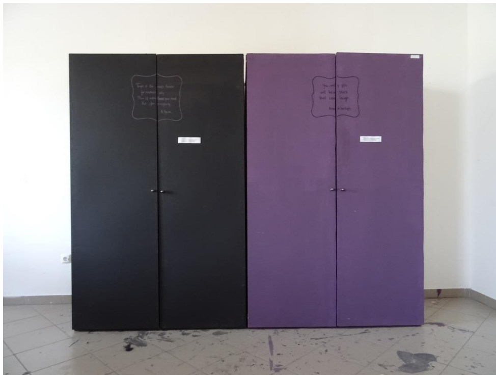
Slika 2: „Dvojnost percepcije“, Tina Mihaljević