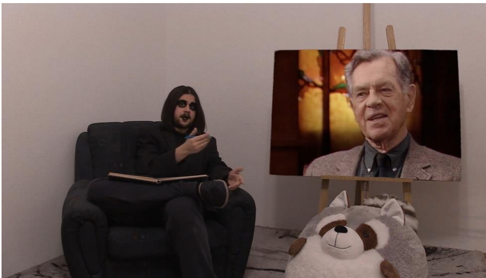
4. Scena iz videa, poglavlje De Stijl

De Stijl je to pokušao napraviti na globalnoj skali, i zato je spao na šarene kvadrate, nešto što bi čak i bebi bilo interesantno, i nešto što nikog neće zapravo uvrijediti. Znači, De Stijl je imao savršenu priliku pozabaviti se pričama svih prošlih naroda, i umjesto toga nam je dao šarene kvadrate. Campbellov arhetip heroja je ujedinio mnoge priče raznih naroda, na taj način da je našao jedinstvenu formulu za svu tu silnu mitologiju koja je preživjela test vremena. Takve stvari su u duhu onoga što je trebao biti doprinos De Stijla, a ne kvadrati.