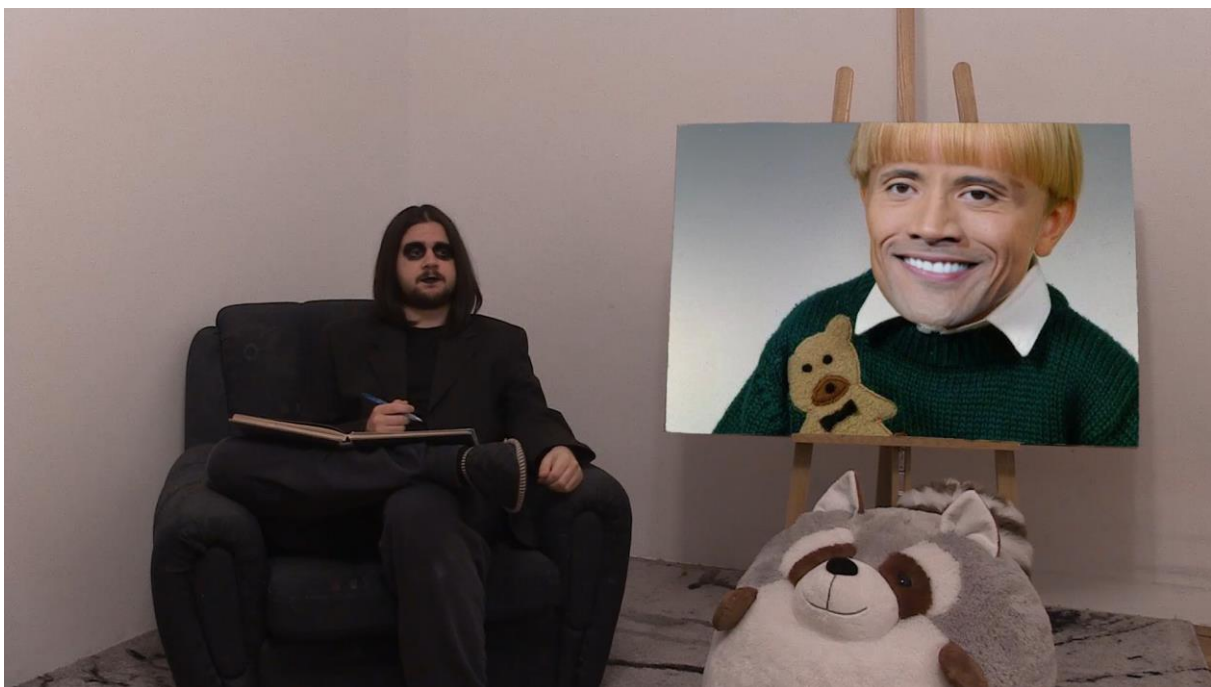
6. Scena iz videa, poglavlje Apstraktni ekspresionizam

Postoje mnoge teorije kako i zašto se ovaj stil probio. Jedna od njih je zato što je apolitičan. Ali, naravno, ovo je netočno. Ljudi koji su „dozvolili“ da se ovi radovi izlažu možda susmatrali da su ovi radovi apolitični, bez poruke. Međutim, ovi radovi itekako imaju poruku. Ta poruka je napuštanje pravila u potrazi za slobodom, u aktivnoj potrazi za impulsom i izazivanjem impulsa. O slobodi bi se svakako dalo raspravljati, ona je siva, ni dobra, ni loša. No impulzivnost je smjer u kojem se ni civilizacija ni individualac ne bi trebali kretati.