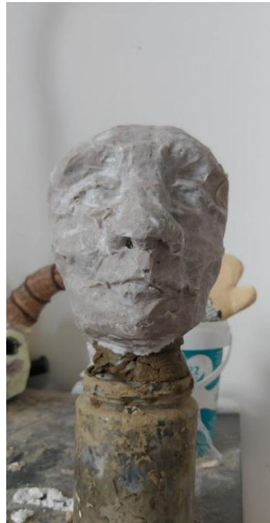
Slika IX. Prvi sloj kaširanja

Kasnije sam obložio samoljepljivu foliju preko cijele glave i utisnuo svaku poru reljefa.