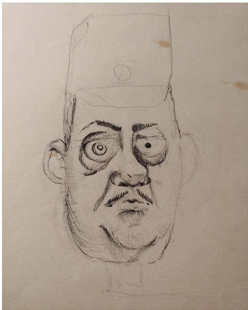
Slika II. Skica: glava lutke: Oficir

Oči sam nacrtao različite i time se dodaje nota ludosti i stresa. Što se tiče oslikavanja, u konačnici sam se koristio jarkim bojama.