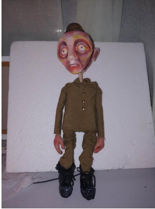
Slika XVI. Vojnik