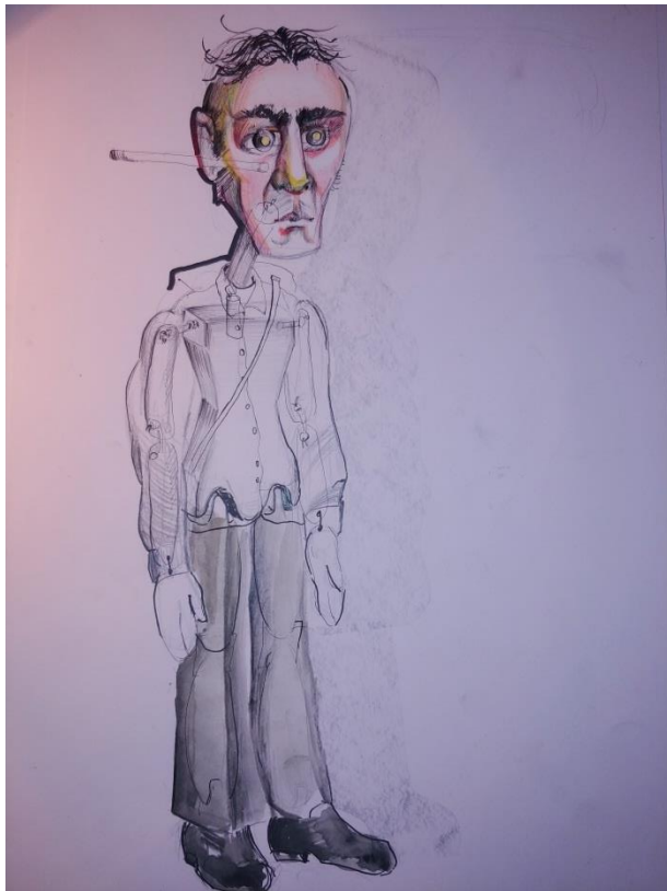
Slika VIII. Putnik

Putnikova pojava je sama po sebi već bila neobična. Razlog tome je taj da je kolonija funkcionirala na sebi svojstven način sve do putnikova dolaska. Zamišljao sam ga kao običnog slugu birokracije, koji ima crne štofane hlače i običnu bijelu košulju.