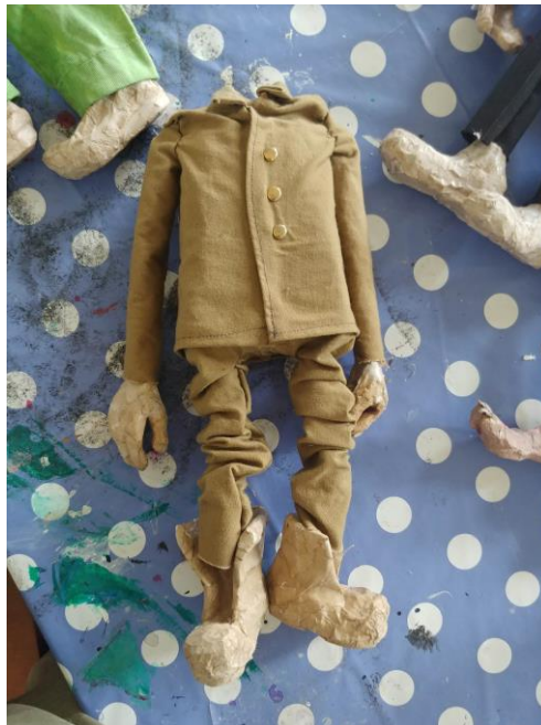
Slika XV. Spojeni dijelovi lutke s kostimom

Nakon što sam izradio sve dijelove lutaka, krenuo sam izrađivati kostime za lutke. Sve dijelove mogao sam spojiti kada sam imao gotove kostime. Kada sam sašio kostime, prvo sam ugurao udove u rukave i u hlače, pa sam ih tako mogao spojiti s torzom. Iznimka je bio zatvorenik, jer je on imao najjednostavniji kostim.