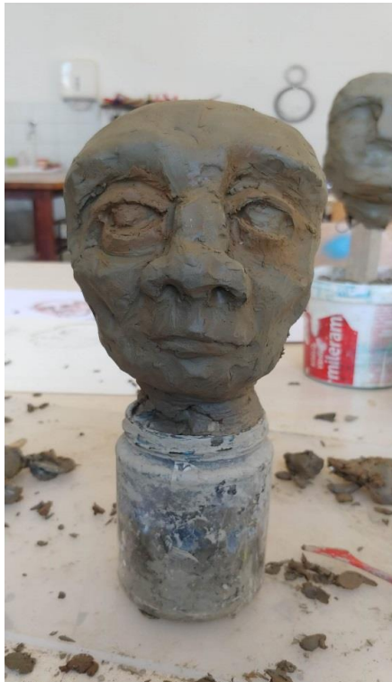
Slika VIII. Modeliranje zatvorenika

Kada sam odabrao tehniku stolnih lutaka, krenuo sam razmišljati o njihovoj materijalizaciji. Pri odabiru materijala razmišljao sam o stiroporu, glini i kaširanju. Prvo sam oblikovao portrete u glini. Oblikovao sam ih po skicama koje sam nacrtao. Poželjnije je da imaju veću glavu naspram tijela, jer glavne osobine karatera prvo vidimo na licu i u očima.