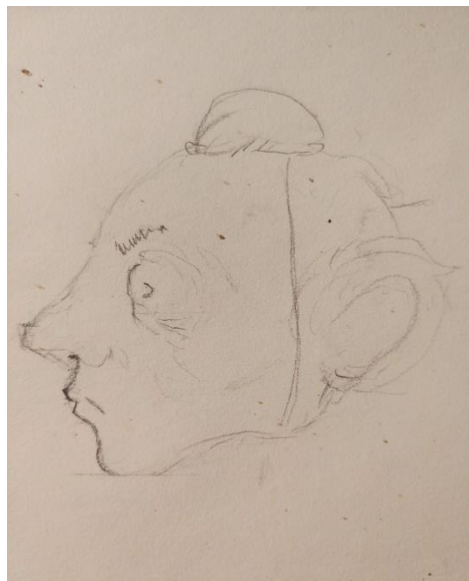
Slika III. Skica: glava lutke: Vojnik