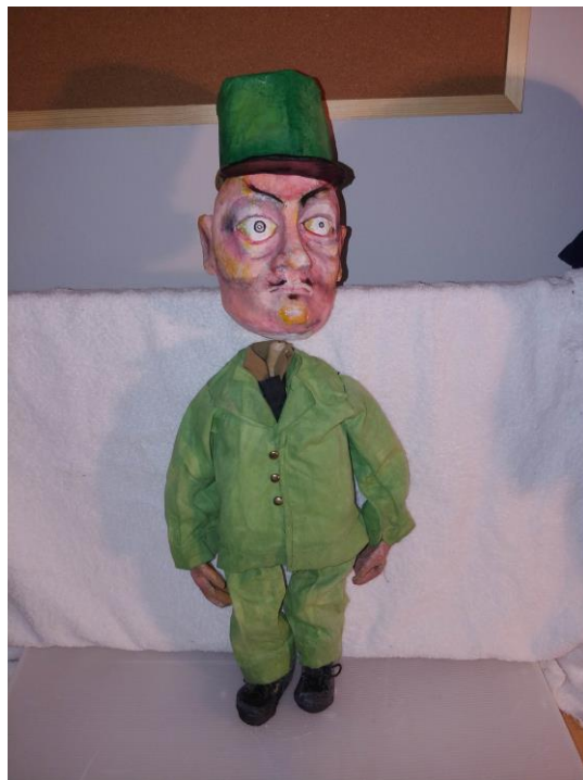
Slika XVII. Oficir