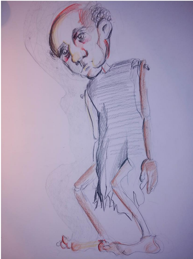
Slika VI. Zatvorenik

Kostim zatvorenika je najjednostavniji, jer predstavlja običan komad odrpane tkanine koja pokriva tijelo. Na taj način sam htio naglasiti veliku razliku između oficira i zatvorenika. Isto tako je vidljivo kako jadno i iscrpljeno može izgledati lik koji je bio žrtva sistema kojemu je služio. Također nam je jasniji čin potlačenosti i gaženja od strane oficira.