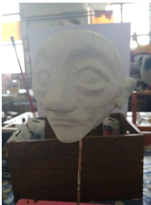
Slika XI. Sloj fasadne boje

Na baznu boju sam lagano mogao nanijeti sjene, linije i boje, koje su određene već na skici. Veću površinu glave sam oslikavao sa spužvicom, a datalje kistovima i markerima.