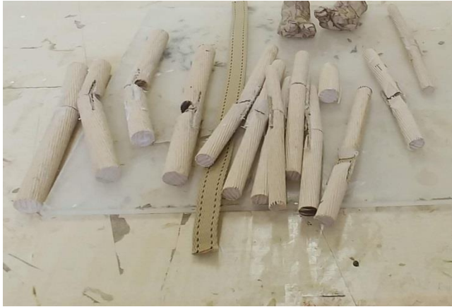
Slika XIII. Izrađeni udovi od gurni i drvenih tipli

Na svim lutkama sam kaširao glavu, ruke, trup i obuću. Udove sam oblikovao od drvenih tipli i spajao ih tapetarskom trakom, kako bih dobio pokretne zglobove, samo što sam za vrat umjesto tapetarske trake koristio gumene uzice.