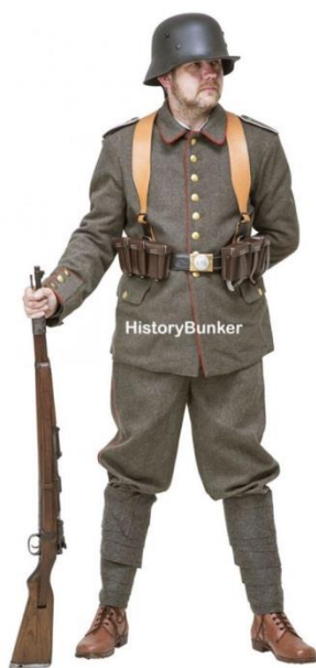
Slika VII. Nadahnuće s interneta 9

Najprije sam kompletirao sve likove koji su bili već u koloniji i očekivali putnikov dolazak. Na taj način sam si mogao zamisliti posebnu atmosferu koja je vladala između likova kolonije. To je također utjecalo na izgled njihovih karaktera. Inspiraciju za skicu vojnika sam također našao na dokumentiranim fotografijama Prvog svjetskog rata. Kostim čine crne vojničke čizme, koje sežu sve do koljena, te već navedena jednostavna vojnička odora i šljem.