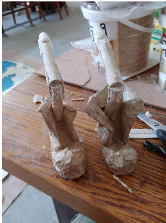
Slika XIV. Iskaširane čizme

Obuću sam modelirao u glini i odmah preko gline kaširao, jer mi je glina služila kao uteg. Veličina obuće na lutkama koju sam izradio bila je optimalna, jer bi u suprotnom glina bila pre teška i onda ne bi imala pravilnu funkciju utega.