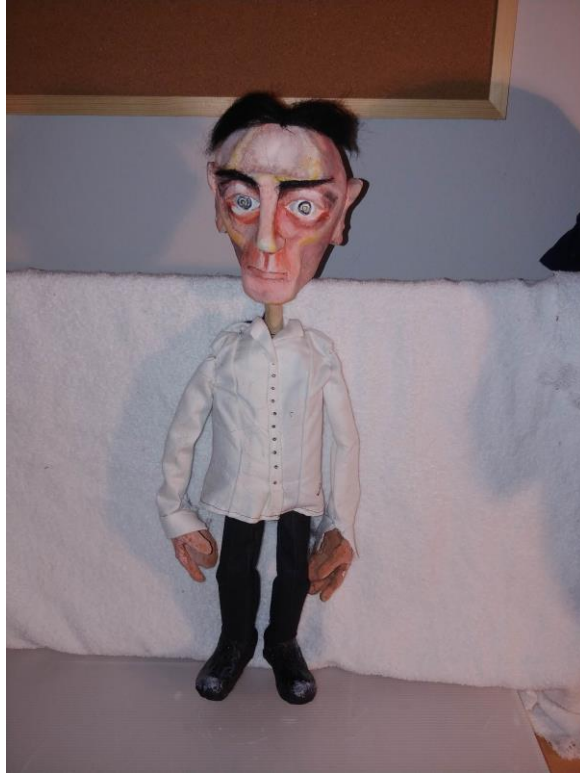
Slika XVIII. Putnik