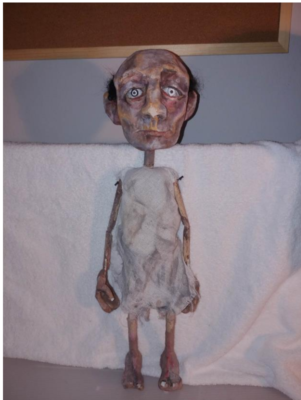
Slika XIX. Zatvorenik