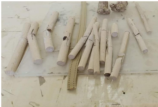
Slika XIII. Izrađeni udovi od gurni i drvenih tipli

Na svim lutkama sam kaširao glavu, ruke, trup i obuću. Udove sam oblikovao od drvenih tipli i spajao ih tapetarskom trakom, kako bih dobio pokretne zglobove, samo što sam za vrat umjesto tapetarske trake koristio gumene uzice.