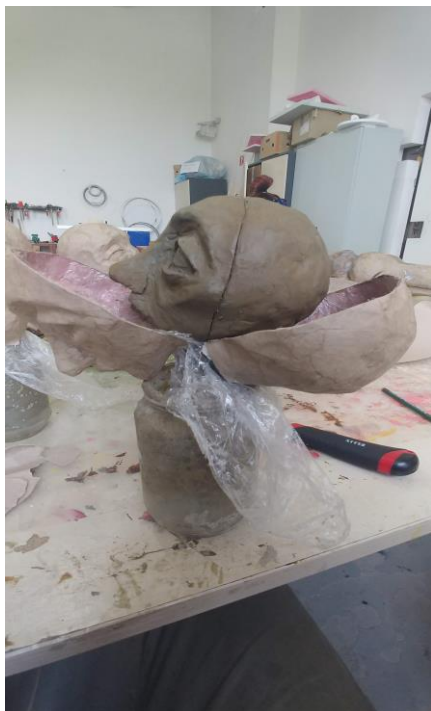
Slika X. Proces odvajanja kaširanog sloja od gline

Kada sam spojio i završio kaširane pozitive, mogao sam početi s oslikavanjem. Prvo sam morao nanijeti temeljnu boju - mješavinu fasadne boje i malo ljepila za drvo.