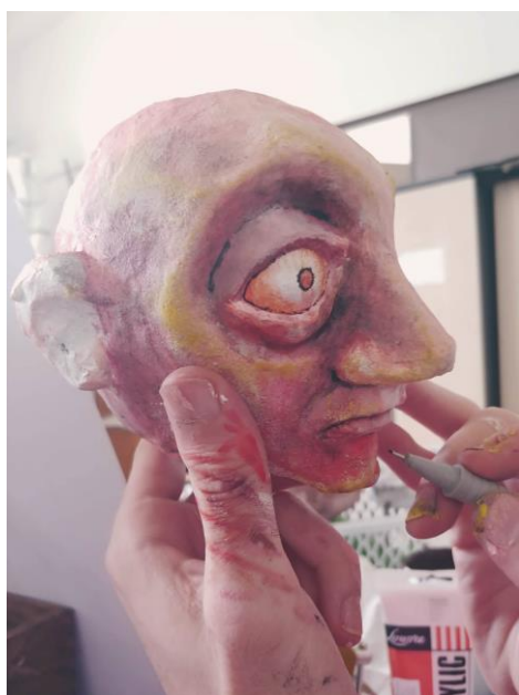
Slika XII. Oslikavanje glave

Na baznu boju sam lagano mogao nanijeti sjene, linije i boje, koje su određene već na skici. Veću površinu glave sam oslikavao sa spužvicom, a datalje kistovima i markerima.