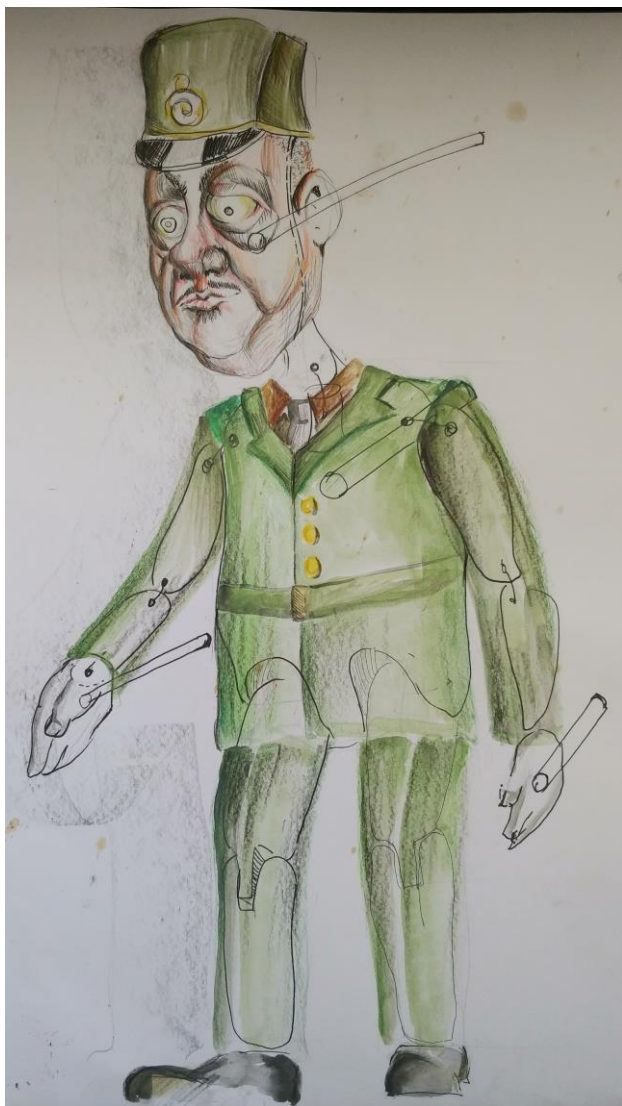
Slika V. Skica oficira

Nakon što sam odabirom boja i izrazom lica odredio sve karakere, slijedila je faza osmišljavanja kostima za sve likove. Za kostim sam također tražio inspiraciju u njemačkim feldmaršalima iz perioda Prvog svjetskog rata. Povijesne ličnosti imale su puno kompleksnije odore s puno detalja. U svojim skicama držao sam se pojednostavljene forme, kako bi se iz kroja i boje kostima lako moglo iščitati da lutka predstavlja visokog časnika.