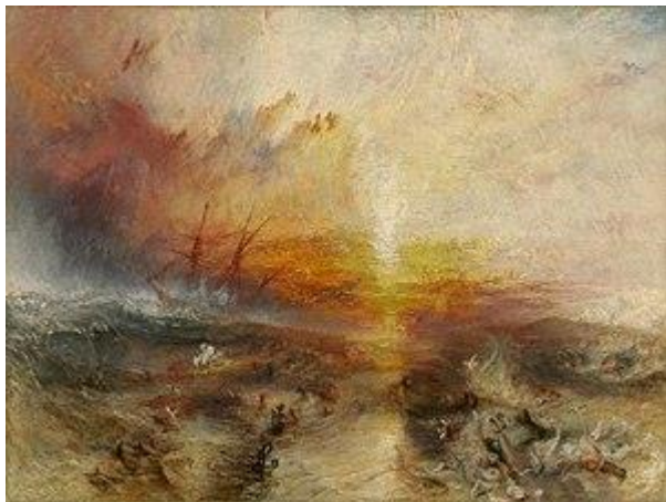
Slika IV. William Turner: "Brod s robljem" 8

Zatvorenik je kaznu zaslužio jer je zaspao na dužnosti i time je uvrijedio nadređene. Sama težina kazne za učinjeno djelo je enormna. Kafka time automatski postavlja čitatelju pitanje: trebamo li ga žaliti? Naravno, žalio sam ga jer je bio žrtva sistema koji se poigravao njegovom sudbinom. Pisac se kasnije poigravao s njegovim karakterom, davao mu je životnjska obilježja, čak nije niti jednu riječ izustio tijekom djela. Proizvodio je nejasne glasove i pokazivao je čudne izraze lica. Zamislio sam ga kao da je upravo on produkt cijelog sistema koji ga je tlačio. Bilo mu je čak svejedno hoće li biti pogubljen ili ne. Bio je zapravo najbolje utjelovljenje jednog roba. Isti taj koji je cijeli život služio sistemu. Tražio sam inspiraciju u najpoznatijim slikama poput: „Vožnja za slobodu“, „Crnački život na jugu“ Eastmana Johnsona, i „Brod s robljem“ Williama Turnera, koju sam i izabrao.