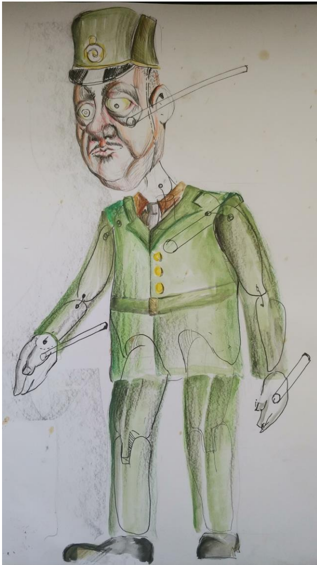
Slika V. Skica oficira

Nakon što sam odabirom boja i izrazom lica odredio sve karakere, slijedila je faza osmišljavanja kostima za sve likove. Za kostim sam također tražio inspiraciju u njemačkim feldmaršalima iz perioda Prvog svjetskog rata. Povijesne ličnosti imale su puno kompleksnije odore s puno detalja. U svojim skicama držao sam se pojednostavljene forme, kako bi se iz kroja i boje kostima lako moglo iščitati da lutka predstavlja visokog časnika.