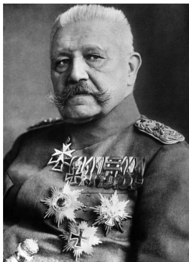
Slika I. Nadahnuće s interneta 7

Nakon što sam prvi put pročitao djelo, nije mi bilo lako odmah odlučiti kako će likovi izgledati. Karakteri su sami po sebi samozatajni i misteriozni. Kasnije sam istraživao ostale reference i filozofske osvrtne na tekst. Upravo to mi je uvelike pomoglo da pobliže upoznam sve likove. Na taj način su slike likova dolazile postepeno. Isto tako sam i skice crtao postepeno. Kod likova sam slijedio njihov način razgovora i količinu riječi koje izgovaraju. Naravno, jako je važno koju ulogu nose u djelu, ali je isto tako bitno kako se nose s tom ulogom. Karakter oficira većinom određuje turobnu i napetu atmosferu cijeloga djela. Često ispituje sebe i nazočne, vodi i pokreće dijaloge koji stalno osciliraju. Prateći njegov lik i ponašanje, tražio sam likovnu inspiraciju u oficirima i feldmaršalima iz Prvog svjetskog rata.