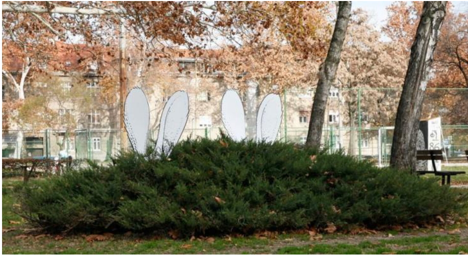
Slika 12: Primjer gerile za Hopa Cupa