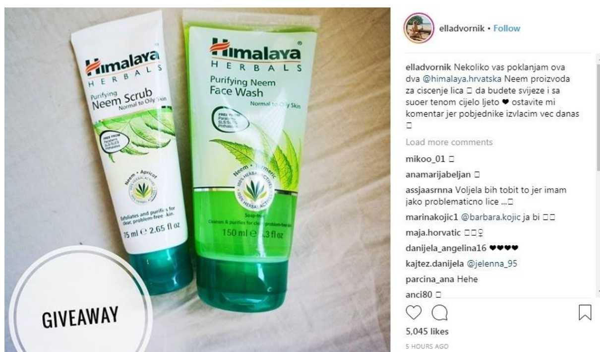
Slika 9: Primjer giveaway